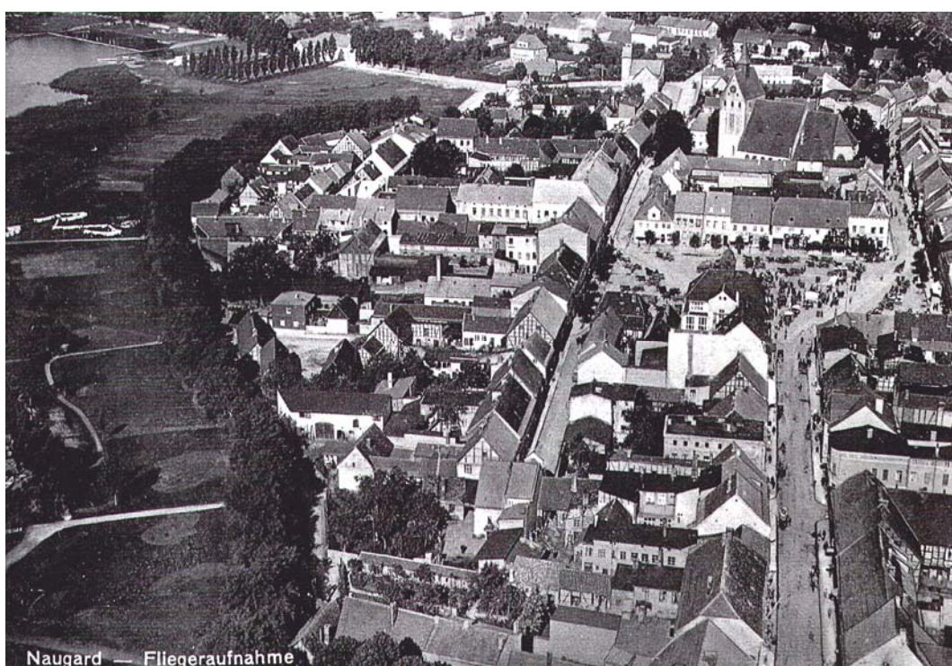
Ryc. 6. Przedwojenne zdjęcie lotnicze przedstawiające centrum Nowogardu (hist. Naugard) z tętniącym życiem placem miejskim i kościołem Wniebowzięcia NMP w tle.

ujednoliconego, całościowego systemu ciągów pieszych eksponujących i aktywizujących równomiernie wszystkie strefy centrum miasta. Również przestrzeń głównego placu miejskiego - Placu Wolności - nie jest czytelnie ukształtowana w obecnej strukturze urbanistycznej Nowogardu. Dotychczas wykonane zostały koncepcje terenów nad jeziorem Nowogardzkim oraz w rejonie ulic Kowalskiej z przeznaczeniem tych obszarów głównie na cele rekreacyjne. Strefy rekreacji przydomowej w wielkopłytkowej zabudowie m.in. os. Lubuszan oraz po wschodniej stronie miasta pozostają niezagospodarowane, a ich zły stan techniczny dodatkowo potęguje wrażenie dyskomfortu społecznego i nieładu przestrzennego.