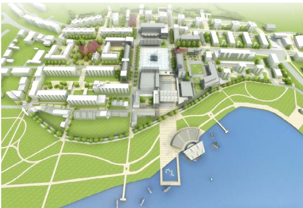
Ryc. 7. Widok z lotu ptaka koncepcji wzmocnienia kompozycyjnego bieguna na osi Wschód – Zachód, zawierającego obszar Placu Wolności.

Dodatkowo, myślą przewodnią było poszerzenie oferty kulturalnej miasta (głównie związanej z dziedzinami filmu, teatru itd.) o stworzenie tzw. „miejsca sztuki” na przedłużeniu Placu Wolności w kierunku jeziora Nowogardzkiego. Szczególną uwagę zwrócono na kulturalne rekreacyjne walory miasta w kontekście atrakcyjności oferty Nowogardu i konkurencyjności wobec innych gmin tej części województwa. Podstawą idei i przyjętych założeń było stworzenie poprzez prezentowaną koncepcję urbanistyczno - strukturalnych ram docelowych przekształceń przestrzeni miejskiej w kontekście idei zrównoważonego rozwoju.