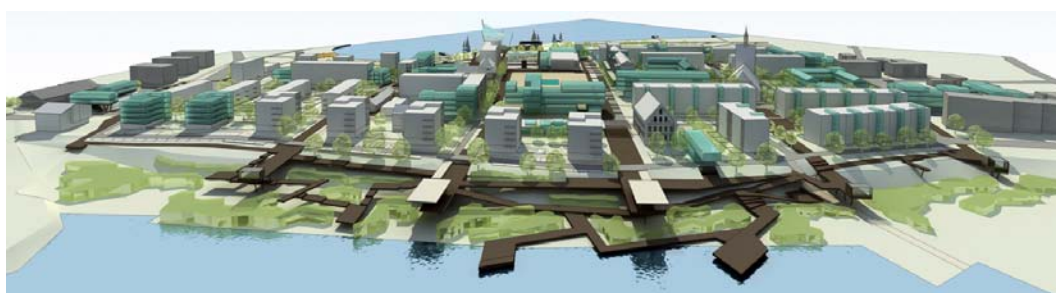
Ryc. 10. Wschodnie zakończenie „zielonego” bieguna miasta – ekologiczny system pomostów z tarasami widokowymi w sąsiedztwie Szuwarów Nowogardzkich, z widokiem na dawny Zamek.