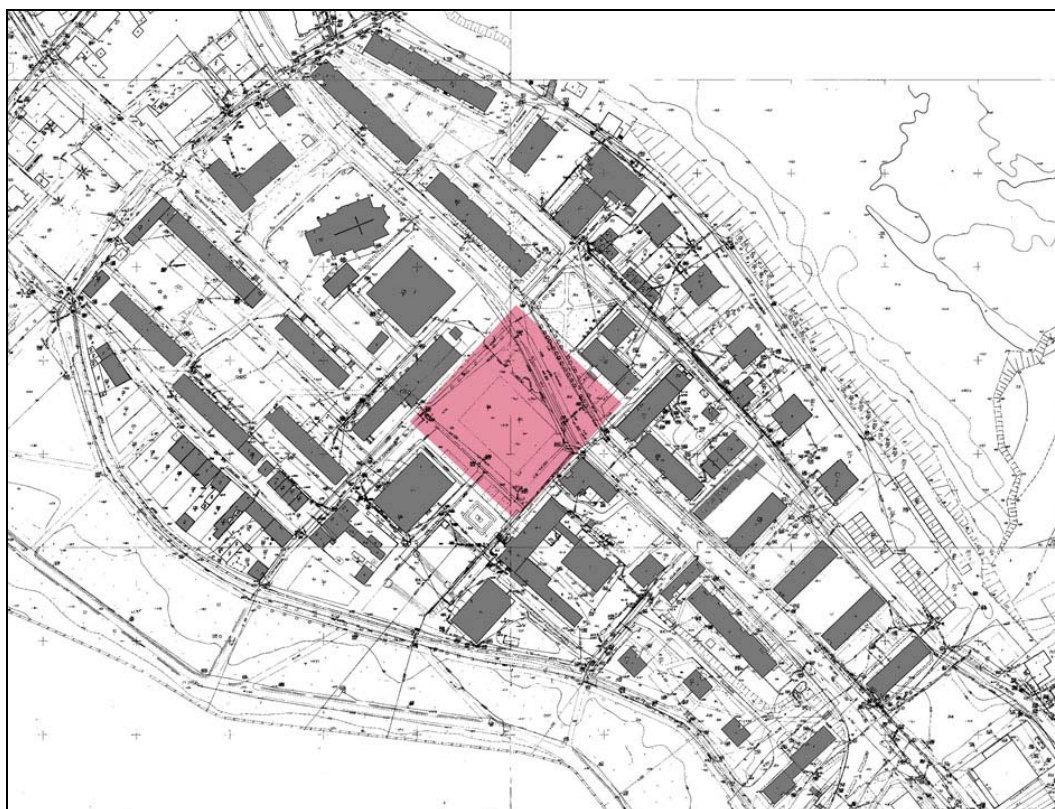
Ryc. 4. Zdeformowany układ urbanistyczny obecnego Nowogardu z punktową i liniową wielkopłytkową zabudową mieszkaniową. Prostokątem zaznaczono obszar dawnego placu miejskiego – obecnie Placu Wolności.

wisko” dla organizowania pochodów państwowych. Utrata skali urbanistycznej i klimatu była tak dotkliwa dla Nowogardu, że nawet wprowadzenie budynków o funkcji publicznej 7 nie pomogło odzyskać miastu swego charakteru – swych utraconych miejsc.