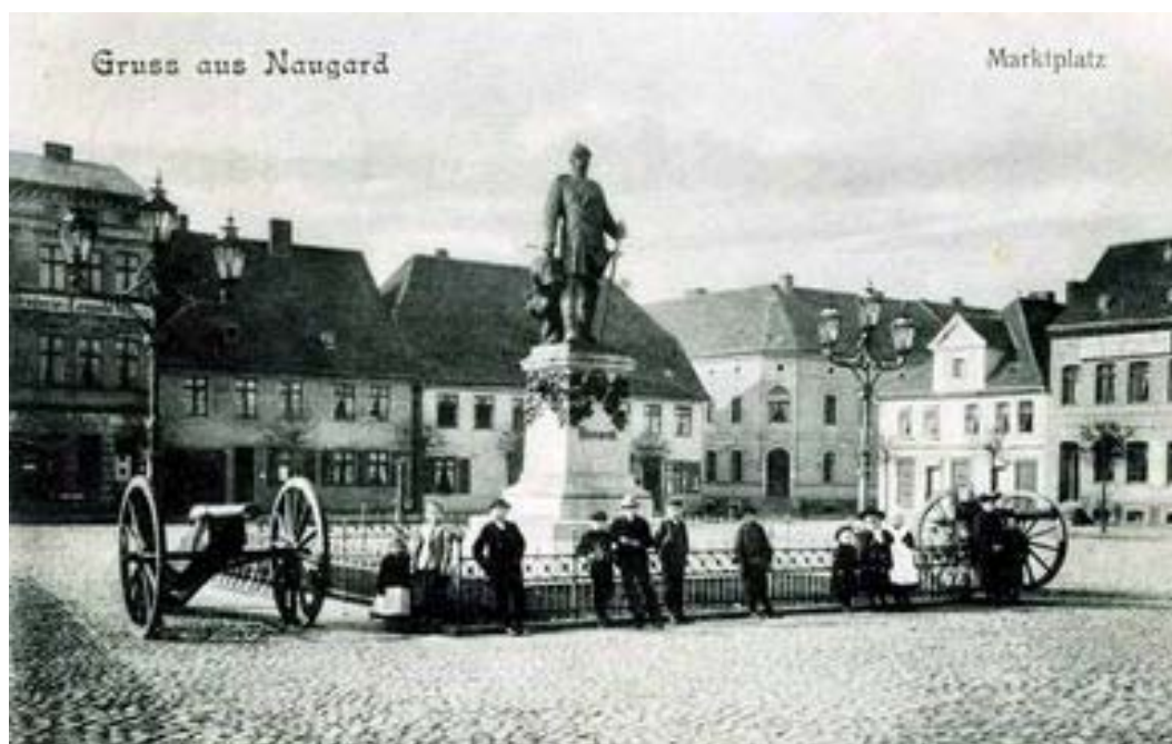
Ryc. 3. Przedwojenna pocztówka z Nowogardu – główny plac miejski.

Powojenne losy układu urbanistycznego Nowogardu to brutalna ingerencja liniowej zabudowy wielokątownej w obszar historycznego centrum. Na skutek działań urbanistycznych planistów i władz centralnych przestrzeń małego miasta została zdegradowana w stopniu na tyle silnym, że nawet przestrzeń głównego placu historycznego utraciła swoją geometrię przez przeprowadzoną arterią komunikacyjną tworzącą nową, nieuzasadnioną oś – granicę tnącą układ miejski na dwie części. Jedynymi pozostałościami dawnego układu są nieliczne budynki historyczne 5 i kościół 6 w swojej pierwotnej lokalizacji. Absurd działań z tamtego okresu dochodził do stopnia, kiedy nawet oryginalna brukowana posadzka placu miejskiego została decyzjami władz państwowych przeistoczona w „bezduszne płyto-