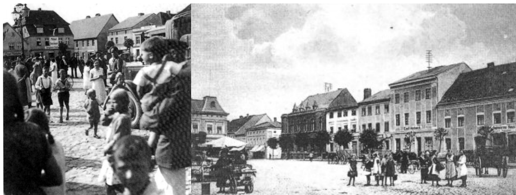
Ryc. 1. Utracone miejsce – przedwojenny klimat przestrzeni centralnego placu w Nowogardzie.

Proces zapominania miejsc może następować z różnych powodów, może następować miarowo z upływem czasu lub gwałtownie wskutek pojedynczych wydarzeń. Proces ten jest również bezsprzecznie związany z układem przestrzennym i jego czytelnością, bo to właśnie czytelność urbanistyczna jest łatwością z jaką człowiek doświadcza i rozumie kształt miejsca. 2 Odwrócenie tego procesu i przywrócenie lub ponowne nadanie charakteru miejsca pewnej przestrzeni miasta jest niezwykle trudnym wyzwaniem. Poszukiwania nowej tożsamości mogą trwać wiele lat, a niekiedy na skutek następujących procesów historycznych i przestrzennych, jest procesem prawie niemożliwym.