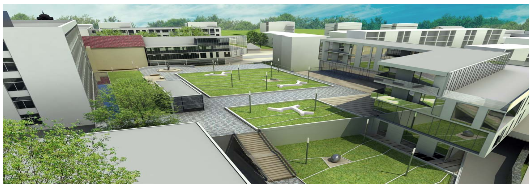
Ryc. 16. Zielone ogrody i przestrzeń wystawiennicza na parkingu podziemnym zlokalizowanym pod rewitalizowanym kwartałem w centrum miasta. Źródło: oprac. autora.

W koncepcji zaprojektowano podziemny wielopoziomowy parking w kwartale bezpośrednio przyległym do placu. Parking połączony bezpośrednio z budynkami biblioteki, dawnego hotelu i Urzędu Miasta ma obsługiwać zarówno gości przyjezdnych do strefy centrum, jak i mieszkańców centrum miasta. Uczytelniono również przebieg ulicy po wschodniej krawędzi miasta uzupełniając ją o miejsca postojowe dla zlokalizowanej tam zabudowy mieszkaniowej.