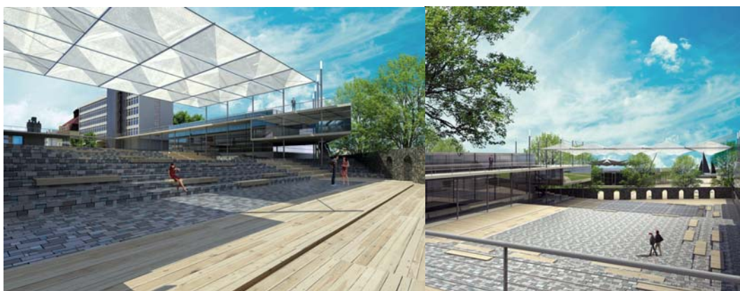
Ryc. 8. Proponowany klimat przestrzeni kultury i sztuki w bezpośrednim sąsiedztwie reprezentacyjnego Placu Wolności.

Dodatkowo, myślą przewodnią było poszerzenie oferty kulturalnej miasta (głównie związanej z dziedzinami filmu, teatru itd.) o stworzenie tzw. „miejsca sztuki” na przedłużeniu Placu Wolności w kierunku jeziora Nowogardzkiego. Szczególną uwagę zwrócono na kulturalne rekreacyjne walory miasta w kontekście atrakcyjności oferty Nowogardu i konkurencyjności wobec innych gmin tej części województwa. Podstawą idei i przyjętych założeń było stworzenie poprzez prezentowaną koncepcję urbanistyczno - strukturalnych ram docelowych przekształceń przestrzeni miejskiej w kontekście idei zrównoważonego rozwoju.