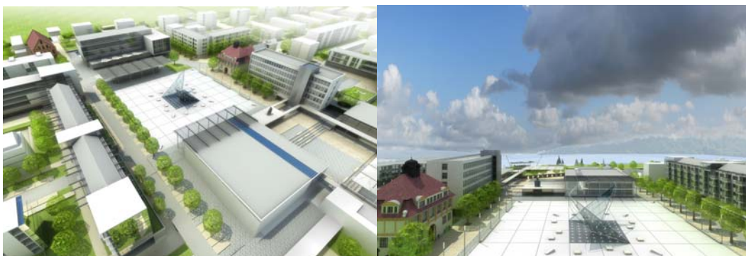
Ryc. 14. Widoki na proponowaną przestrzeń reprezentacyjnego Placu Wolności.

Jednym z największych wyzwań prezentowanej koncepcji było rozwiązanie problemów komunikacyjnych miasta, a konkretnie problemu głównej arterii komunikacyjnej przecinającej miasto, tzn. ul. 700-lecia. Zachodnie obejście komunikacyjne Nowogardu na pewno odciąży miasto z tranzytowego ruchu w kierunku wybrzeża. Stwarza to szansę dla Nowogardu na stworzenie wygodnego wewnętrznego układu komunikacyjnego dobrze obsługującego strefę centrum - pozbawionego jednak tak uciążliwego natężenia ruchu, jakie ma miejsce obecnie. W najbardziej postępowym wariantcie przekształceń przestrzeni miasta założono wpuszczenie głównej komunikacji na odcinku placu, pod jego powierzchnię. Umożliwiło to czytelne określenie granic placu (nawiązujące do jego historycznych granic) oraz zwrócenie przestrzeni ścisłego centrum mieszkańcom miasta jako miejsca wypoczynku, spotkań, pieszej przestrzeni - tzw. „salonu miasta”. Istniejący i proponowany szereg funkcji otaczających przestrzeń Placu Wolności stwarza miejsce atrakcyjne dla mieszkańców miasta, miejsce goszczące najważniejsze wydarzenia miasta, wreszcie miejsce eksponujące rangę i estetykę obiektu Urzędu Miasta. Wprowadzono zatem komunikację pieszojezdną po obwodzie placu z dodatkowymi miejscami postojowymi.