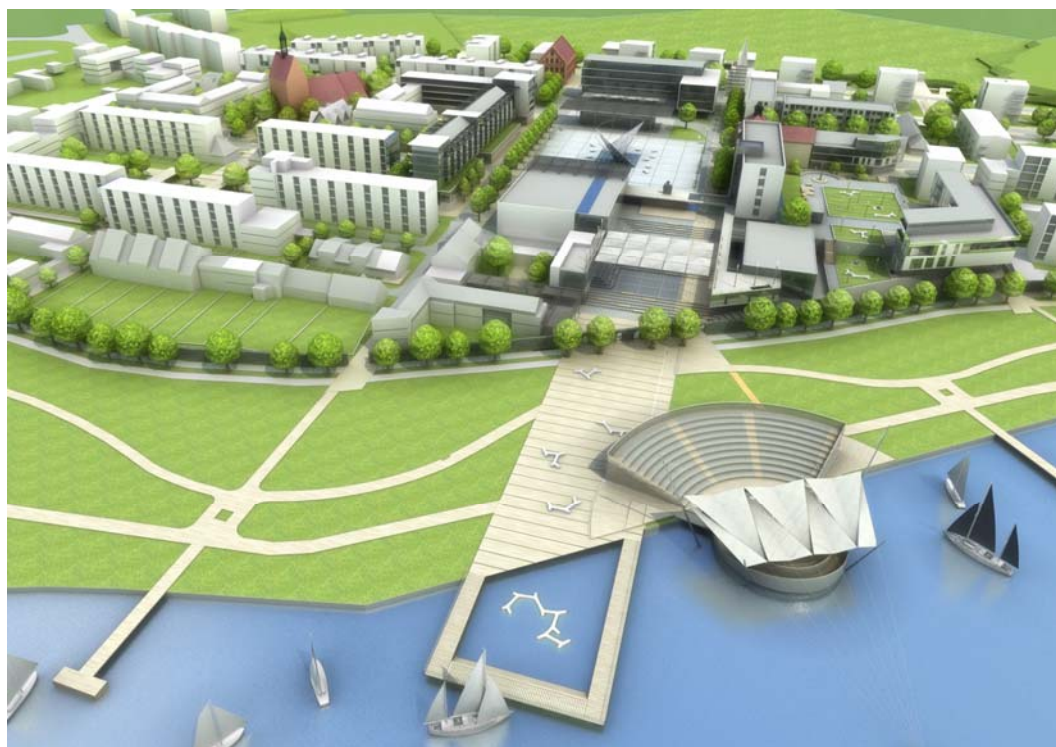
Ryc. 9. Zachodnie zakończenie „zielonego” bieguna miasta – obszary rekreacyjno – kulturalne nad jez. Nowogardzkim z charakterystycznym nowym „landmarkiem” – amfiteatrem na wodzie.