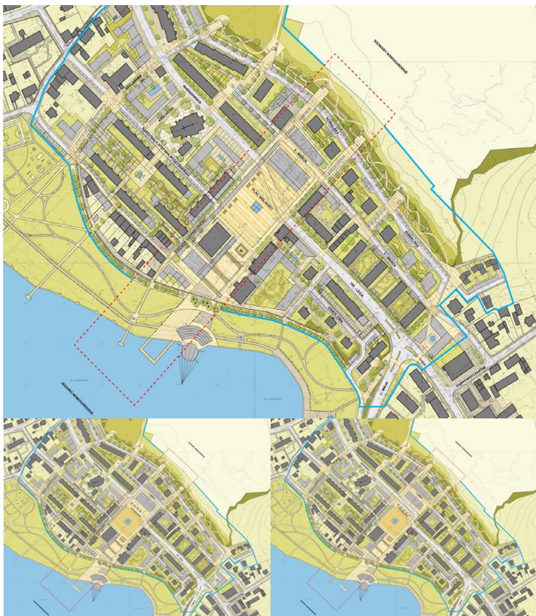
Ryc. 17. Koncepcja transformacji centrum Nowogardu i obszaru wokół Placu Wolności. Warianty 1 (na górze), 2 (po lewej u dołu) oraz 3 (po prawej u dołu).

W wariant 2. przyjęto rozwiązanie naziemnej komunikacji poprowadzonej po zewnętrznym obrysie prostokątnej przestrzeni placu, na zapleczu nowoprojektowanego obiektu usługowo-mieszkalnego. W wariant 2. przyjęto również rozbudowę budynku Domu Kultury, ale o 1 skrzydło flankujące projektowane „miejsce sztuki” oraz zaproponowano rewitalizację kwartału zabudowy za Domem Kultury. Wariant 3. zakłada również naziemną ul. 700-lecia w nieco zmienionym, jednak zbliżonym do obecnego, niezwykle niekorzystnego przebiegu przez plac. Odcinek ulicy na Placu Wolności przesunięto w stronę wschodnią i zmieniono geometrię jej przebiegu na zgodną ze strukturą urbanistyczną miasta. W zakresie struktury urbanistycznej i zabudowy pozostaje taki sam jak wariant 2.