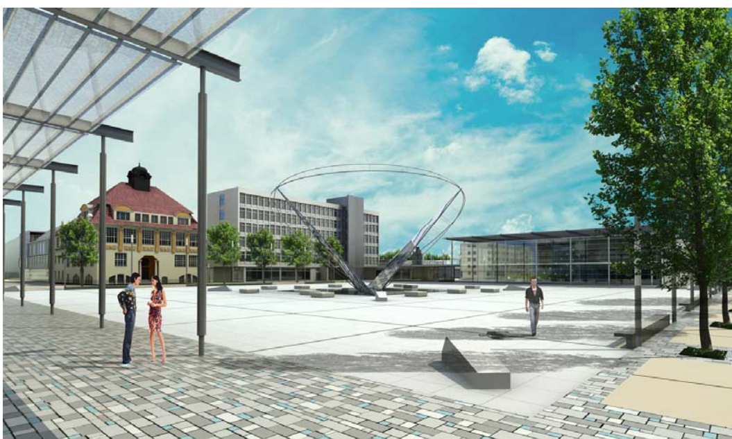
Ryc. 15. Wizualizacja Placu Wolności z nowym elementem architektonicznym fontanny multimedialnej w miejscu dawnego pomnika Bismarcka.

Jednym z największych wyzwań prezentowanej koncepcji było rozwiązanie problemów komunikacyjnych miasta, a konkretnie problemu głównej arterii komunikacyjnej przecinającej miasto, tzn. ul. 700-lecia. Zachodnie obejście komunikacyjne Nowogardu na pewno odciąży miasto z tranzytowego ruchu w kierunku wybrzeża. Stwarza to szansę dla Nowogardu na stworzenie wygodnego wewnętrznego układu komunikacyjnego dobrze obsługującego strefę centrum - pozbawionego jednak tak uciążliwego natężenia ruchu, jakie ma miejsce obecnie. W najbardziej postępowym wariantcie przekształceń przestrzeni miasta założono wpuszczenie głównej komunikacji na odcinku placu, pod jego powierzchnię. Umożliwiło to czytelne określenie granic placu (nawiązujące do jego historycznych granic) oraz zwrócenie przestrzeni ścisłego centrum mieszkańcom miasta jako miejsca wypoczynku, spotkań, pieszej przestrzeni - tzw. „salonu miasta”. Istniejący i proponowany szereg funkcji otaczających przestrzeń Placu Wolności stwarza miejsce atrakcyjne dla mieszkańców miasta, miejsce goszczące najważniejsze wydarzenia miasta, wreszcie miejsce eksponujące rangę i estetykę obiektu Urzędu Miasta. Wprowadzono zatem komunikację pieszojezdną po obwodzie placu z dodatkowymi miejscami postojowymi.