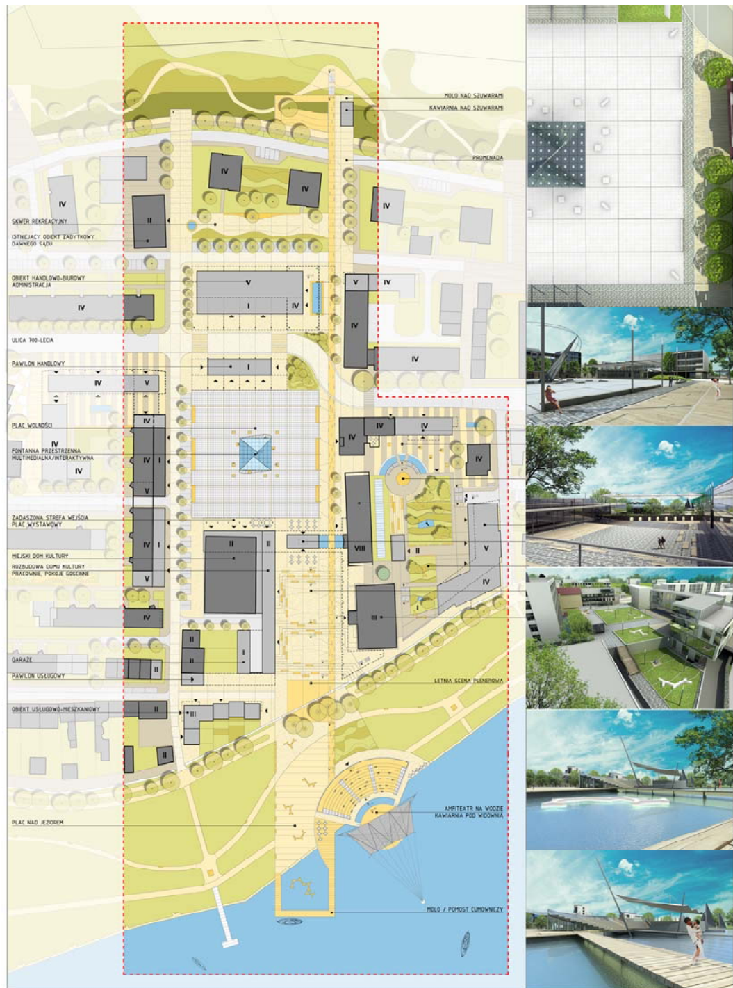
Ryc. 18. Szczegółowa koncepcja zagospodarowania terenu tzw. „zielonego” bieguna miasta z wizualizacjami poszczególnych przestrzeni wchodzących w skład głównej osi kompozycyjnej proponowanego układu urbanistycznego.