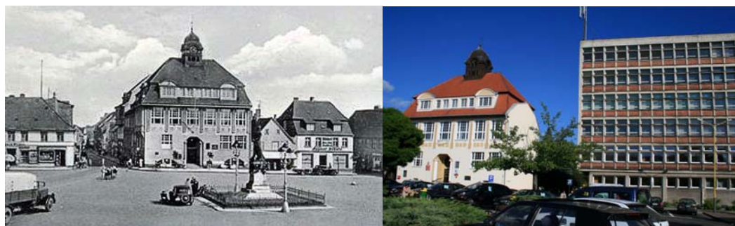
Ryc. 5. Nowogard – widok pierzei głównego placu z budynkiem Urzędu Miasta – dawniej (po lewej), i obecnie (po prawej).

W aspekcie urbanistycznym obecny układ miasta Nowogard zatracił historyczną zasadę miasta o prostokątnej siatce ulic z centralnym placem - rynkiem miejskim. Proces odbudowy, wprowadzenie liniowej i punktowej zabudowy wielkopłytkowej do centrum miasta zdeformowały historyczną strukturę miasta. Główny plac miejski został przecięty arterią komunikacyjną, która poprzez swoją rangę i natężenie ruchu podzieliła miasto na dwie połowy oraz zmieniła jego strukturę na liniową, zamiast historycznie uwarunkowanej struktury zbudowanej wokół centralnego placu / rynku miejskiego.