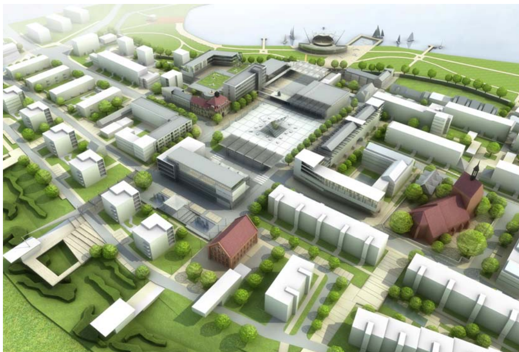
Ryc. 13. Przestrzeń centrum w rejonie Placu Wolności – widok z lotu ptaka. Wizualizacja.

Wprowadzone prostopadłe kierunki piesze przecinające przestrzeń zabudowy mieszkaniowej związane z rekreacją wewnątrz mieszkalnych uczyniając ich strefowanie i dodając nowe funkcje do przestrzeni pół-prywatnych. Uporządkowany system ciągów pieszych uzasadnia również uzupełnienie zabudowy miejskiej w różnych jej fragmentach o nowe budynki z funkcjami uatrakcyjniającymi „zielony” trakt wokół miasta.