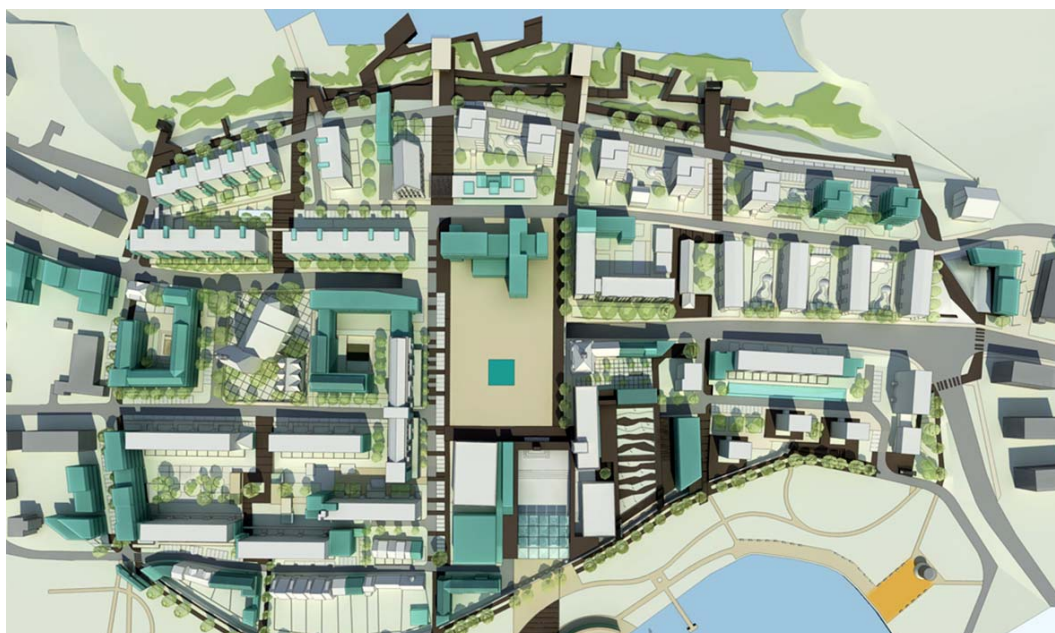
Ryc. 11. Wizualizacja z lotu ptaka z wyróżnieniem proponowanych przekształceń urbanistycznych porządkujących układ przestrzenny centrum.

Po drugie zaprojektowano czytelny system ciągu pieszego o funkcjach rekreacyjnej, edukacyjnej, kulturalnej i przyrodniczej wokół przestrzeni centrum miasta. Charakterystyczny ciąg przeprowadzono po linii historycznych murów miejskich. Szczególnym celem wprowadzenia ciągu było zaktywizowanie przywrócenie funkcji miejskich terenom położonym po wschodniej stronie miasta na styku z Szuwarami Nowogardzkimi. Na przestrzeni wspomnianego „zielonego” ciągu zaprojektowano szereg nowych funkcji dla równomiernego zaktywizowania obszaru wokół centrum. Wprowadzono m.in. ekologiczny system pomostów z tarasami widokowymi, stanowiska edukacyjne związane z pomostami sięgającymi w głąb Szuwarów Nowogardzkich, rekreacyjne altany wypoczynkowe, kawiarnie z ogródkami letnimi, drobne usługi, obiekty kulturalne i inne.