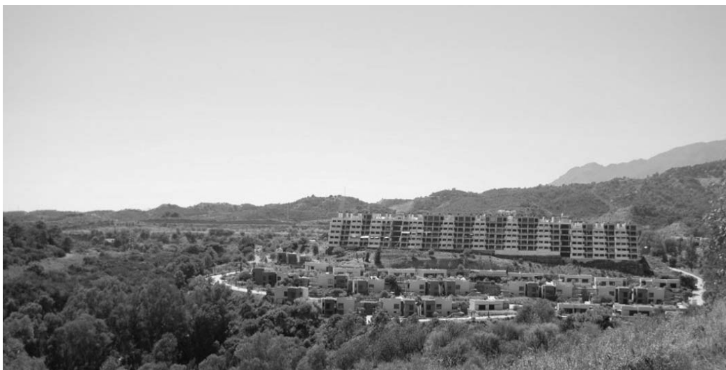
Ryc. 3. Nowe formy zabudowy apartamentowej na zboczach Sierra Blanca. Fig. 3. New forms of apartment houses on the slopes of Sierra Blanca.

Ale również, a może przede wszystkim, na terenach nadmorskich Andaluzji inwestowali Hiszpanie mieszkający w zatłoczonych miastach hiszpańskiego interioru, gdzie przeżycie gorącego okresu letniego w temperaturach ok. 40 st.C wydaje się graniczyć z niemożliwością. Wraz z wzrostem dobrobytu społeczeństwa hiszpańskiego, cykliczna, doroczna migracja całych rodzin nad Morze Śródziemne w okresie letnim, stała się bezpośrednią i najbardziej powszechną przyczyną rozwoju inwestycji turystycznych w pasie nadmorskim, w szczególności obiektów apartamentowych. O ile duża część wczasowiczów korzystała i nadal korzysta z licznych kempingów nadmorskich, coraz większa grupa Hiszpanów kupuje apartamenty i domy wakacyjne.