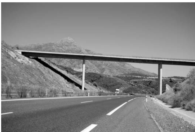
Ryc. 7. Nowa autostrada wciną się w istniejący układ topograficzny.

Żeby nieco złagodzić to krytyczne spojrzenie, trzeba przyznać, że klimat Costa del Sol nie sprzyja rozwojowi roślinności na terenach nie podlegających kultywacji. Zieleni występuje praktycznie tylko tam, gdzie o nią się dba. Lasy naturalne zostały już dawno wykorzystane dla celów gospodarczych lub uległy pożarom, tak częstym w tym obszarze. Ten zdecydowanie inny stosunek do przestrzeni naturalnej i do krajobrazu otwartego, jest widoczny dla przybysza z Europy Północnej szczególnie wyraźnie. Dotyczy to również metod prowadzenia dróg, autostrad i związanej z nimi infrastruktury. Trasy komunikacyjne są wycinane w terenie w sposób nieliczący się z zastaną topografią, a w zasadzie podporządkowujący układ naturalny terenu potrzebom infrastruktury.