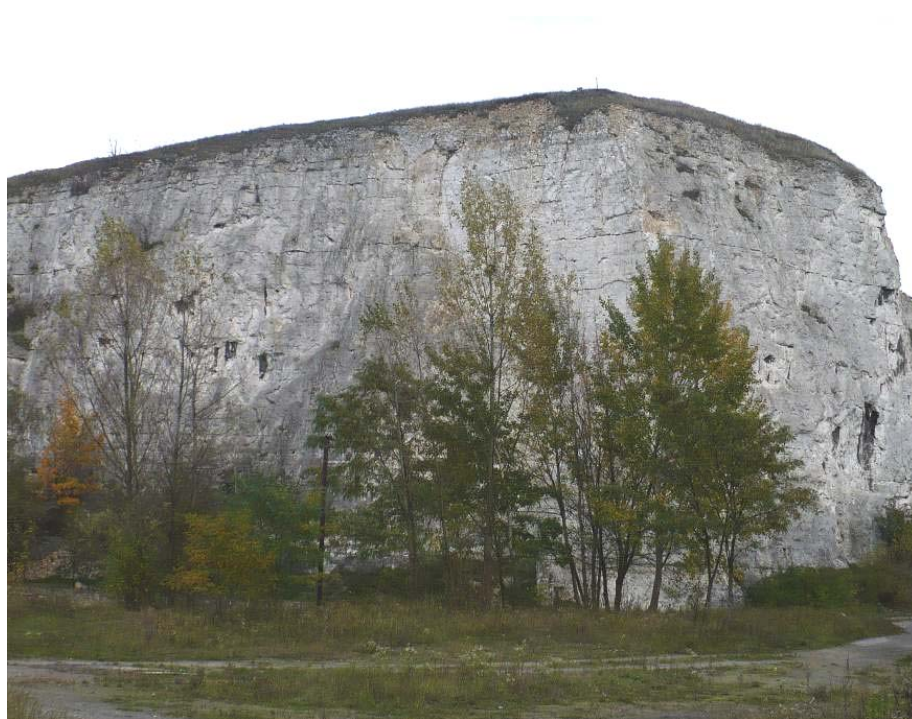
Ryc. 3. Wapienna ściana kamieniołomu Liban, źródło: Opracowanie własne, 2008.

miejskiej. Duże zmiany w szacie roślinnej spowodowała eksploatacja wapienia w kamieniołomach Krzemionek Podgórskich. Obecnie na obszary badanych wyrobisk wkraczają zarośla i drzewa, choć w większości nieczynne kamieniołomy porastają zbiorowiska roślinne o charakterze murawowym lub murawowo-zaroślowym oraz zbiorowiska kserotermiczne. Krzemionki Podgórskie to jedno z nielicznych miejsc w obrębie Krakowa, w których występują obecnie murawy kserotermiczne.