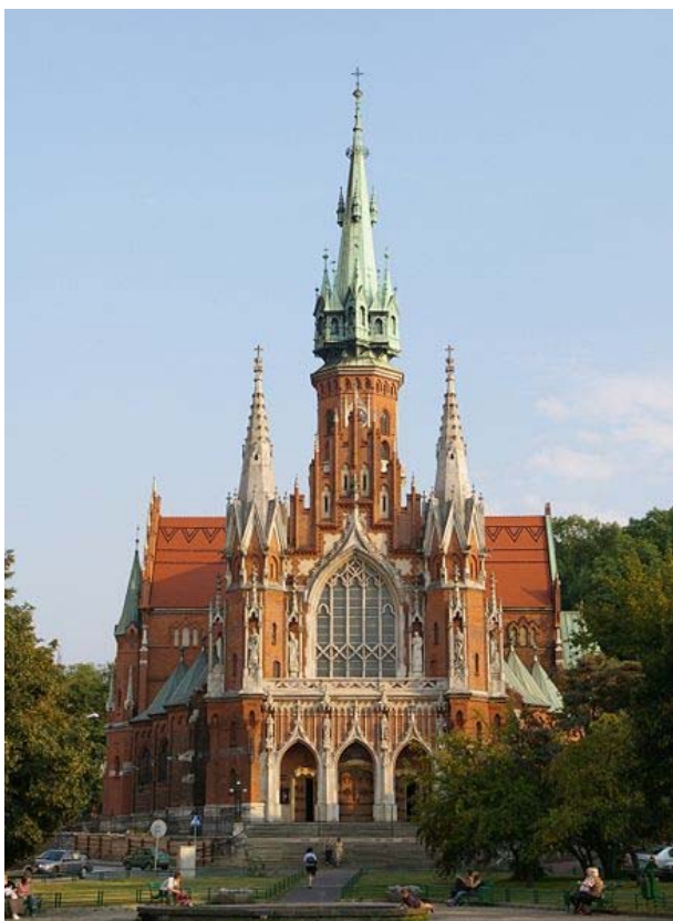
Ryc. 5. Neogotycki Kościół św. Józefa.

na jest przez fakt, iż z świątynią tą związany był Karol Wojtyła. Jeszcze za czasów jego pracy jako robotnik w kamieniołomach krakowskich, często wstępował do tego kościoła. Później już jako biskup pełnił tu funkcję duszpasterza, a następnie jako metropolita krakowski – kardynał, a potem arcybiskup Wojtyła często przybywał do podgórskiego kościoła redemptorystów dbając o właściwy poziom powstałego tam duszpasterstwa. Jako wyraz wdzięczności za posługę duszpasterską oraz wielokrotną obecność w tej świątyni, w 1988 roku na murach kościoła zamieszczono tablicę pamiątkową w 10 rocznicę pontyfikatu Jana Pawła II 10 .