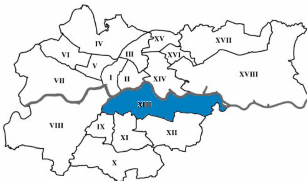
Ryc. 1. Położenie Podgórza na tle granic administracyjnych Krakowa.

Podgórze jest obecnie jedną z 18 dzielnic, wchodzących w obręb terytorium miasta Krakowa (il. 1). Dzielnica XIII na północy graniczy ze śródmiejską częścią Krakowa, Starym Miastem, od którego oddzielona jest naturalną granicą – Wisłą.