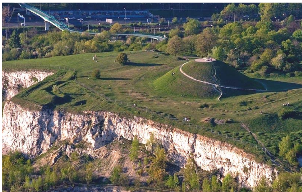
Ryc. 4. Widok na kopiec Kraka od strony kamieniołomu Liban, Źródło: www.krakow4u.pl Fig. 4. View of the mound of Krak from the quarry Liban, source: www.krakow4u.pl

są tutaj naskalne zbiorowiska roślinne – płyty ciepłolubnych muraw. Charakteryzują się one urozmaiconym składem florystycznym, występują na glebach zasobnych w wapń. Zbiorowiska te są dużą ozdobą krajobrazu południowej i zachodniej części Krakowa i w pełni zasługują na ochronę konserwatorską. Duże znaczenie ma również występowanie we wnętrzu kamieniołomu licznych chronionych gatunków płazów m.in. padalców czy też jaszczurek zwinek. 5 Na atrakcyjność tego miejsca wpływa dodatkowo fakt, iż sąsiaduje on z kopcem Krakusa.