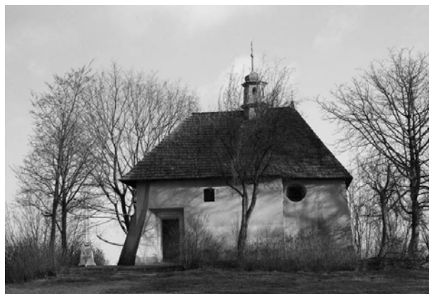
Ryc. 7. Kościół św. Benedykta Fig. 7. Church of St. Benedict

Wśród zabytków architektury sakralnej na terenie Podgórza występują również kapliczki , czyli obiekty tzw. małej architektury. Obiekty te są nierozdzielalnym elementem pejzażu miejskiego i wiejskiego jako obiekty sztuki sakralnej, posiadające indywidualną historię, wynikającą z obyczaju religijnego, niejednokrotnie zapisem tragicznych wydarzeń i zarazem rzeźbą plenerowa o wartościach artystycznych. Na obszarze Podgórza odnaleźć można kapliczki reprezentujące różne typy: kapliczki „domkowe”, grotty (Grota z figurą Matki Bożej Różańcowej przy ul. Krzemionki), figury i krzyże przydrożne. Zgodnie z badaniami G. Zań-Ograbek 13 w obrębie badanej dzielnicy XIII znajduje się obecnie 10 kapliczek. Wśród nich znajdują się zarówno obiekty współczesne (Krzyż misyjny przy ul. Saskiej z 1978 roku, Figura Matki Boskiej na skrzyżowaniu ul. Parkowej i Kraka z 1991 roku), jak i mające dłuższą historię (Figura Boga Ojca z II połowy XIX wieku na skrzyżowaniu ul. Wielickiej i Al. Powstańców Śląskich).