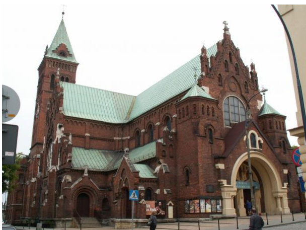
Ryc. 6. Redemptorist Chuch.