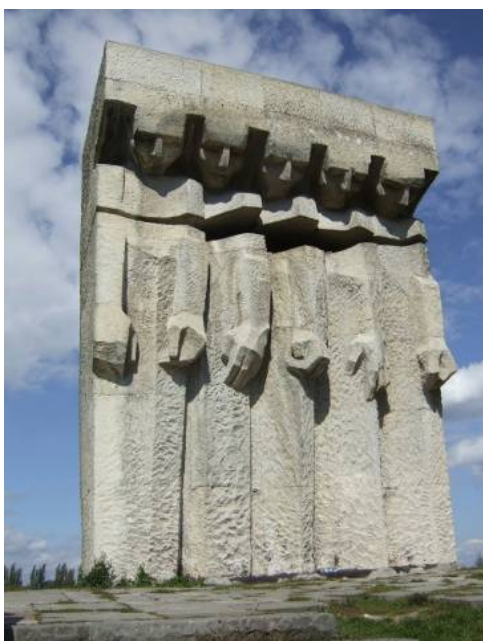
Ryc. 9. Pomnik poległych Płaszów Fig. 9. Monument to the Fallen Płaszów

ocalając im tym samym życie 26 . Niezwykle istotne znaczenie historyczne posiada podgórski Plac Niepodległości . To jedno z najważniejszych miejsc narodzin II Rzeczypospolitej. Plac usytuowany jest w pobliżu Rynku Podgórskiego i ograniczony ulicami Kalwaryjska i Zamoyskiego. Jest to pierwsze miejsce w całym Krakowie wyzwolone z rąk zaborców podczas akcji polskich oddziałów w październiku 1918 roku. W tym miejscu powstał w tym czasie ośrodek operacyjny akcji wyzwolenia Krakowa. Poza walorami faktograficznymi (miejsce pamięci narodowej) całość placu posiada wybitne walory krajobrazowe: ekspozycja budowli Kazimierza i Wawelu, mostu im. Piłsudskiego oraz schody do Parku Bednarskiego 27 . W sąsiedztwie Placu istniały koszary, po których zostało obecnie tylko puste miejsce, lecz niezabudowany plac jest niewątpliwie jedną z możliwości upamiętnienia wydarzeń, które miały tu niegdyś miejsce. Zagospodarowanie placu jest obecnie aranżowane w taki sposób, by jak najlepiej oddawało swoją funkcję miejsca pamięci narodowej.