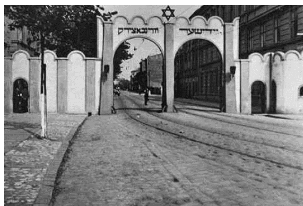
Ryc. 8. Brama do getta w Podgórzu, źródło: www.holocaustresearchproject.org/ghettos/krakow/krakow

zagłady. Wydarzenia te niejednokrotnie były okrutne i krwawe. Na tym placu również wymordowano dzieci i starców podczas likwidacji getta. Podczas wysiedleń z krakowskiego getta rozpoczęto równocześnie budowę obozu koncentracyjnego na terenie cmentarza żydowskiego w Płaszowie. Budowa obozu koncentracyjnego przyspieszyła decyzję o likwidacji podgórskiego getta, która zapadła ostatecznie 13 marca 1943 roku. Część Żydów zostało wywiezionych do obozu koncentracyjnego Auschwitz, pozostali do obozu płaszowskiego.