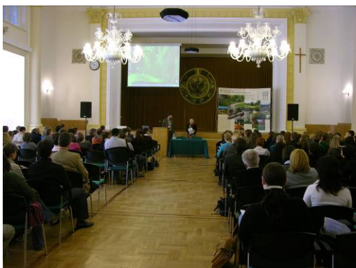
Il.7. Seminarium Stowarzyszenia Architektury Krajobrazu w Sali Kryształowej SGGW w Warszawie, marzec 2009.