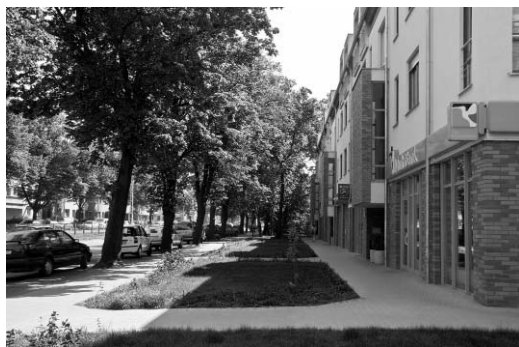
Il. 2. Widok od ul. Mickiewicza na kompleks zabudowy mieszkaniowo-usługowej zlokalizowanej przy skrzyżowaniu z ul. Lelewela. Źródło: fot. autora, 2009

Pic. 1. The high-riser of Polish TV in Szczecin located at Niedziałkowskiego street. Source: author's photo