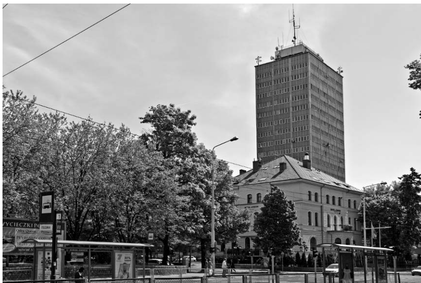
Il. 1. Wieżowiec Telewizji Polskiej SA Oddział Szczecin zlokalizowany przy ul. Niedziałkowskiego.

takiego błędu, jakim było ulokowanie wieżowca telewizji w rejonie okazałych willi wspaniałej dzielnicy Westend (il. 1). Celem artykułu jest przedstawienie kilku wybranych przykładów współczesnych realizacji, które przyczyniły się do wzbogacenia Szczecina o nowe wartości architektoniczne i przestrzenne.