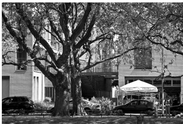
Il. 9. Widok na nową zabudowę ze ścieżki spacerowej wzdłuż Jasnych Błoni. Pic. 9. View to the new buildings from pedestrian walk along Jasne Błonia.

Bez wątplenia, spoglądając na wspomniane w artykule przedsięwzięcia budowlanego, można nabrać przekonania, że po długich powojennych latach kontrowersyjnych eksperymentów architektonicznych i urbanistycznych współczesna architektura przestaje kojarzyć się z deformacją i ponownie zaczyna cieszyć pięknem narastania (il. 8, il. 9, il. 10).