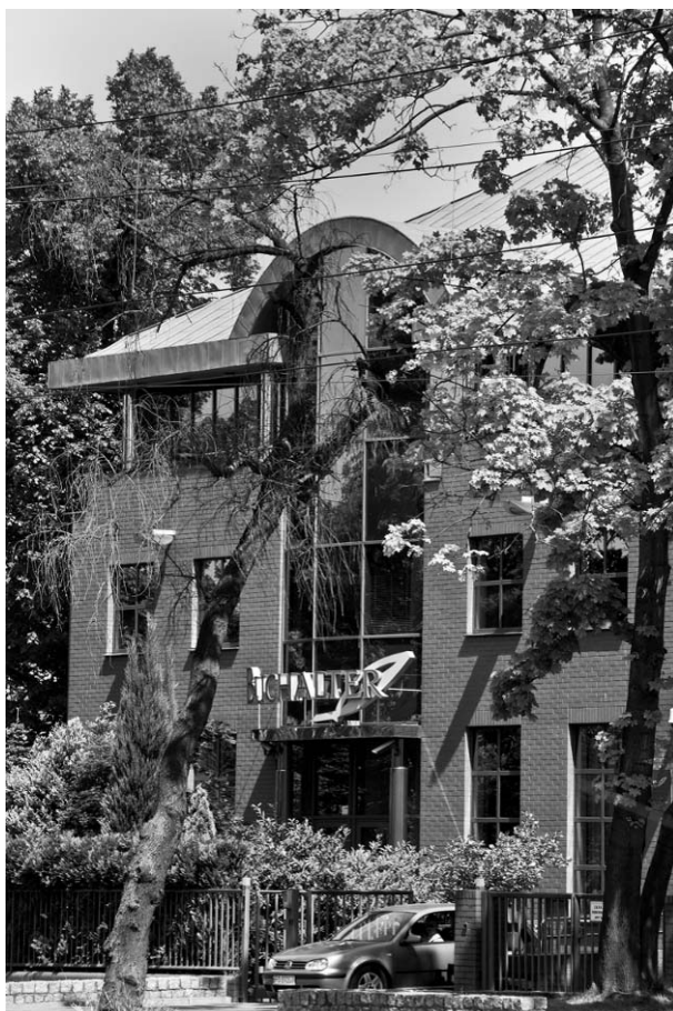
Il. 6. Wejście do budynku firmy „Buchalter”.

Pic. 5. The office building of „Buchalter” on the left side and one of the pre-war villas at Wojska Polskiego alley.