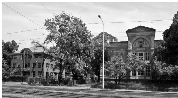
Il. 5. Po lewej stronie budynek firmy „Buchalter”, po prawej jedna z przedwojennych willi zlokalizowanych wzdłuż al. Wojska Polskiego.

Pic. 5. The office building of „Buchalter” on the left side and one of the pre-war villas at Wojska Polskiego alley.