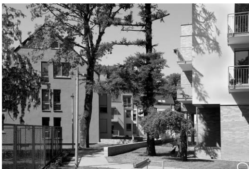
Il. 3. Widok na zagospodarowanie przestrzeni wewnątrz zespołu zabudowy mieszkaniowo-usługowej zlokalizowanej przy skrzyżowaniu ul. Mickiewicza i ul. Lelewela.

Pic. 2. View to Mickiewicza street with the recent development located at the corner of Lelewela street.