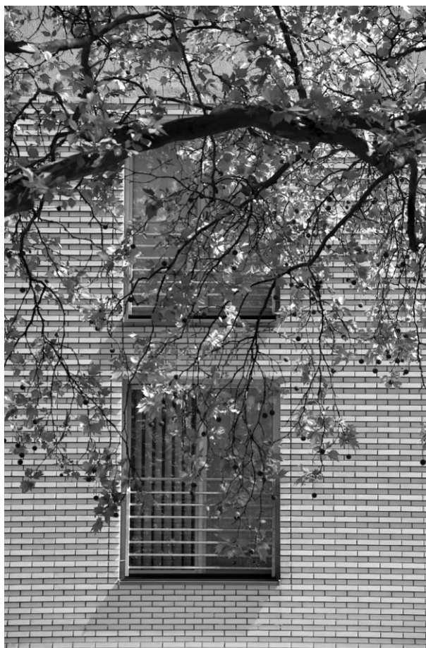
Il. 10. Fragment elewacji współczesnego budynku mieszkalnego zlokalizowanego przy Jasnych Błoniach. Pic. 10. Part of facade of the modern apartment building at Jasne Błonia.