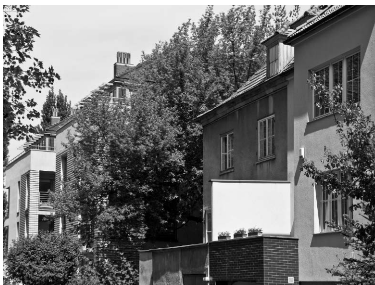
Il. 8. Widok na nową zabudowę zlokalizowaną przy Jasnych Błoniach od strony ul. Stanisława Moniuszki, z widocznym na pierwszym planie fragmentem zabudowy przedwojennej.

Pic. 7. Virtual view to Szczecin's area of Jasne Błonie with marked two modern apartment buildings.