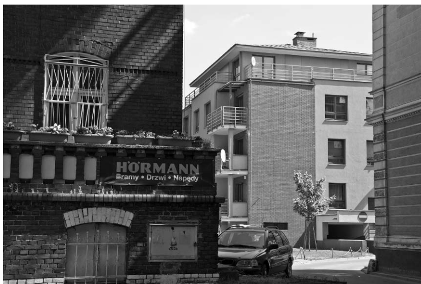
Il. 4. Widok z al. Wojska Polskiego na fragment zespołu mieszkalnego wzniesionego wewnątrz kwartału zabudowy miejskiej ograniczonego ulicami Stanisława i Wandy Miłaszewskich, Stanisława Wyspiańskiego, Księdza Piotra Skargi oraz al. Wojska Polskiego. Źródło: fot. autora, 2009

Równie ciekawie wpisuje się w istniejący kontekst przestrzenny i architektoniczny czworoboczny obiekt wzniesiony w ostatnich latach na zapleczu okazałych willi miejskich zlokalizowanych wzdłuż al. Wojska Polskiego (il. 4).