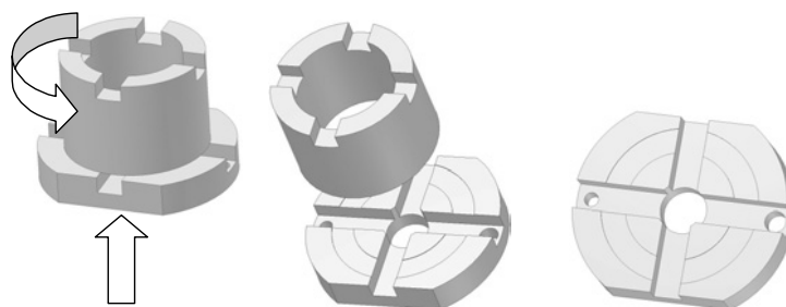
Rys. 2. Postać geometryczna próbek stosowanych w tribometrze PT-3. Od lewej do prawej: próbki w pozycji roboczej (strzałkami zaznaczono kierunek obrotów i siły dociskającej próbki), para próbek po rozsunięciu czół, próbka dolna (nieruchoma) z widocznym położeniem ścieżki tarcia

Ogólny schemat kinematyczny głowicy Tribometru PT przedstawiono na Rys. 1 . W urządzeniu tym napęd próbki ruchomej pochodzi od silnika prądu przemiennego, którego prędkość jest płynnie regulowana i kontrolowana z wykorzystaniem komputera. Moment obrotowy z silnika jest przenoszony przez przekładnię pasową na ułożyskowane w podporach hydrostatycznych (2, 3) wrzeciono 4, do którego swobodnego końca przymocowana jest próbka 5. Próbka dolna 6 jest dociskana do próbki górnej od dołu przez nurnikowy siłownik hydrauliczny, którego górna panewka kulista 10 jest przedstawiona schematycznie na rysunku. Nieruchoma próbka dolna 6 dla dwóch stopni swobody podparta jest sprężystości: 7 – ruch obrotowy w płaszczyźnie styku, 9 – ruch liniowy normalny do płaszczyzny styku. Układ elementów chwytowych i podpierających 9 próbkę dolną 6 jest zakończony od dołu kulistą stopą. Łącznie z panewką 10 na górnym końcu tłoka nurnika tworzy ona łożysko hydrostatyczne zasilane przez kanały w tłoku. Kulisty kształt łożyska podpierającego układ próbki dolnej zapewnia samonastawność i niwelację wpływu bicia czoła próbki górnej. Bezwładnik 8 umożliwia zmianę właściwości dynamicznych układu próbki dolnej w celu dostrojenia układu badawczego do warunków próby i minimalizacji ewentualnych drgań.