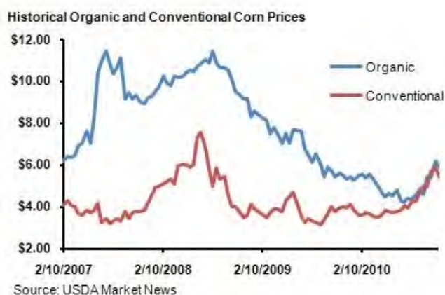
Rys. 2. Historyczne ujęcie różnic cenowych zbóż ekologicznych i konwencjonalnych w Stanach Zjednoczonych w latach 2007-2010.

Prezentowane zróżnicowanie cenowe były skorelowane z wielkością produkcji i dostępnością produktów ekologicznych w kraju. W krajach o rozwiniętym rynku żywności ekologicznej charakteryzującym się wysokim poziomem popytu i podaży (Austria, Dania, Niemcy), a także występowaniem nadwyżek prowadzących w długim okresie do spadku cen, ich poziom ogólnie jest bardziej zbliżony do poziomu cen produktów konwencjonalnych niż w krajach o słabo rozwiniętym rynku (Grecja, Portugalia, Hiszpania). Potwierdza to zestawienie minimalnych i maksymalnych premii na poziomie producenta. Minimalne premie występują w krajach, w których rynek jest najbardziej rozwinięty i istnieje wysoka podaż, natomiast najwyższe w krajach będących w początkowej fazie rozwoju [7].