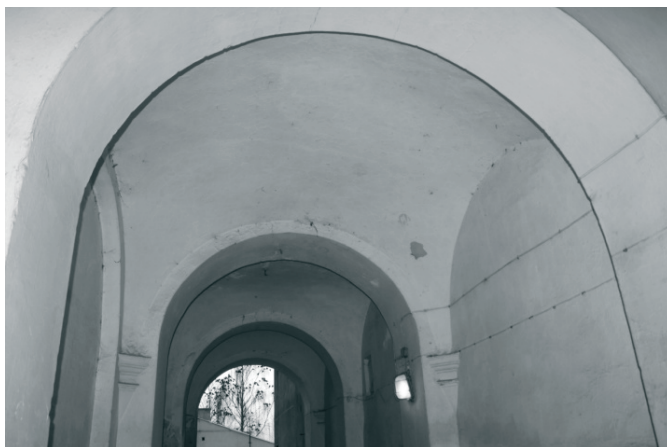
Fot. 2. Sklepienia przejazdu