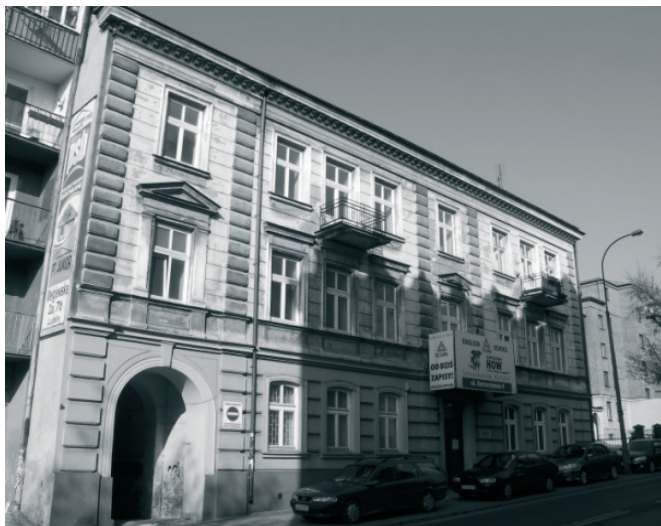
Fot. 1. Elewacja frontowa.