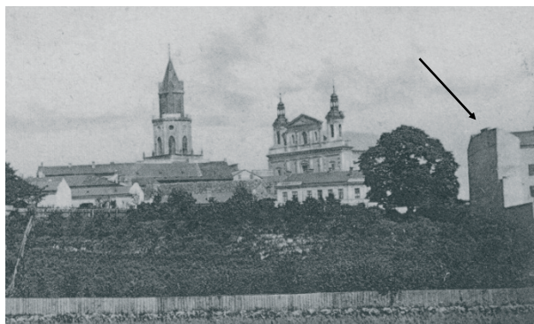
Rys. 1. Fragment pocztówki sprzed roku 1905, strzałką oznaczono oficynę i kamienicę. Fig. 1. Piece of postcard from before year 1905, the arrow was marked the annexe and tenement.