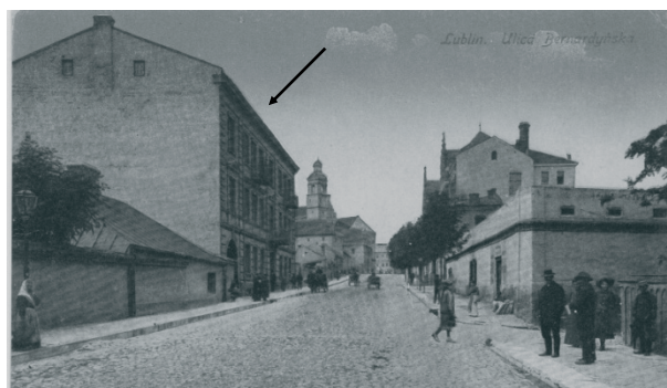
Rys. 2. Pocztówka z 1916 r. strzałką oznaczono omawianą kamienicę. Fig. 2. Postcard from 1916 r. arrow was marked tenement.