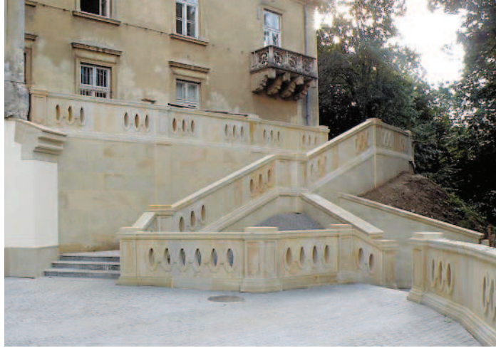
Ryc. 3. Zamek w Dzikowie. Schody zewnętrzne, przed i po remoncie Fig. 3. Dzikow castle. Outside staircase, before and after the renovation