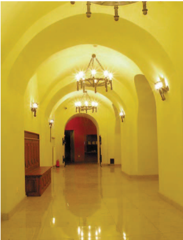
Ryc. 4. Zamek w Dzikowie. Piwnica 3 po remoncie Fig. 4. Dzikow castle. Cellar 3 after the renovation