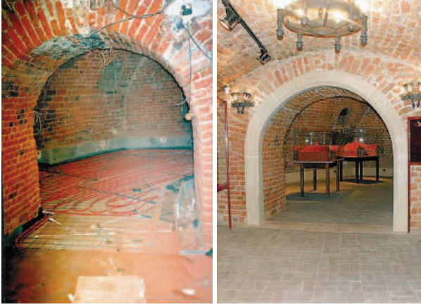
Ryc. 1. Zamek w Dzikowie. Piwnica 1, przed i po remoncie Fig. 1. Dzikow castle. Cellar 1, before and after the renovation