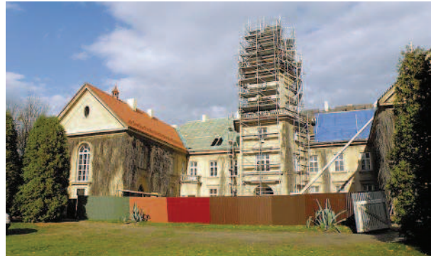
Ryc. 5. Zamek w Dzikowie. Remont konserwatorski dachu Fig. 5. Dzikow castle. Conservation and renovation of the roof

dostawiono półkolistą w planie basteję obudowaną cegłą o układzie uskokowo-schodkowym. Kiedy sto lat później rozbudowywano rezydencję o skrzydło północne, nie rozebrano całkowicie bastei, lecz na dolnych partiach jej muru oparto sklepienia dwóch budowanych wtedy komór piwnicznych. To posunięcie sprawiło nie tylko, że do naszych czasów przetrwał zachowany wtedy fragment bastei, ale też i to, że o ile średniowieczne komory piwniczne to ciąg pomieszczeń ułożony w linii prostej, to rzut piwnic z XVII wieku przyjmuje kształt linii krzywej. Dzięki temu ta część wnętrza piwnicznych tworzy rodzaj nastrojowego zaułku.