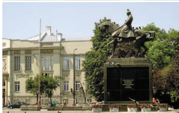
Ryc. 2 i 3. Plac Litewski w Lublinie, widok od strony pld.-wsch. Na pierwszym planie Pomnik Marszałka Piłsudskiego, w tle Pomnik Nieznanego Żołnierza i Pomnik Konstytucji 3 Maja. Fot. z archiwum WKZ Lublin, 2006