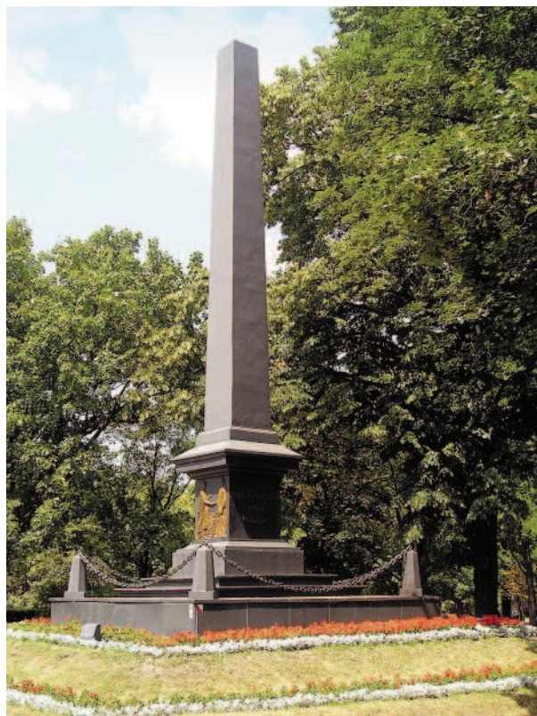
Ryc. 5. Plac Litewski w Lublinie. Pomnik Unii Lubelskiej. Fig. 5. The Lithuanian Square in Lublin. Monument of the Lublin Union.

Nie ustały także problemy związane z brakiem koncepcji użytkowania Placu Litewskiego. Pomimo usytuowania na nim najważniejszych czterech pomników o najwyższym wymiarze symboli patriotycznych i narodowych obszar placu nie jest traktowany jak „panteon” – nawet w bezpośredniej strefie „pomnikowej”. Organizowane są imprezy rozrywkowe: spotkania sylwestrowe, imprezy dla dzieci, pokazy, wystawy o dyskusyjnej treści. Do historii przeszły pokazy rekinów z Florydy zaaranżowane w ustawionych na placu TIR-ach-basenach latem 2004 roku, za aprobatą władz miasta proponowano – wzorem paryskich bulwarów nad Sekwaną – urządzenie plaży, zaś w grudniu 2005 roku, pomiędzy Pomnikiem Marszałka Piłsudskiego i pomnikiem Unii Lubelskiej z pieniędzy samorządu miasta zamontowano sztuczną płytę lodowiska wraz z urządzeniami chłodniczymi, zapleczem, ogrodzeniem. Na środku placu, niemal u stóp pomnika Marszałka ustawiono na okres kilku miesięcy przenośne toalety – TOI-TOI, które przyciągały zdziwiony wzrok turystów