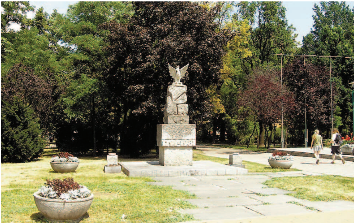
Ryc. 4. Plac Litewski w Lublinie. Pomnik Konstytucji 3 Maja.