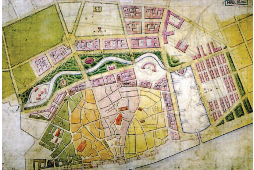
Ryc. 2. Plan Rygi. J.D. Felsko, O. Dietze, 1856 Fig. 2. Plan of Riga by J.D. Felsko, O. Dietze, 1856