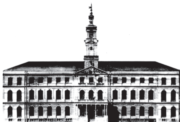
Ryc. 6. Ratusz, projekt. Ryga. J.D. Felsko, 1848