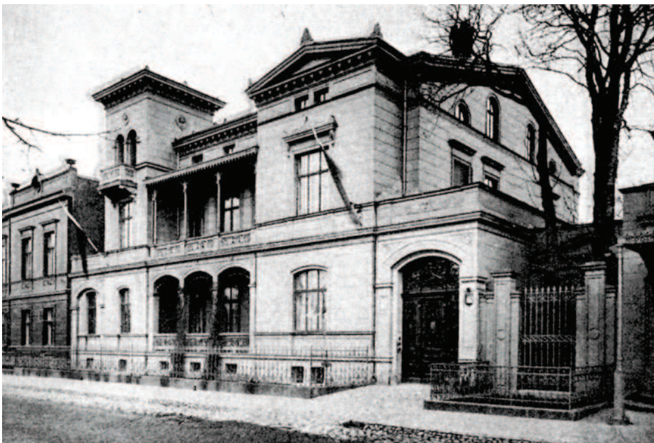
Ryc. 5. Willa przy ul. Elżbiety 49. Ryga. J.D. Felsko, ok. 1850 Fig. 5. A villa at 49 Elizabeth Street. Riga. J.D. Felsko, app. 1850