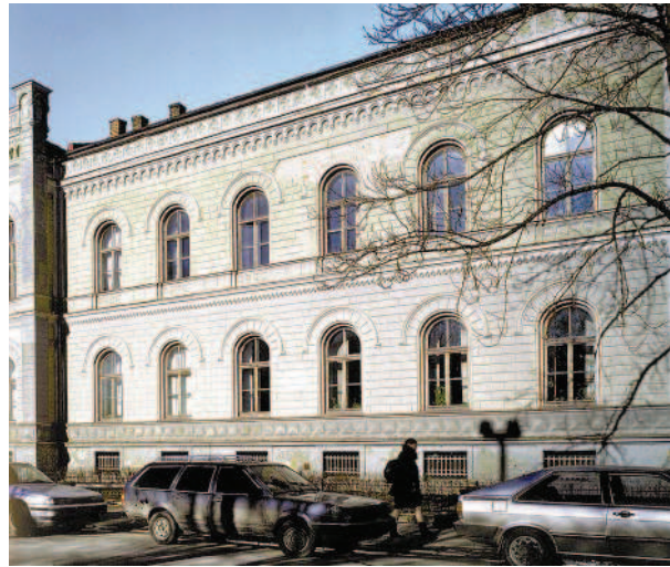
Ryc. 9. Gimnazjum realne. Ryga. J.D. Felsko, 1874 Fig. 9. Real Gymnasium. Riga. J.D. Felsko, 1874