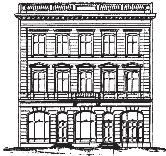
Ryc. 4. Kamienica A.J.F. Jakoba, projekt. Ryga. J.D. Felsko, 1879 Fig. 4. Tenement house of A.J.F. Jakob, project. Riga. J.D. Felsko, 1879