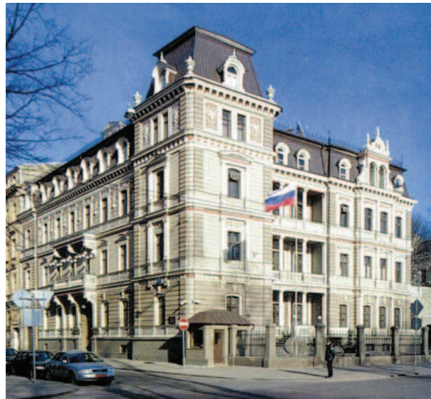
Ryc. 11. Kamienica przy ul. Antonijas 2. Ryga. J.D. Felsko, 1879 Fig. 11. Tenement house at 2 Antonijas Street. Riga. J.D. Felsko, 1879