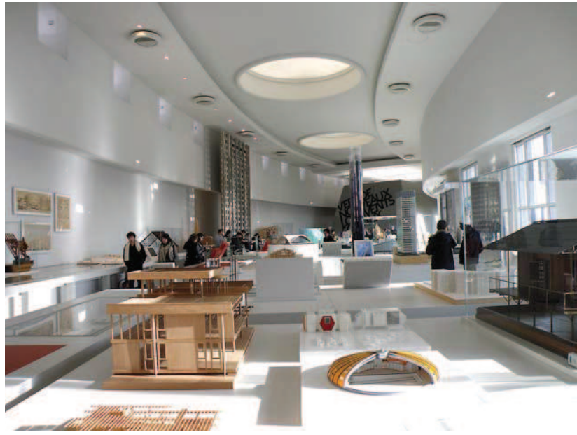
Ryc. 14. Pierwsze piętro galerii Jacquesa Carlu, utworzone podczas modernizacji J. Bodina, mieszczące galerię współczesnej architektury francuskiej. grudzień 2011 Fig. 14. The first floor of the gallery of Jacques Carlu, made during the modernisation by J. Bodin, housing the gallery of modern French architecture. December 2011