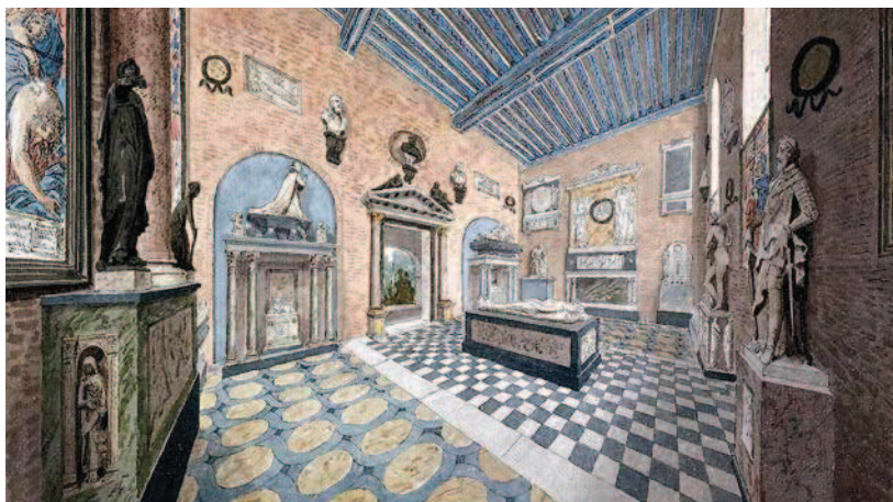
Ryc. 3. Sala XVI wieku w Muzeum Zabytków Francuskich Aleksandra Lenoira. W centrum widoczne przeniesione tu królewskie nagrobki Ludwika XII i Anny Bretońskiej. Ilustracja przechowywana w Musee de la Ville de Paris, Musee Carnavalet, Paryż, http://www.histoire-image.org/photo/zoom/den2_lenoir_001f.jpg , dostęp 17.02.2012