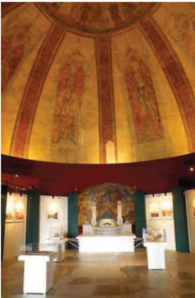
Ryc. 15. Galeria Malarstwa Centrum. Widok kopii fresków krypty kościoła Saint-Nicolas de Tavant. grudzień 2011 Fig. 15. Gallery of Painting in the Centre. View of copies of frescoes from the crypt in the church of Saint-Nicolas de Tavant. December 2011