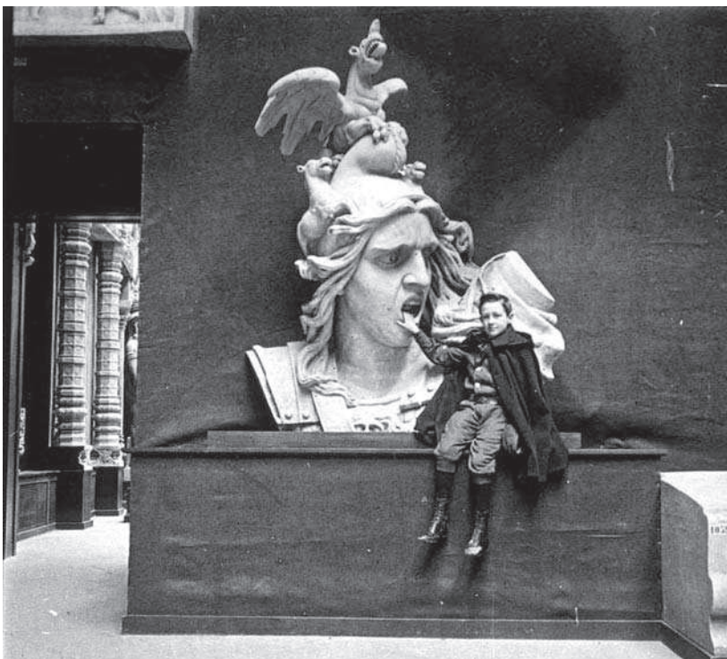
Ryc. 7. Fotografia z wnętrza Muzeum Rzeźby Komperatywnej w Pałacu Trocadero. Głowa Marsylianki z Łuku Triumfalnego w Paryżu.