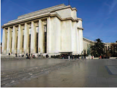
Ryc. 12. „Paris Wing” – skrzydło, w którym mieści się Centrum. Fot. autora, grudzień 2011 Fig. 12. “Paris Wing” – the wing housing the Centre. Photo by author, December 2011