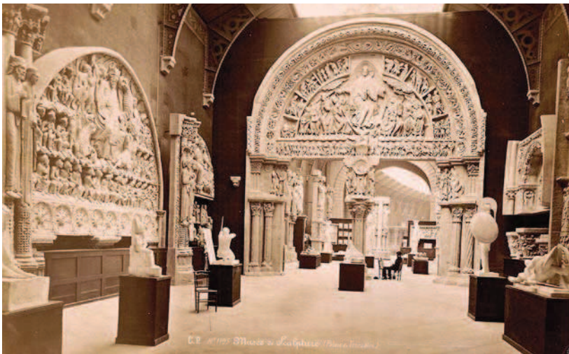
Ryc. 6. Sala Muzeum Rzeźby Komperatywnej w Pałacu Trocadero. W centrum widoczny gipsowy odlew portalu XII-wiecznego kościoła św. Magdaleny w Vezelay.