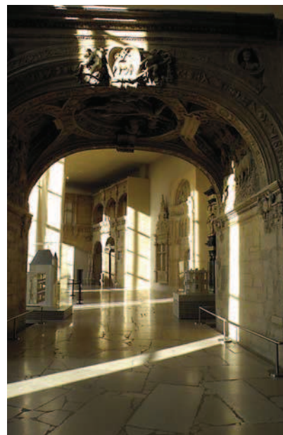
Ryc. 10. Galeria dodana przez Jacquesa Carlu w 1937 r. po konserwacji. Fot. autora, grudzień 2011