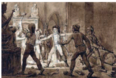
Ryc. 1. Aleksander Lenoir broniący zabytków przed opactwem Saint Denis, rycina z XVIII w. przechowywana w zbiorach Muzeum w Luwrze, http://www.maison-histoire.fr/evenement/alexandre-lenoir/ , dostęp 17.02.2012

Fig. 1. Alexandre Lenoir defending historic monuments in front of the Abbey of Saint Denis, a print from the 18 th c. kept in the Louvre Museum collection, http://www.maison-histoire.fr/evenement/alexandre-lenoir/ , access 17.02.2012