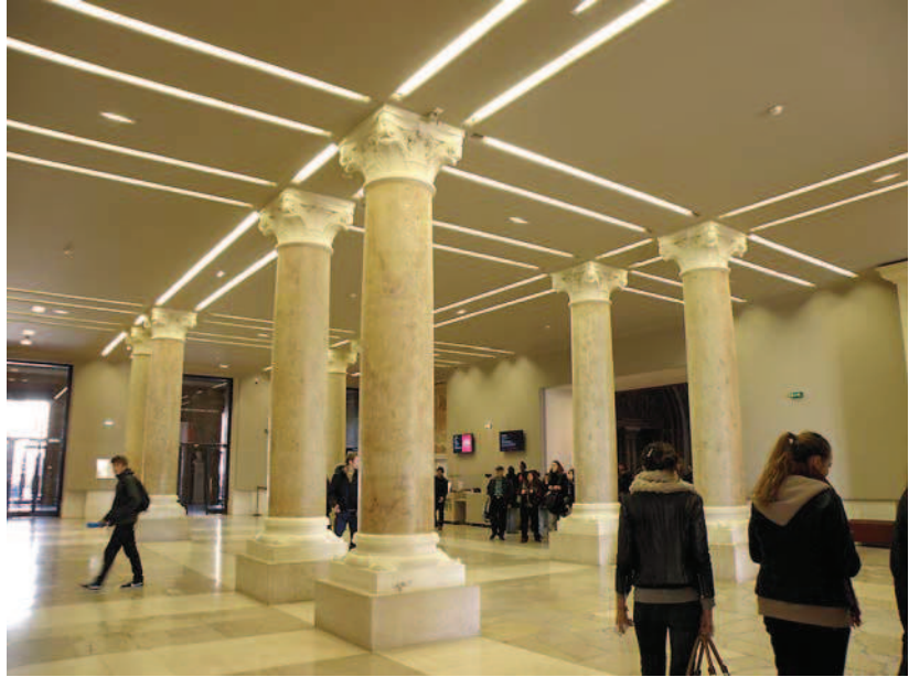
Ryc. 13. Foyer wejściowe Centrum, przestrzeń recepcyjna. Fot. autora, grudzień 2011 Fig. 13. Entrance foyer to the Centre, reception space. Photo by author, December 2011