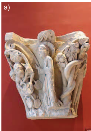
a) a cast of a detail presented in the exhibition. Photo by author, December 2011. b) one of the casts of gargoyles presented in the Davioud Gallery wing. Photo by author, December 2011. c) one of the casts of ornamental sculpture, presented in the Davioud Gallery wing. Photo by author, December 2011