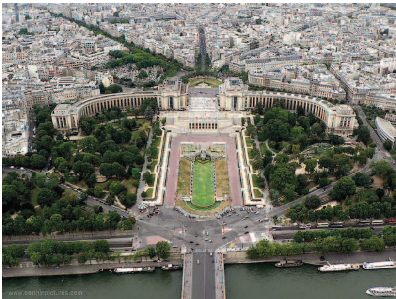
Ryc. 9. Widok na ogrody Trocadero i pałac Chaillot w Paryżu, w którym w prawym skrzydle mieści się Cité de l'architecture et du patrimoine