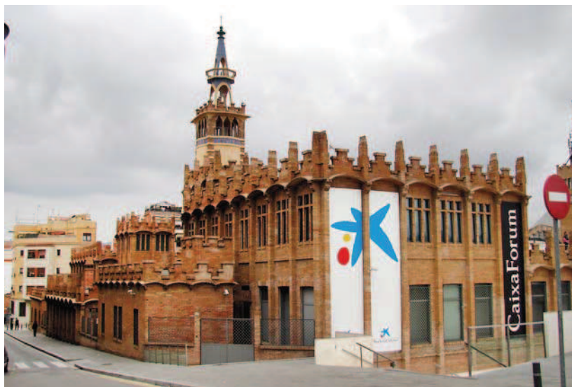
Ryc. 7. Caixa Forum – widok od południowego zachodu Fig. 7. Caixa Forum – view from the south-west