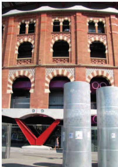
Ryc. 4, 5. Integracja detali współczesnych i historycznych w obiekcie Las Arenas, fot. autor Fig. 4, 5. Integration of modern and historical details in the Las Arenas building – photo by author