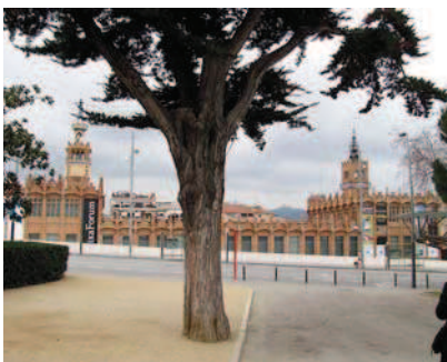
Ryc. 6. Widok ogólny Caixa Forum (dawnej fabryki Casaramona) z przeciwnej strony ulicy, spod pawilonu niemieckiego Miesa van der Rohe, fot. autor Fig. 6. General view of Caixa Forum (the former Casaramon factory) from the opposite side of the street, from the German pavilion by Mies van der Rohe – photo by author