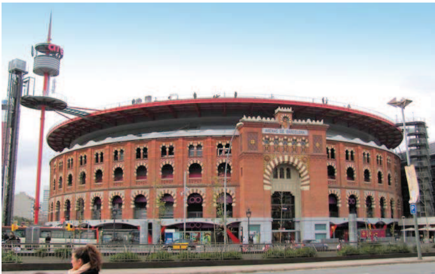
Ryc. 1. Widok ogólny Las Arenas od strony Plaża d'Espanya Fig. 1. General view of Las Arenas from the side of Plaça d'Espanya