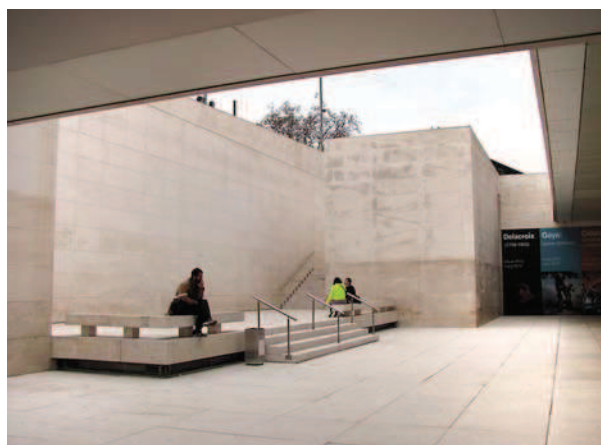
► Ryc. 8. Caixa Forum – ogólnodostępny taras na dachu Fig. 8. Caixa Forum – public terrace on the roof

The area of the former World Exhibition located at the foot of Montjuïc hill, which was also used during the