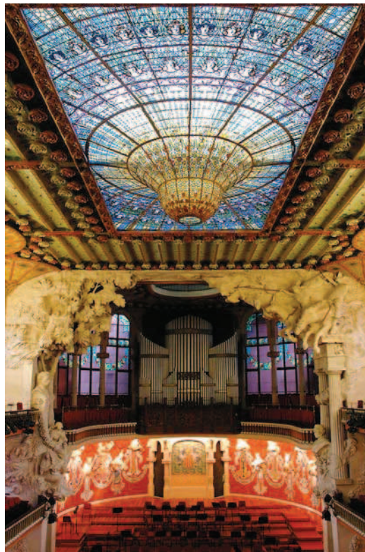
► Ryc. 16. Palau de la Música Catalana – wnętrze głównej sali koncertowej, źródło: www.palaumusica.org Fig. 16. Palau de la Música Catalana – interior of the main concert hall – source – www.palaumusica.org