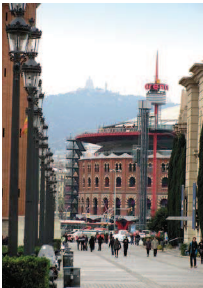
Ryc. 3. Widok na Las Arenas z głównej osi dawnych terenów wystawowych – Av. Reina Maria Cristina Fig. 3. View of Las Arenas from the main axis of the former exhibition grounds – Av. Reina Maria Cristina