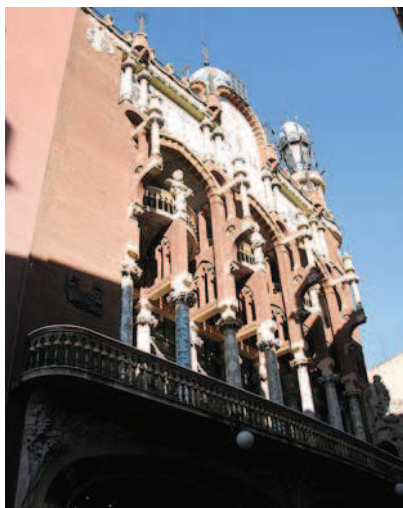
Ryc. 12. Palau de la Música Catalana – widok elewacji frontowej Fig. 12. Palau de la Música Catalana – view of the front elevation