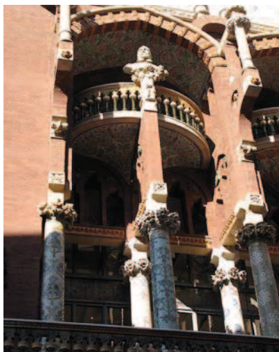
Ryc. 13. Palau de la Música Catalana – detal elewacji frontowej Fig. 13. Palau de la Música Catalana – detail of the front elevation