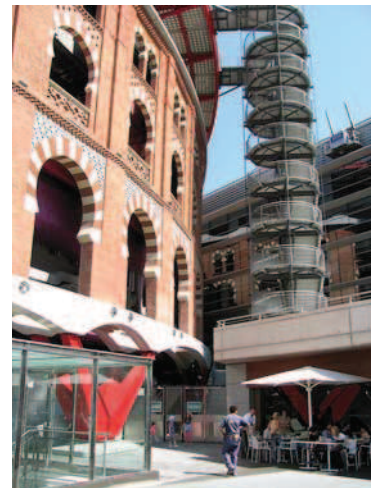
Ryc. 2. Las Arenas – w głębi widoczna dobudowana część biurowa Fig. 2. Las Arenas – added office section visible at the back