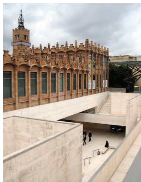
Ryc. 10. Caixa Forum – widok na zagłębiony dziedziniec wejściowy od południowego zachodu Fig. 10. Caixa Forum – view of the sunken entrance courtyard from the south-west