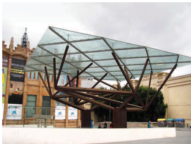
Ryc. 11. Caixa Forum – przekrycie schodów ruchomych w zewnętrznej strefie wejściowej, fot. autor Fig. 11. Caixa Forum – roof covering of the escalators in the outer entrance zone – photo by author