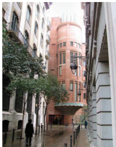
Ryc. 14. Palau de la Música Catalana – II etap rozbudowy widoczny od strony Via Laietana, fot. autor Fig. 14. Palau de la Música Catalana – 2 nd stage of expansion visible from the side of Via Laietana – photo by author