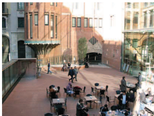
◀ Ryc. 18. Palau de la Música Catalana – detal elewacji nowej części budynku Fig. 18. Palau de la Música Catalana – detail of elevation of the new section of the building