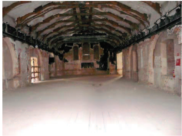
Ryc. 2. Lublin, klasztor powizytkowski, kościół. Wnęki drugiej kondygnacji nawy oraz ściana N dawnego chóru muzycznego. Fot. C. Hadamik, lipiec 2010 r. Fig. 2. Lublin, post-Visitationist monastery, church. Niches of the second storey of the nave and the N wall of the former music choir. Photo by C. Hadamik, July 2010