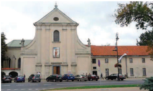
Ryc. 3. Lublin, kościół Kapucynów. Fasada główna, widok na S. Fot. C. Hadamik, sierpień 2010 r. Fig. 3. Lublin, Capuchin church. Main facade, view to S. Photo by C. Hadamik, August 2010