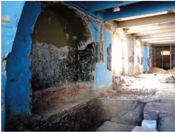
Ryc. 1. Lublin, klasztor powizytkowski. Nawa kościoła w trakcie prac wykopaliskowych i budowlanych. Płytkie wnęki-kaplice boczne wschodniej ściany nawy, widok na SE. Fot. C. Hadamik, lipiec 2010 r. Fig. 1. Lublin, post-Visitationist monastery. Nave of the church during excavation and building work. Shallow niches-side chapels on the east wall of the nave, view to SE. Photo by C. Hadamik, July 2010