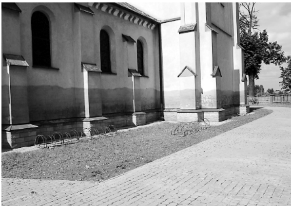
Ryc. 2. Trześń. Kościół parafialny, elewacja południowa Fig. 2. Trześń. Parish church, south elevation