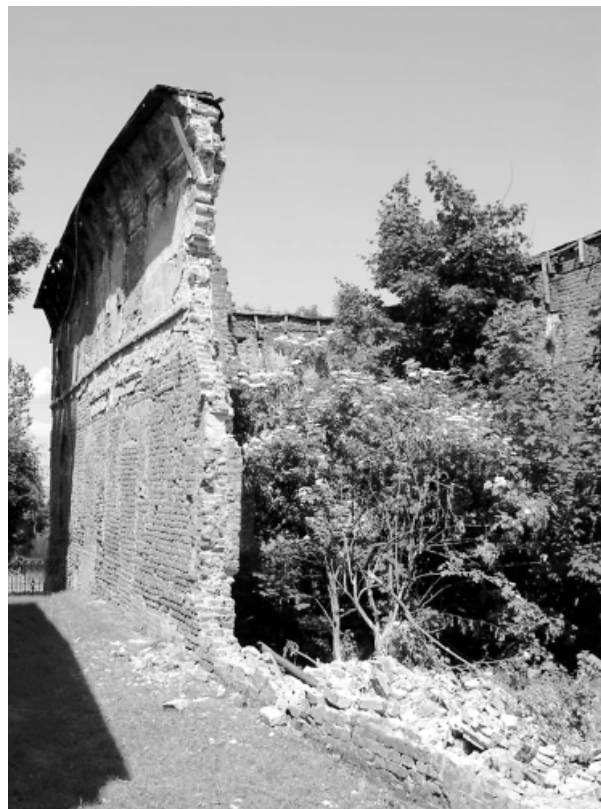
Ryc. 8. Góra Ropczycka Fig. 8. Góra Ropczycka