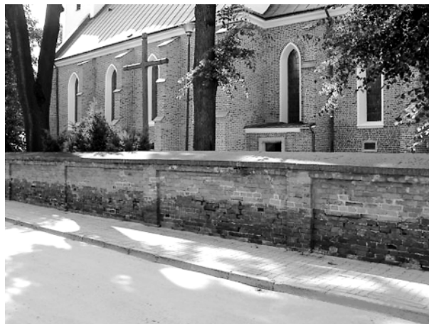
Ryc. 7. Ropczyce. Kościół pw. NMP Fig. 7. Ropczyce. Church of the Virgin Mary