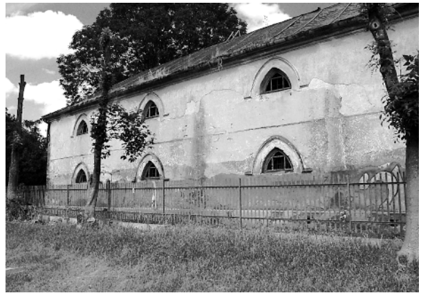
Ryc. 4. Trześń. Spichlerz, elewacja zachodnia Fig. 4. Trześń. Granary, west elevation