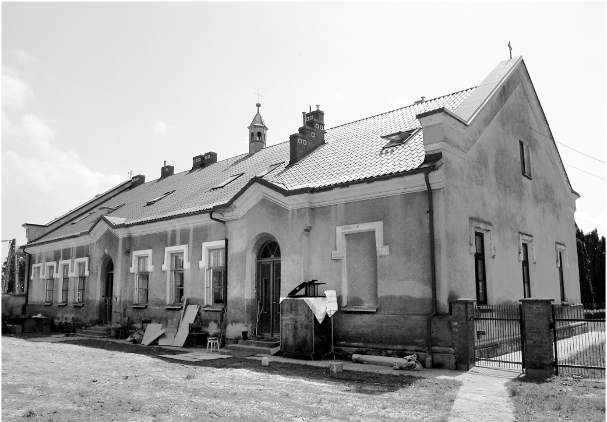
Ryc. 1. Tarnobrzeg Wielowieś. Budynek dawnej szkoły Fig. 1. Tarnobrzeg Wielowieś. Building of the former school