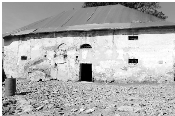
Ryc. 6. Zgłobień. Spichlerz Fig. 6. Zgłobień. Granary

Jak pokazują sezony wiosenno-letnie, w ostatnich kilku latach ziemia ropczycka jest systematycznie nawiedzana przez powodzie. Urząd Miasta w Ropczycach alarmował o zagrożeniu powodziowym zabytkowych obiektów z terenu miasta; podtopieniem zagrożony był