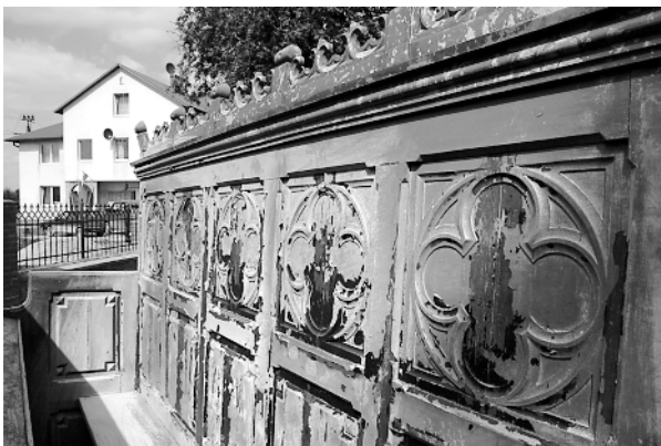
Ryc. 3. Trześń. Wyposażenie kościoła, ławki neogotyckie Fig. 3. Trześń. Church fittings, neo-Gothic pews