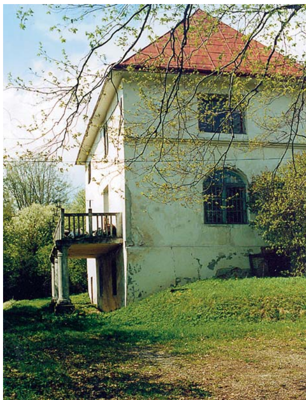
Ryc. 5. Podchybie. Dwór. Starsza część dworu. Widok od strony południowo-wschodniej. Fig. 5. Podchybie. Manor house. The older part of the manor. View from the south-east.