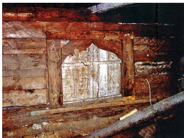
Ryc. 11. Podchybie. Dwór. Okienko w narożniku północno-wschodnim nad skośną przybudówką zakończone lukiem w ośli grzbiet. Fot. M. Bicz-Suknarowska 2004

Fig. 10. Podchybie. Manor house. Opening of the well dug in the cellar 005. Photo: M. Bicz-Suknarowska 2004