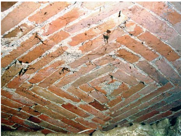
Ryc. 9. Podchybie. Dwór. Wysklepek nad помещением 004 w przyziemiu. Fot. M. Bicz-Suknarowska 2004

Fig. 8. Podchybie. Manor house. Terrace supported on concrete columns at the south elevation, a kitchen window below the terrace. Photo: M. Bicz-Suknarowska 2004