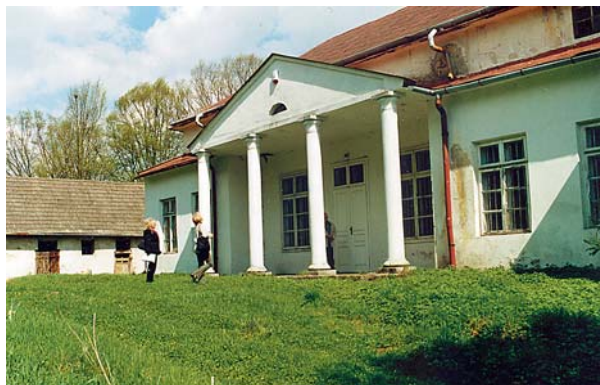
Ryc. 7. Podchybie. Dwór. Ganek elewacji zachodniej. Na dalszym planie budynek gospodarczy. 2004 Fig. 7. Podchybie. Manor house. Porch of the west elevation. A utility building in the background. 2004