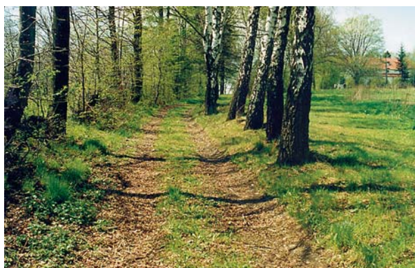
Ryc. 2. Podchybie. Dwór. Aleja wjazdowa. Fig. 2. Podchybie. Manor house. The driveway.