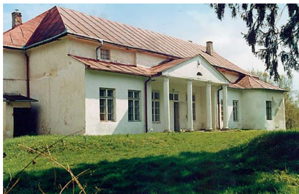
Ryc. 6. Podchybie. Dwór. Widok od strony północno-zachodniej. Fig. 6. Podchybie. Manor house. View from the north-west.