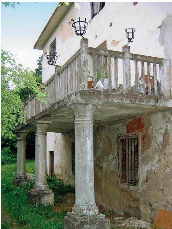
Ryc. 8. Podchybie. Dwór. Taras na betonowych kolumnach przy elewacji południowej, pod tarasem okno kuchenne. Fot. M. Bicz-Suknarowska 2004

Fig. 8. Podchybie. Manor house. Terrace supported on concrete columns at the south elevation, a kitchen window below the terrace. Photo: M. Bicz-Suknarowska 2004