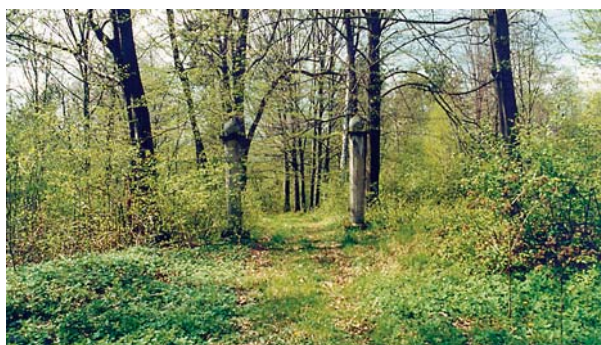
Ryc. 3. Podchybie. Dwór. Brama wejściowa do parku. Fig. 3. Podchybie. Manor house. Entrance gate to the park.