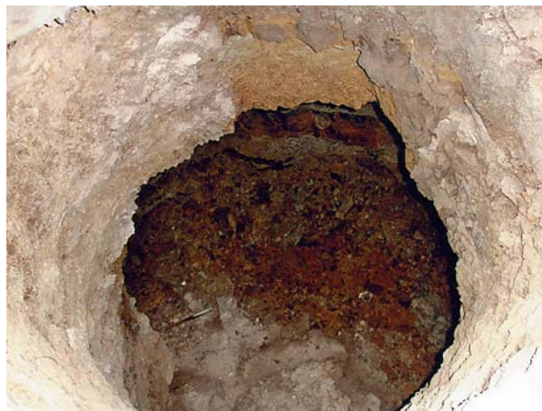
Ryc. 10. Podchybie. Dwór. Otwór studni wykopanej w piwnicy 005.

W odniesieniu do ścian nośnych opinia z marca 2005 roku stwierdza znaczne obniżenie wytrzymałości ścian kamiennych w starszej, południowo-zachodniej części budynku. Spowodowane to jest osuwiskiem gruntu na stoku południowym. Po-