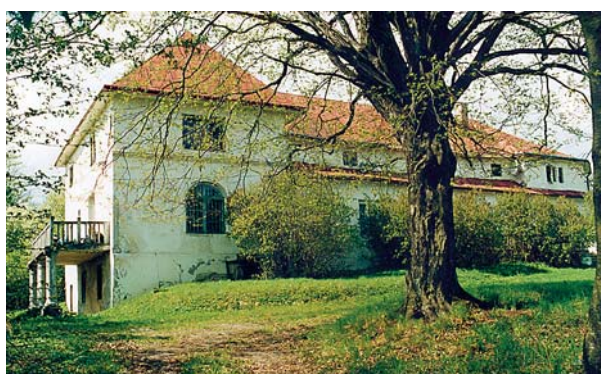
Ryc. 4. Podchybie. Dwór. Widok od strony południowo-wschodniej. Fig. 4. Podchybie. Manor house. View from the south-east.