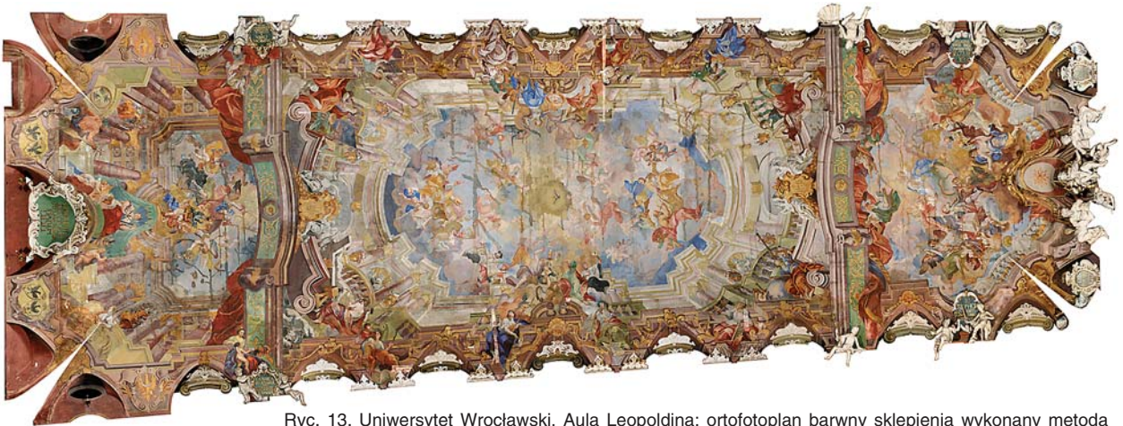
Ryc. 13. Uniwersytet Wrocławski, Aula Leopoldina; ortofotoplan barwny sklepienia wykonany metodą fotogrametryczną i metodą skaningu laserowego, rozdzielczość terenowa (wymiar piksela) 2,00 mm Fig. 13. University of Wrocław, Aula Leopoldina; colour orthophotomap of the vault made using photogrammetric method and laser scanning method, area resolution (pixel size) 2.00 mm