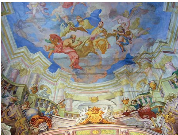
Ryc. 2. Uniwersytet Wrocławski, Aula Leopoldina; dekoracja freskowa Jana Krzysztofa Handkego z 1732 roku – fragment sklepienia nad audytorium. Fot. Ewa Skrzydlak, 2008