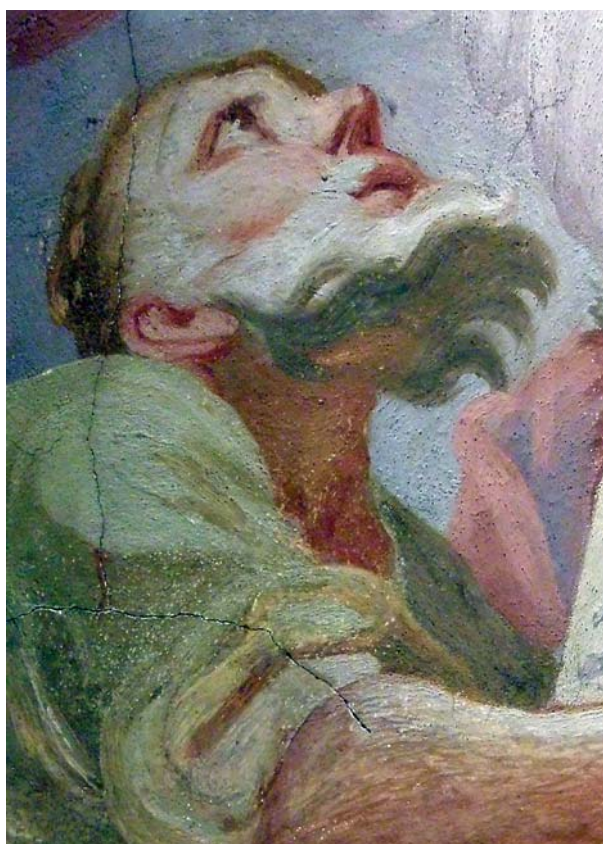
Ryc. 7/8. Uniwersytet Wrocławski, Aula Leopoldina; fragment fresku Jana Krzysztofa Handkego – fotografia w świetle rozproszonym i świetle bocznym. Fot. Ewa Tymcik, 2008 Fig. 7/8. University of Wrocław, Aula Leopoldina; fragment of a fresco by Jan Krzysztof Handke – photo in diffused and side light. Photo by Ewa Tymcik, 2008