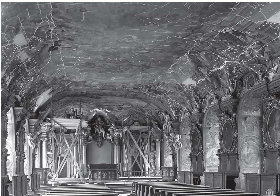
Ryc. 12. Uniwersytet Wrocławski, Aula Leopoldina; dekoracja malarska Jana Krzysztofa Handkego; sklepienie nad podium – rejestracja cyfrowa luminescencji wywołanej promieniowaniem UV. Widoczne świecące retusze A. Michalaka oraz retusze PKZ w formie pionowych i poziomych pasów. Fot. Zofia Kaszowska, Anna Mikołajska, 2008

Fig. 10. University of Wrocław, Aula Leopoldina; general view – a copy of the photo IS PAN 0000039143, photo by M. Moraczewska, 1949 – visible places where anchor plates were fixed and the losses in original lime mortar were filled in with new plaster