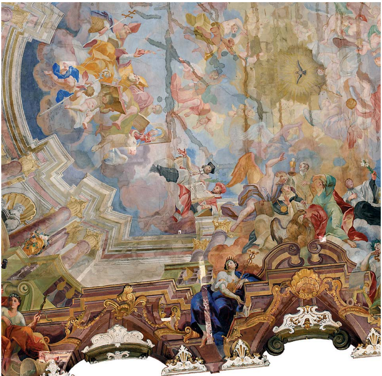
Ryc. 14. Uniwersytet Wrocławski, Aula Leopoldina; ortofotoplan barwny sklepienia – fragment: widoczne pociemnienie retusze w miejscach uzupełnień zaprawy, biegnące w formie pionowych pasów oraz sondy pasowe wykonane w trakcie prac badawczych Fig. 14. University of Wrocław, Aula Leopoldina; colour orthophotomap of the vault – fragment: visible darkened retouches in places where mortar was filled in, running as vertical stripes, and stripe probes made during research work