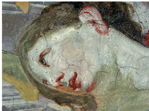
Ryc. 6. Uniwersytet Wrocławski, Aula Leopoldina; fragment dekoracji freskowej Jana Krzysztofa Handke – twarz Personifikacji Malarstwa. Fig. 6. University of Wrocław, Aula Leopoldina; fragment of fresco decoration by Jan Krzysztof Handke – the face of Personification of Painting.