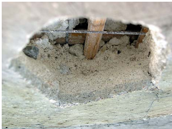
Ryc. 5. Uniwersytet Wrocławski, Aula Leopoldina; sonda w części sklepienia nad podium obrazującą układ warstw zbrojenia i tynku. Wyraźnie odróżnia się wierzchnia warstwa intonaco , z powodu wtrąceń węgla drzewnego i popiołu. Fig. 5. University of Wrocław, Aula Leopoldina; probe in the vault section over the dais, revealing the arrangement of reinforcement and plaster layers. Clearly visible surface layer of intonaco , because of charcoal and ash inclusions.

A particular role in this interior was assigned to illusionistic painting which was to compensate for