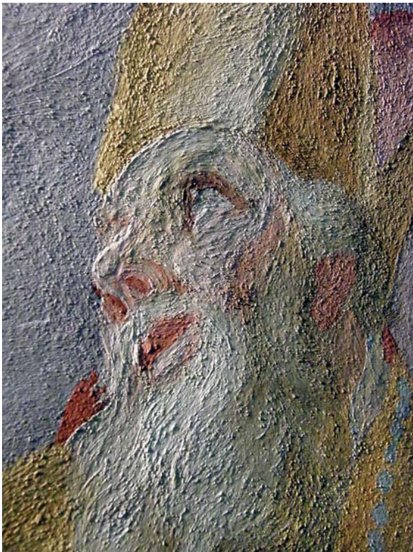
Ryc. 9. Uniwersytet Wrocławski, Aula Leopoldina; fragment fresku Jana Krzysztofa Handkego w świetle bocznym pokazujący sposób szorstkiego opracowania powierzchni intonaco.

Fig. 9. University of Wrocław, Aula Leopoldina; fragment of a fresco by Jan Krzysztof Handke in side light revealing the rough surface of intonaco coating.