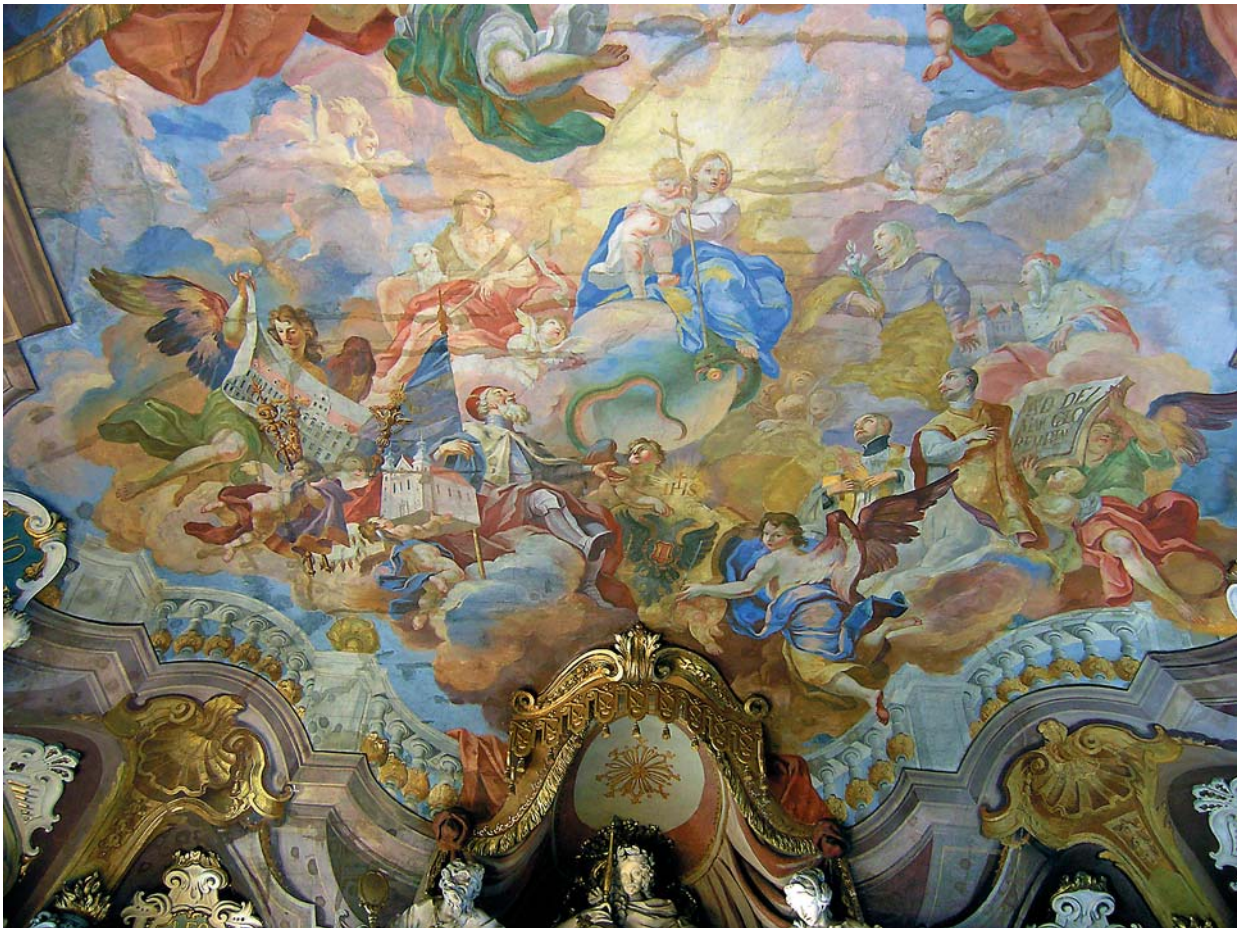
Ryc. 1. Uniwersytet Wrocławski, Aula Leopoldina; dekoracja freskowa Jana Krzysztofa Handkego z 1732 roku – sklepienie nad podium.