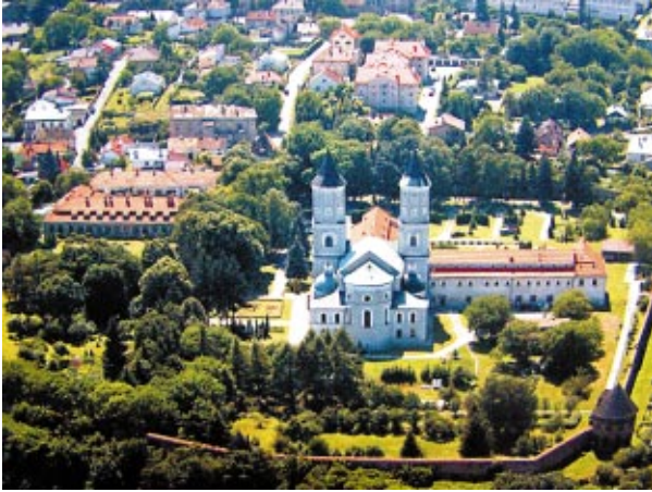
Ryc. 1. Wzgórze św. Mikołaja na tle panoramy Jarosławia wg Biuletynu Informacyjnego Miasta Jarosławia, Nr 12 (194) Rok XVI, grudzień 2008, s. 15

Fig. 1 The hill of St. Nicholas against the panorama of Jarosław acc. to Information Bulletin of the Town of Jarosław, NO 12 ( 194 ) YEAR XVI, December 2008, p. 15