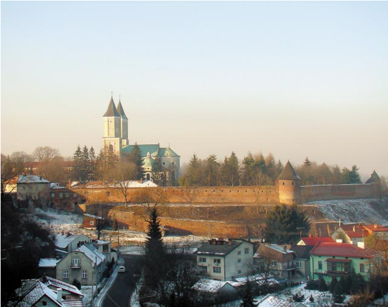
Fig. 4. View from the south onto the current buildings on the hill of St. Nicholas