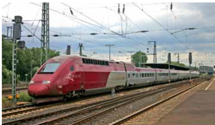
Pociąg TGV Thalys PBKA nr 4302 na stacji Köln Deutz (31.07.2005 r.)

ne: pantografy konstruowane dla pociągów dużych prędkości powinny być z jednej strony lekkie, z drugiej elastyczne, aby nie niszczyły sieci trakcyjnej przy dużych prędkościach i mieć mały przekrój. Ponadto, przepisy DB określały szerokość ślizgacza na 1950 mm, a przepisy SNCF – dla linii LGV – na 1450 mm. Po okresie prób skonstruowano pantografy uniwersalne: pierwszy, zewnętrzny, do sieci 3 kV, 1,5 kV i 15 kV i drugi, wewnętrzny, do 25 kV. Udana próba przeprowadzona we wrześniu 1993 r. na sieci DB: ślizgacze miały masę po 100 kg, nakładki ślizgowe wykonano z metalizowanego węgla i dostosowano do prądu maksymalnego 800 A. Są to pantografy półautomatyczne Faiveley Cx 25 (wewnętrzne) i Faiveley Cx 15 (zewnętrzne) wyposażone w kontrolę docisku do sieci jako funkcji: prędkości, aktualnej pozycji pociągu na szlaku, kierunku jazdy i profilu szlaku. Pantografy te zostały dopuszczone do stosowania na sieci SNCF. Postanowiono, że odbiór prądu z sieci 15 kV będzie odbywał się z tego samego pantografu (zewnętrznego), co dla sieci 3 kV (SNCB) i 1,5 kV (NS), z zastrzeżeniem, że przy jeździe pod prądem stałym podniesione są oba pantografy zewnętrzne (na dwóch wagonach silnikowych), a na liniach zelektryfikowanych prądem 15 kV – jeden, tylny i zewnętrzny pantograf. Takie rozwiązanie wynika z fak-