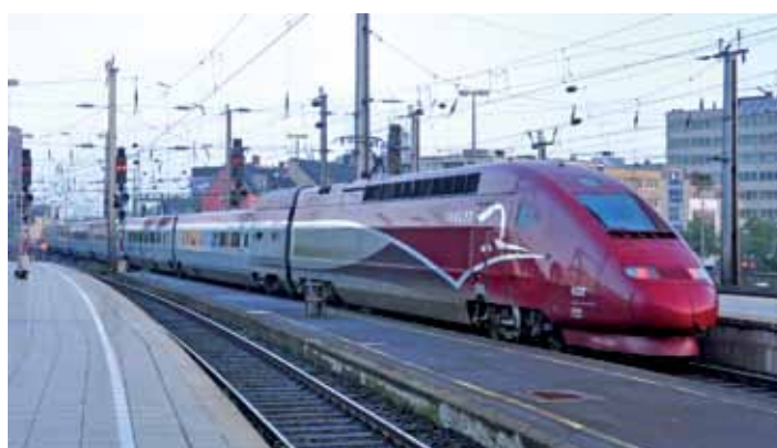
Pociąg TGV Thalys PBKA nr 4332 na stacji Köln Hbf. (29.09.2010 r.)

(mieć większy przekrój) ze względu na to, że przy napięciu stałym płynie prąd o kilkakrotnie większym natężeniu (zakładając podobną moc, jaką zamierza się uzyskać na pantografie), w porównaniu z prądem przemiennym. Zjawisko to tłumaczą dwa wzory: