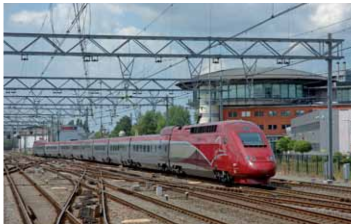
TGV Thalys PBKA 4301 opuszcza stację Amsterdam Centraal kierując się do stacji docelowej Paris Nord (13.06.2011 r.)

Największą trudnością dla inżynierów stało się opracowanie projektu pantografu (pantografów), pierwszego zdolnego współpracować z siecią 15 kV i 25 kV (jeden pantograf na każdą jednostkę napędową) oraz drugiego pantografu na prąd stały. Problem ten dotyczył tylko jednostek PBKA, ponieważ jednostki PBA otrzymały pantografy typu Faiveley GPU: zmiennoprądowy (wewnętrzny, z krótkim ślizgaczem) i stałoprądowy (zewnętrzny, z szerokim ślizgaczem), przystosowane do współpracy z siecią zelektrykowaną prądem przemiennym 25 kV 50 Hz oraz stałym 3 kV i 1,5 kV. Parametry pantografu do współpracy z siecią zelektrykowaną prądem stałym były inne: urządzenie musiało być masywniejsze