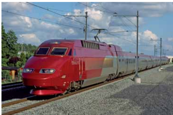
Pociąg TGV Thalys PBA nr 4538 jako pociąg nr 9345 relacji Paris Nord – Amsterdam CS na stacji Rotterdam Lombardijen (12.06.1998 r.)

W lutym 2009 r. na terenie zajezdni Forrest w Brukseli zaprezentowano pierwszy zmodernizowany (za 1,8 mln euro) pociąg TGV Thalys. Modernizacja całej floty – 26 pociągów ma zostać zrealizowana w okresie około dwóch lat, a wykonawcą byłby zakłady naprawcze SNCF Technicentre Hellemmes w pobliżu Lille. Do dotychczasowych barw – bordowej i szarej dodano linię chromową, biegnącą na zewnątrz pociągu. Modernizacji poddano także wnętrze – wagony obu klas oraz wagon barowy, używając czerni Bordeaux, jasnego różu i barw ciemnych bakłażanów.