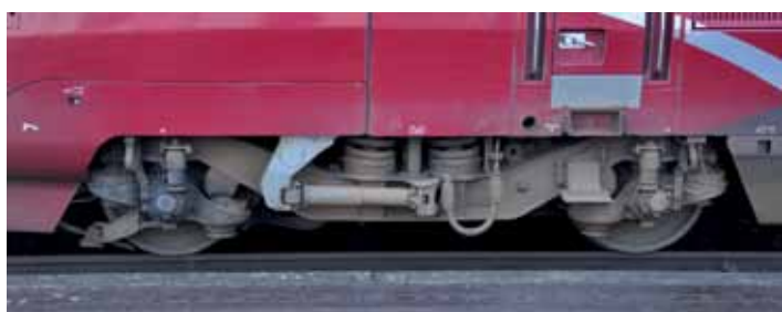
Wózek w wagonie silnikowym pociągu TGV Thalys PBKA

Ponieważ testy serii V250 znacznie się wydłużyły, pod koniec grudnia 2005 r. podpisano porozumienie o wypożyczeniu (leasing) od spółki Angel Trains 12 czterosystemowych elektrowozów TRAXX serii F140MS, mocy 5600 kW, produkcji Bombardiera, do prowadzenia pociągów IC złożonych z 7 wagonów po linii dużych prędkości z prędkością maksymalną 160 km/h. Te lokomotywy zostały wyposażone w nowy system bezpieczeństwa ruchu typu ETCS 2 i obsługują pociągi pasażerskie na trasie Bruksela – Antwerpia – Amsterdam, kursując przez linie dużych prędkości LGV 4 i HSL-Zuid. Prędkość maksymalna omawianych pociągów wynosi 160 km/h na całej linii, czas przejazdu 3 godz., a częstotliwość kursowania – 1–2 pociągi na godzinę. Ten stan trwał częściowo do września 2009 r., gdy zainaugurowano przewozy z użyciem zespołów Fyra, początkowo na odcinku Amsterdam – Rotterdam, z prędkością maksymalną 160 km/h i częstotliwością jeden pociąg na godzinę. W październiku tego samego roku zwiększono częstotliwość kursowania do dwóch pociągów na godzinę, a od kwietnia 2011 r. relacje wydłużono do Bredy. W przyszłości planuje się rozszerzyć przewozy o kursy Amsterdam – Schiphol – Rotterdam – Antwerpia – Bruksela (jeden po-