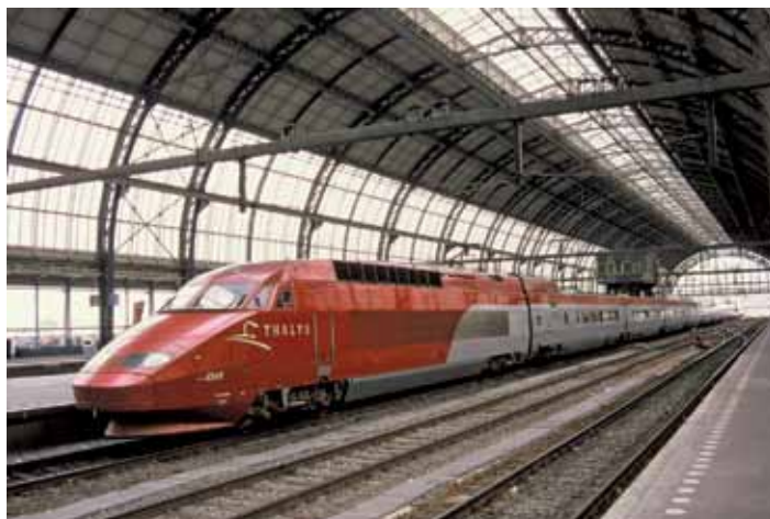
Pociąg TGV Thalys PBA nr 4540 na stacji Amsterdam Centraal (25.08.2000 r.)