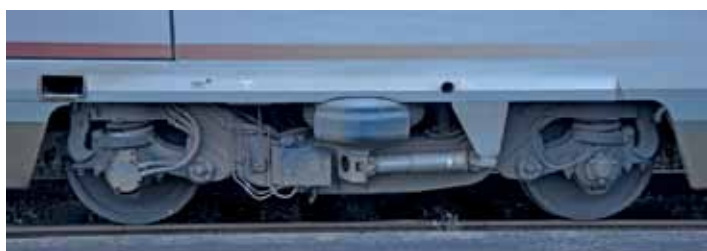
Wózek skrajny w wagonie pasażerskim pociągu TGV Thalys PBKA