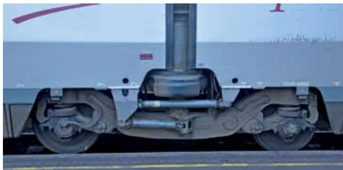
Wózek Jacobsa w wagonie pasażerskim pociągu TGV Thalys PBKA