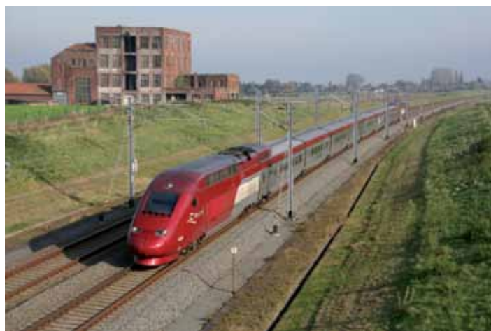
Pociąg TGV Thalys PBKA nr 4303 na linii LGV 1, Belgia (5.11.2006 r.)