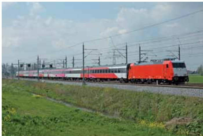
E186 z pociągiem pasażerskim relacji Bruksela – Amsterdam na przedmieściach Antwerpii (29.04.2008 r.)