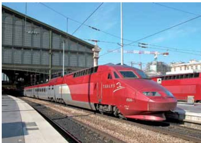
Pociąg TGV Thalys PBA nr 4536 na stacji Paris Nord (14.06.2002 r.)