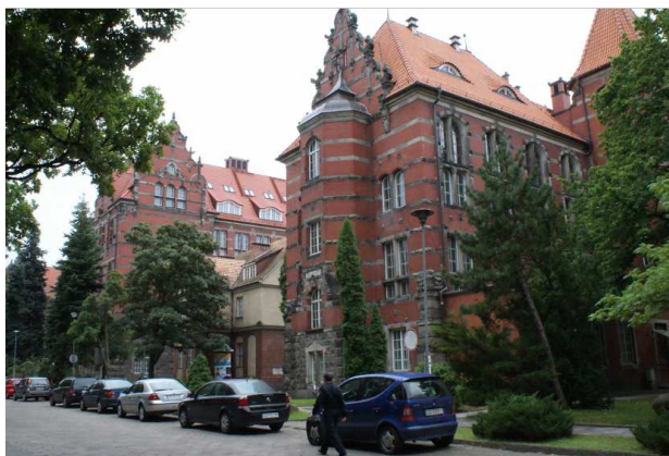
Rys. 1. Widok obiektów Politechniki Gdańskiej. Na pierwszym planie Gmach Wydziału Elektrotechniki i Automatyki

Historia Gmachu Wydziału Elektrotechniki i Automatyki sięga początku dwudziestego wieku [1]. Gmach ten wraz innymi obiektami tworzył pierwszy zespół obiektów Politechniki Gdańskiej (rys. 1). Ściany zewnętrzne są wykonane z cegły rozdzielonej pasami z szarego piaskowca. Elewacje zawierają szereg ozdobnych detali architektonicznych. Projekt iluminacji dotyczy elewacji północno-wschodniej (rys. 1 i 2a) znajdującej się przy drodze dojazdowej i parkingu. W czasie trwania roku akademickiego zauważa się tu duże natężeniu ruchu pieszych. Elewacja północno-wschodnia zawiera m.in. tarcze ze znakiem plus i minus („+” i „-”) – symbole elektryczności (rys. 2), dekoracje narożne (rys. 2c), kartusz z napisem „Wydział Elektryczny” (rys. 2d).