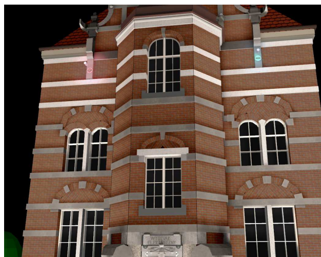
Rys. 7. Barwne wyeksponowanie znaków „+” i „-”

Rysunek 7 przedstawia barwne wyeksponowanie znaków „+” i „-” poprzez zastosowanie lokalnych naświetlaczy z filtrami barwnymi. Zastosowanie naświetlaczy o wyższej temperaturze barwowej niż w przypadku wizualizacji przedstawionej na rysunkach 5a i 5b pozwoliło uzyskać barwę elewacji zbliżoną do tej postrzeganej przy świetle dziennym (rys. 2).