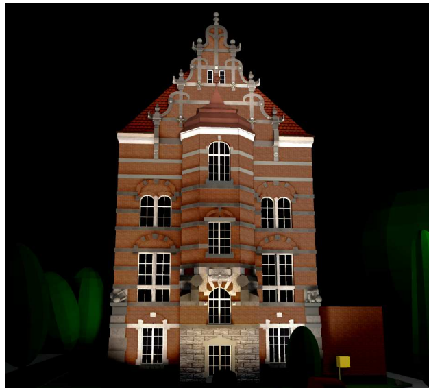
Rys. 6. Wizualizacja iluminacji z wykorzystaniem naświetlaczy umieszczonych na poziomie ziemi oraz na dwóch słupach

W wizualizacji przedstawionej na rysunku 6 zastosowano naświetlacze montowane na słupach w znacznej odległości od obiektu – oświetlają górną część elewacji, oraz naświetlacze umiejscowione w ziemi oświetlające od dołu niższe partie obiektu. Dzięki zastosowaniu naświetlaczy na słupach lepiej doświetlona jest górna część elewacji. Wykorzystanie światła mieszanego (lampy sodowe i metalohalogenkowe) zmienia nieco barwę elewacji na chłodniejszą.