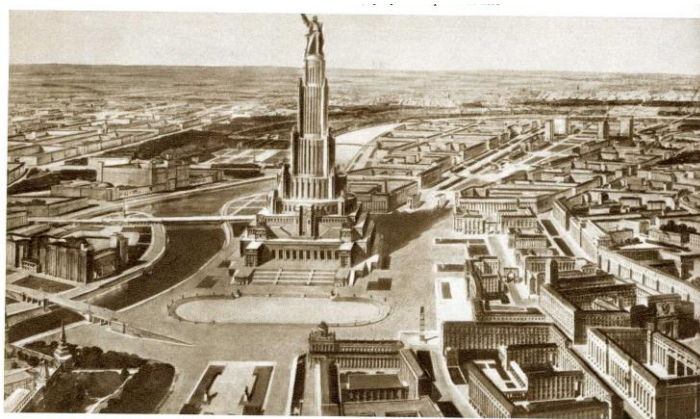
Рис. 2. Дворец Советов (Б. Иофан)

Возможность планировать высотное строительство наметилась лишь в тридцатые годы, когда был объявлен грандиозный конкурс на Дворец Советов - главное здание страны, которое должно было продемонстрировать всему миру мощь и величие достижений советской власти. Разрушив символ прежней эпохи, Храм Христа Спасителя, советские идеологи решили создать на его месте новую святыню, совмещающую объект поклонения вождю мирового пролетариата с чисто функциональным содержанием. Здание должно было работать как законодательный правительственный орган. В процессе прохождения через этапы конкурса, наметилась тенденция объединения всех помещений Дворца Советов в один объем, который представлялся своим создателям в виде огромного постамента для венчавшего всю композицию памятника В. Ленину.