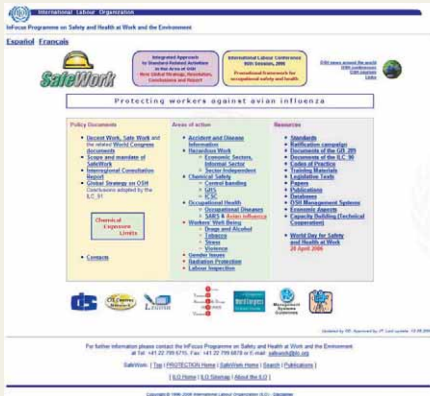
Rys. 2. Strona główna witryny SafeWork Fig. 2. The homepage of the SafeWork website