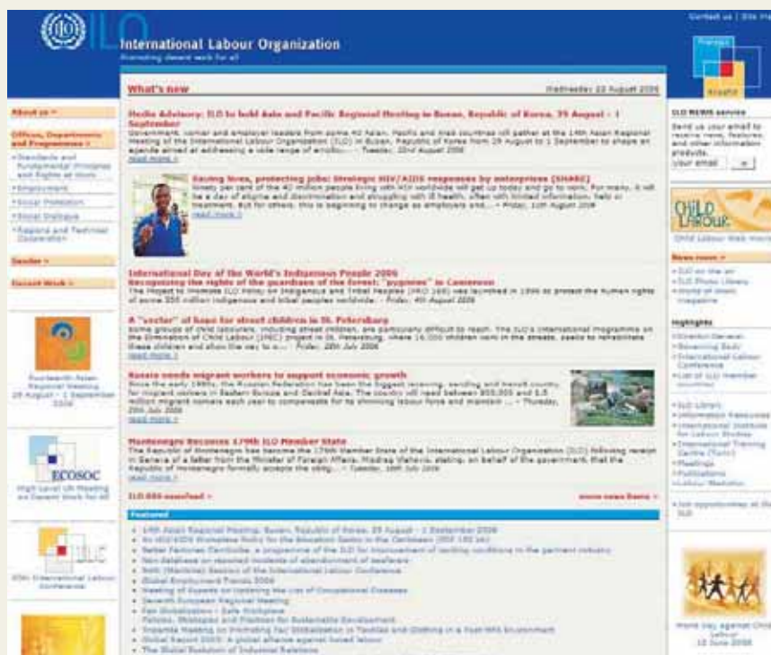
Rys. 1. Strona główna portalu Międzynarodowej Organizacji Pracy – ILO Fig. 1. The homepage of the International Labour Organization – ILO

Na tej stronie SafeWork zamieszczono także odnośniki do najnowszych wydań w dziedzinie bezpieczeństwa pracy na świecie, informacje o międzynarodowych konferencjach i kongresach, a także linki do portali krajowych i międzynarodowych instytucji. Wszystkie te informacje opracowuje funkcjonujące w ramach działu SafeWork Międzynarodowe Centrum Informacji o Bezpieczeństwie i Higieny Pracy CIS, do którego witryny prowadzą te linki.