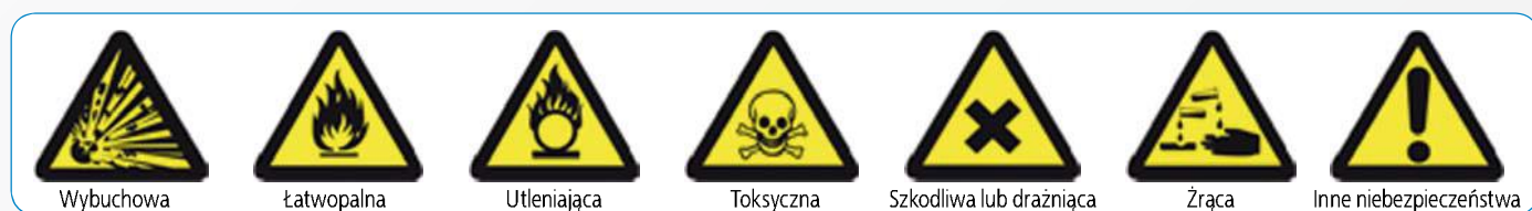
Rys. 1. Oznakowanie miejsc, rurociągów oraz pojemników i zbiorników do przechowywania substancji niebezpiecznych lub mieszanin [6]

6. Duże opakowania oraz duże pojemniki do przewożenia luzem można spiętrzać, jeśli jest na nich znak dopuszczający spiętrzanie.