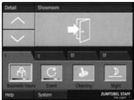
Rys. 5. Widok dotykowego ekranu, w który wyposażony jest panel sterowniczy [3]

Fig. 5. View of touch panel of lighting control system [3]