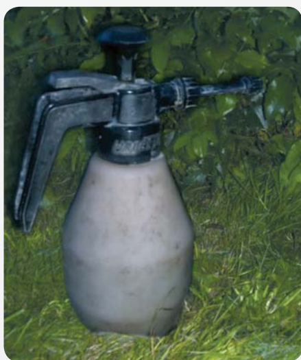
Fot. 3. Zaniedbany ręczny opryskiwacz wykorzystywany do aplikacji środków owadobójczych w przydomowym ogrodzie

Dostępne na polskim rynku rodentocydy (pestycydy gryzoniobójcze) to przede wszystkim substancje o działaniu antykoagulacyjnym, czyli zaburzające działanie układu krwionośnego. Większość z tych preparatów to związki, które należy przyjmować pokarmowo. W tym przypadku można się zabezpieczyć dodając do nich albo substancje pogarszające smak, przez co tracą na atrakcyjności dla naszych kubków smakowych, albo też substancje powodujące wymioty, dzięki czemu po przypadkowym zjedzeniu nasz organizm szybko pozbędzie się takiej trucizny (gryzonie nie mają odruchu wymiotnego).