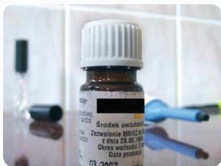
Fot. 2. Standardowe opakowanie preparatu owadobójczego

Przeciętny obywatel Rzeczypospolitej Polskiej styka się z chemicznymi środkami ochrony roślin poprzez glebę, wodę i produkty żywnościowe pochodzenia roślinnego i zwierzęcego [5]. Są jednak grupy zawodowe znacznie częściej, a przede wszystkim w znacznie większym stopniu narażone na kontakt z pestycydami.