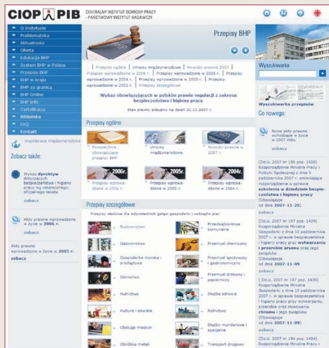
Rys. 2. Pierwsza strona serwisu prawnego w portalu CIOP-PIB Fig. 2. Homepage of the legislation website in CIOP-PIB's portal