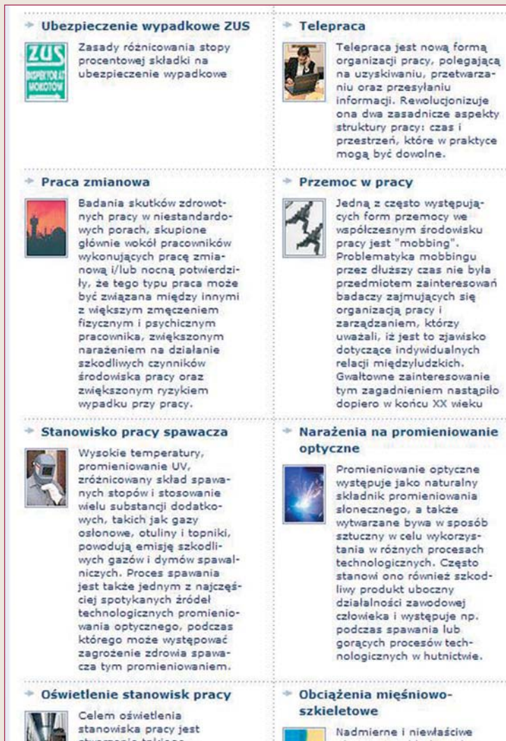
Rys. 3. Strona rozgątajająca rozbudowanego działu BHP-Info Fig. 3. Branching page of the BHP-Info section of the portal

Nowe działy Certyfikacja i Informacja naukowa będą sukcesywnie wzbogacone