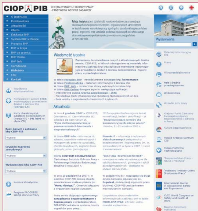
Rys. 1. Strona główna portalu CIOP-PIB Fig. 1. Homepage of CIOP-PIB's portal

Rozbudowano i wzbogacono nowymi materiałami serwis prawny w portalu CIOP-PIB, dostępny obecnie bezpośrednio z jego menu głównego pn. Przepisy BHP (rys. 2.).