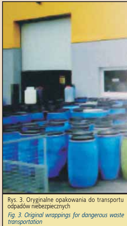
Rys. 3. Oryginalne opakowania do transportu odpadów niebezpiecznych

Podczas prac z substancjami niebezpiecznymi obowiązują dodatkowe obostrzenia