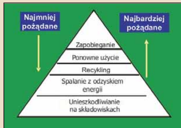
Rys. 2. Zasada piramidy – właściwe gospodarowanie odpadami Fig. 2. Pyramid rule – correct waste management

Gospodarowanie odpadami chemicznymi w MŚP i MP powinno być zgodne z ustawą z dnia 27 kwietnia 2001 r. o odpadach i ustawą z dnia 11 maja 2001 r. o obowiązkach przedsiębiorców w zakresie gospodarowania niektórymi odpadami oraz o opłacie produktowej i opłacie depozytowej, a także na podstawie regulaminu działania i instrukcji ruchowych poszczególnych komórek przedsiębiorstwa,