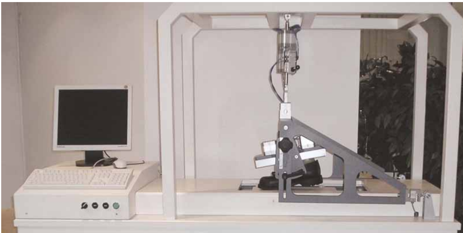
Fot. Stanowisko do wyznaczania odporności obuwia na poślizg zbudowane w Centralnym Instytucie Ochrony Pracy – Państwowym Instytucie Badawczym Photo. A stand for testing footwear slip resistance built in the Central Institute for Labour Protection – National Research Institute

Doprowadziło to między innymi do opracowania PN-EN ISO 13287:2007 [4] zharmonizowanej z dyrektywą 89/686/EWG [5], w której podano standardową metodę wyznaczania odporności obuwia na poślizg. Zasada tej metody jest następująca: półparę obuwia umieszcza się na płaskim podłożu, poddaje się ją działaniu siły normalnej i przesuwają poziomo względem podłoża lub przesuwają się podłożem poziomo względem półpary obuwia. Mierzy się siłę tarcia i oblicza dynamiczny współczynnik tarcia.