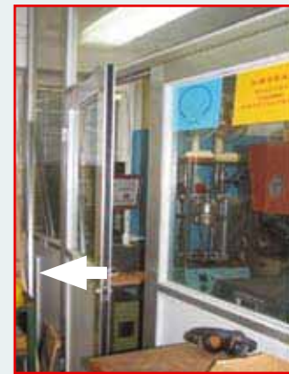
Fot. 4. Wydzielone pomieszczenie w hali produkcyjnej Photo 4. Space sectioned off of a shop floor