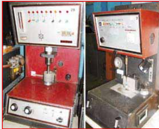
Fot. 1. Drążarki bez obudowy (A1, A2) Photo 1. Drills without housing (A1, A2)

Wyznacza się wielkości fizyczne charakteryzujące hałas ultradźwiękowy, tj.: