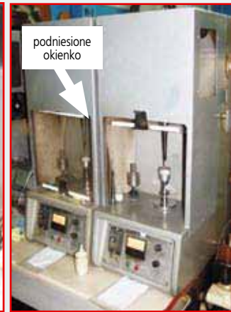
Fot. 2. Drążarki z obudową (B1, B2, C) Photo 2. Drills with housing (B1, B2, C)