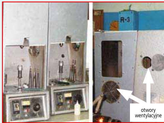
Fot. 3. B1, B2, drill casing with an air vent Photo 3. B1, B2, drill casing with an air vent