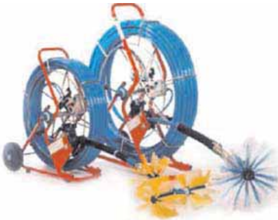
Rys. 3. Urządzenie pneumatyczne służące do czyszczenia mechanicznego szczotkami i dezynfekcji biocydami (po założeniu specjalnej szczotki wyposażonej w nasadkę dezynfekującą) [2]

Fig. 3. Pneumatic device for mechanical cleaning with brushes and biocide disinfection (equipped with a special brush with a disinfection adapter) [2]