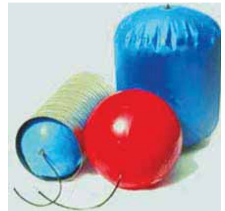
Rys. 2. Balony zaporowe [2]

Fig. 1. Set of devices for cleaning and disinfecting air ducts: 1 – pneumatic cleaning device, 2 – small cleaning device, 3 – brushes for different types of ducts, 4 – tallow scraper, 5 – air compressor, 6 – exhaust air duct, 7 – HEPA filtered vacuums [2]