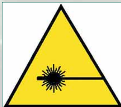
Rys. 2. Etykieta ostrzegawcza – znak zagrożenia (PN-EN 60825-1: 2000)