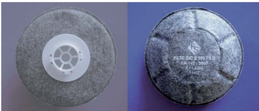
Rys. 3a. Górna część filtra BIO E 953 P3 R Fig. 3a. Upper part of BIO E 953 P3 R filter