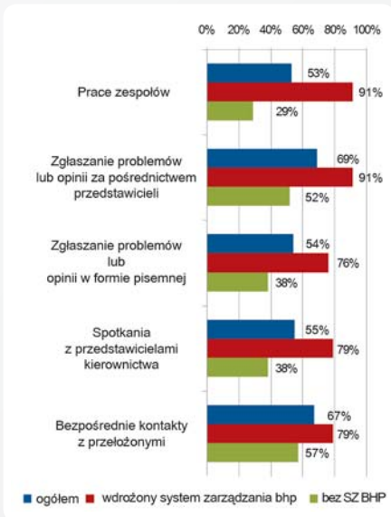
Rys. 1. Przedsiębiorstwa wdrażające różne formy partycypacji bezpośredniej (w procentach)