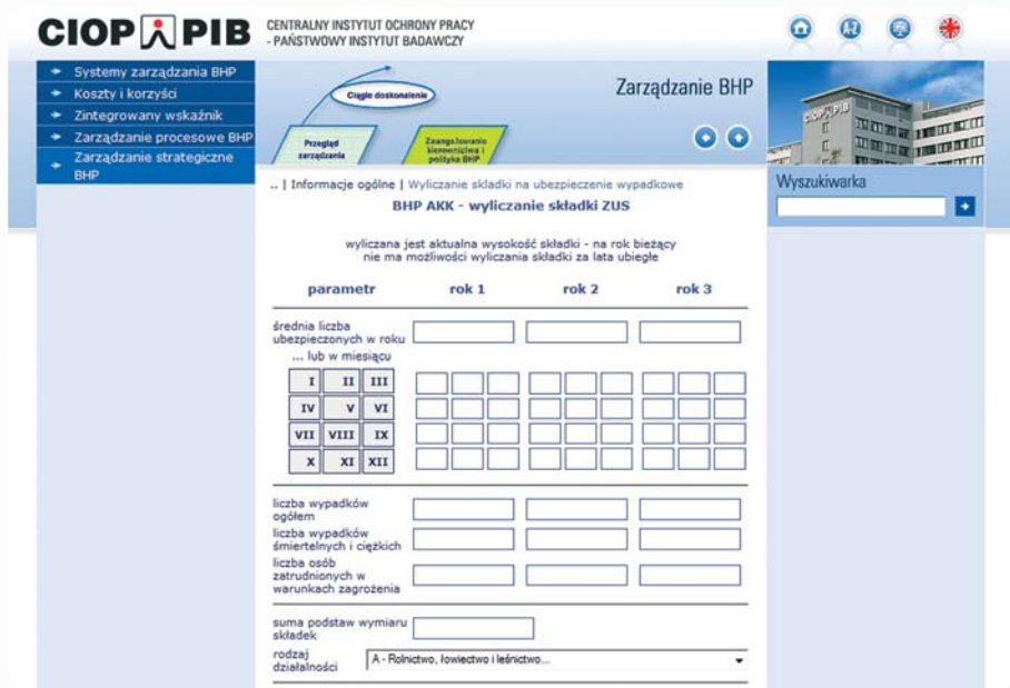
Rys. 1. Strona internetowa portalu CIOP-PIB: www.ciop.pl/18738.html udostępniająca możliwość wyliczenia składki na ubezpieczenie wypadkowe

1,5 – jeśli kategoria ryzyka ustalona dla płatnika składek jest wyższa o co najmniej 6 kategorii od kategorii ryzyka ustalonej dla grupy działalności.