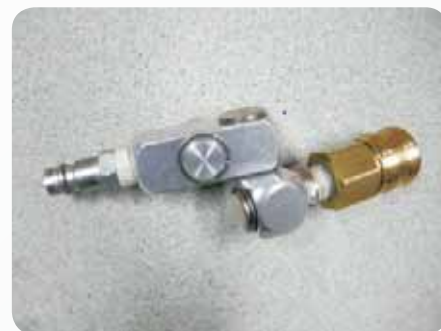
Fot. 3. Zawór dławiący Photo 3. Choke valve