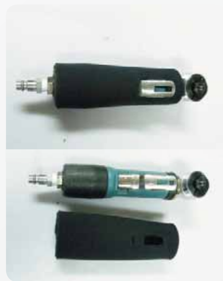
Fot. 5. Szlifierka kątowna z osłoną Photo 5. Grinder with cover