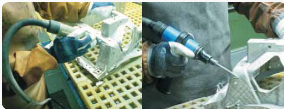
Fot. 10. Sposób gradowania przed i po modernizacji Photo 10. Means of deburring before and after modernization