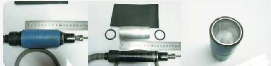
Fot. 6. Pilnik z nową osłoną