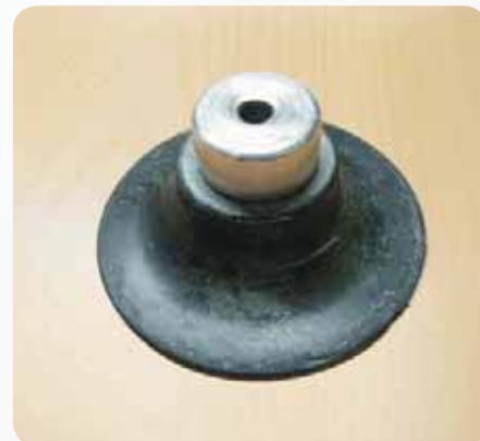
Fot. 4. Głowica mocująca Photo 4. Fixing head

badano również wpływ różnych typów głowic mocujących papier ścierny (fot. 4.);