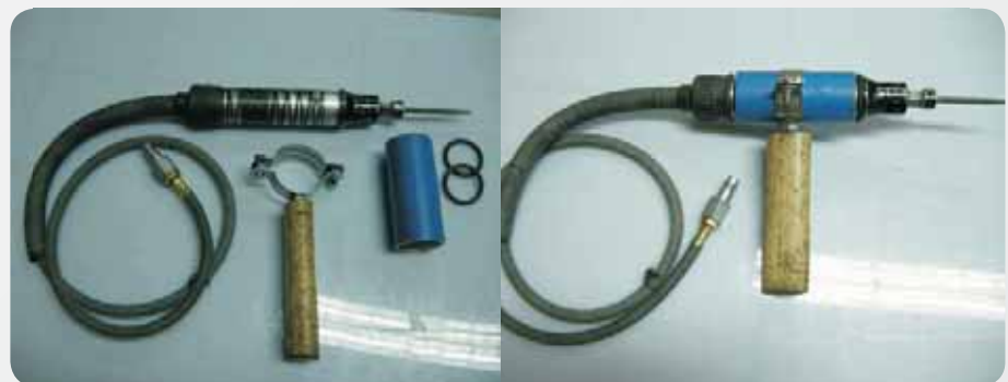
Fot. 8. Pilnik z nową osłoną i drewnianym uchwytem

Photo 8. Pneumatic file with new cover and wooden handle