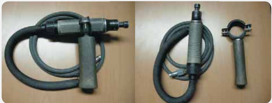
Fot. 7. Pilnik z uchwytem