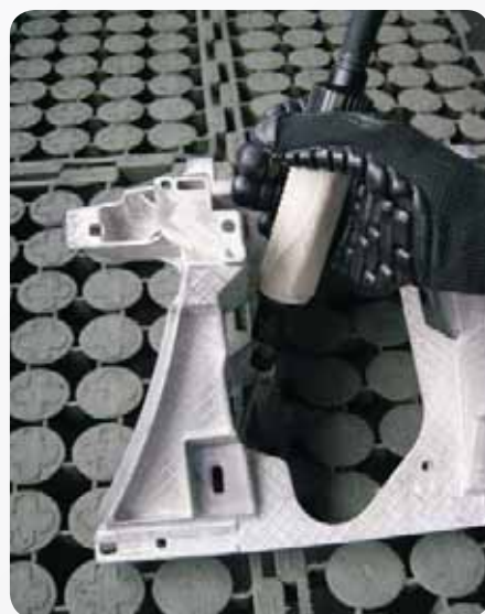
Fot. 2. Gradowanie w rękawicy antywibracyjnej Photo 2. Deburring in anti-vibration glove