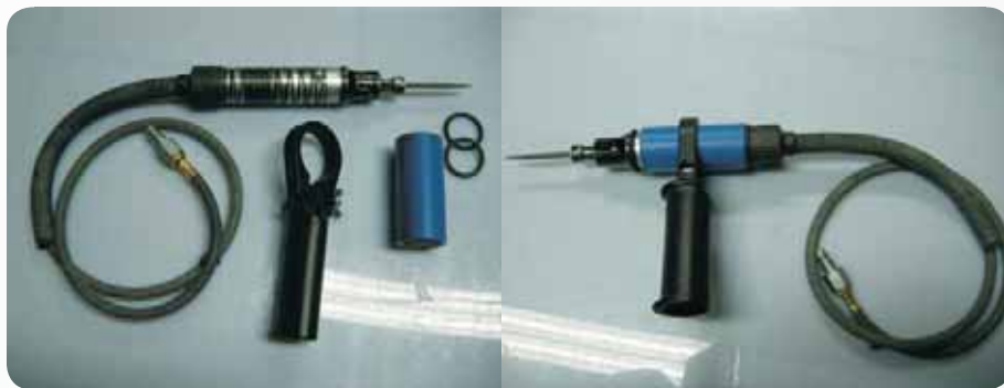
Fot. 9. Pilnik z nową osłoną i profesjonalną rączką Photo 9. Pneumatic file with new cover and professional handle

Na stanowisku oczyszczacza odlewów w trakcie wykonywania czynności gradowania i szlifowania, dzięki zastosowaniu odpowiednich modyfikacji narzędzi pneumatycznych (szlifierki, pilnika) udało się obniżyć poziom drgań mechanicznych działających na organizm człowieka przez kończyny górne poniżej wartości dopuszczalnych (wartości NDN). Będzie to miało niewątpliwie wpływ na zdrowie pracowników Finnveden Metal Structures, gdyż ryzyko zachorowania na chorobę zawodową, tzw. zespół wibracyjny, zostało znacznie zmniejszone. Pracownicy są zadowoleni, a zdecydowana większość