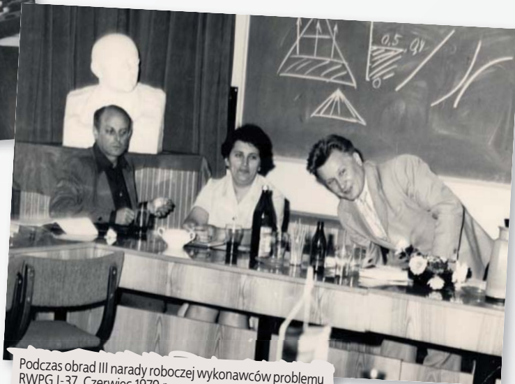
Podczas obrad III narady roboczej wykonawców problemu RWPG 1-37. Czerwiec 1979 r.