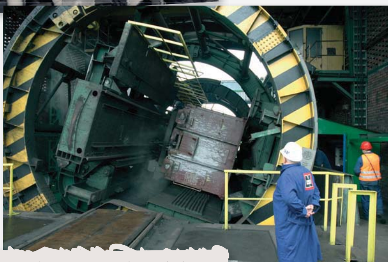
Ocena dostosowania maszyn do minimalnych wymagań bhp w zakładzie produkcyjnym. Rok 2005