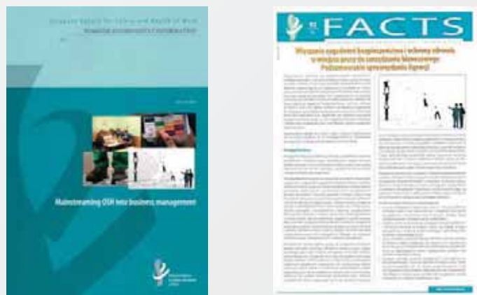
Fot. 2. Raport dotyczący włączania bezpieczeństwa pracy do zarządzania biznesowego (w jęz. ang.) oraz biuletyn „Fakty” dotyczący tej tematyki (w jęz. polskim)

Kolejnym raportem najczęściej towarzyszą zwięzłe, dwustronicowe biuletyny „Fakty”, publikowane we wszystkich językach urzędowych UE, zawierające streszczenia raportów oraz najważniejsze wnioski. Przykładem może być tutaj biuletyn „Fakty” nr 92 (fot. 2.) pt. Włączanie zagadnień bezpieczeństwa i ochrony zdrowia w miejscu pracy do zarządzania biznesowego , stanowiący podsumowanie raportu dotyczącego tej tematyki [3], który przedstawia te zagadnienia w kontekście całego systemu zarządzania organizacją i łączenia celu kształtowania bezpieczniejszego i zdrowszego środowiska pracy z dążeniem do coraz lepszej efektywności ekonomicznej.