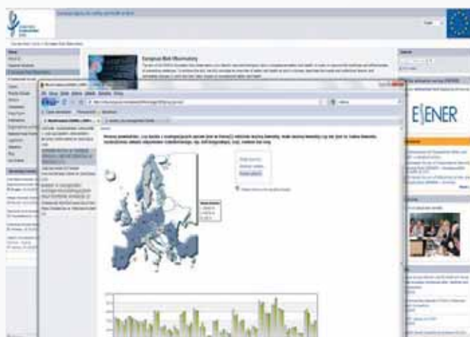
Fig. 3. „New types of risks in occupational safety and health (Review 1)” accessible in all official EU languages, published on the Agency’s website