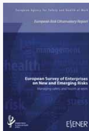
Fot. 4. Raport Agencji oraz interaktywne narzędzie ( http://osha.europa.eu/sub/esener/pl ), prezentujące wyniki europejskiego badania przedsiębiorstw na temat nowych i pojawiających się zagrożeń

Fot. 4. Agency report and an interactive tool presenting results of the European Survey of Enterprises on New and Emerging Risks