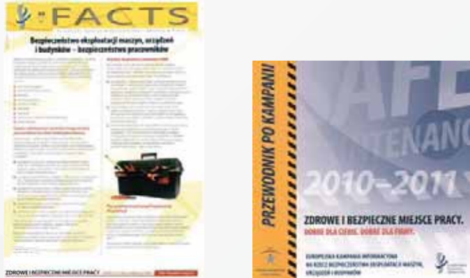
Fot. 1. Wybrane publikacje związane z tematyką kampanii informacyjnej 2010-2011, udostępniane w języku polskim

w różnych sektorach – są wykonywane w zasadzie w każdym środowisku pracy i dotyczą wszystkich sektorów gospodarki. Dane gromadzone przez Agencję wskazują, że znaczny procent wszystkich wypadków przy pracy w krajach członkowskich UE związany jest z pracami konserwacyjnymi. Badania naukowe dowodzą, że choroby zawodowe i problemy zdrowotne mające związek z pracą (np. azbestoza, nowotwory, problemy ze słuchem i schorzenia układu mięśniowo-szkieletowego) występują stosunkowo często wśród pracowników wykonujących prace konserwacyjne.