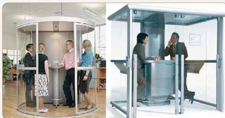
Fot. Wzory kabin dla osób palących wyroby tytoniowe [14, 15]