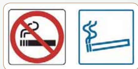
Rys. Znaki zakazu palenia (po lewej) oraz oznaczenia strefy dla palaczy (po prawej)

Pracujący nałogowi palacze wszystkich szczebli i profesji, w tym pracownicy reali-