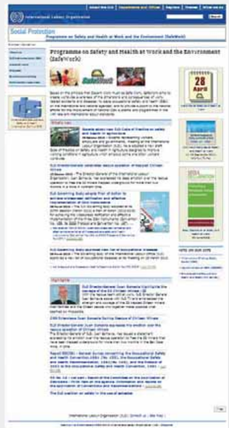
Rys. 2. Strona główna witryny działu „SafeWork”

Fig. 2. The main page of the „SafeWork” website