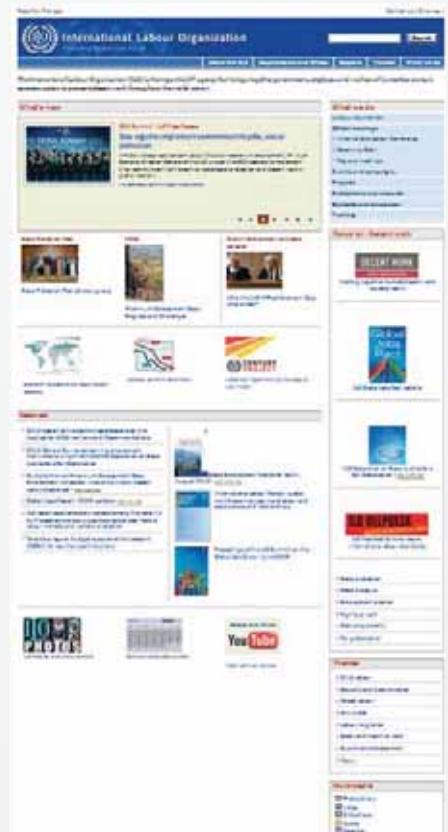
Rys. 1. Strona główna portalu Międzynarodowej Organizacji Pracy

Witryna działu „SafeWork” zawiera także mapę witryny, informacje kontaktowe, informacje o pracownikach i zakresie tematycznym ich pracy, a także linki do informacji dotyczących organizacji i działalności Międzynarodowej Organizacji Pracy i Międzynarodowego Biura Pracy.