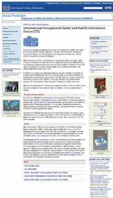
Rys. 3. Strona główna witryny Międzynarodowego Centrum CIS

Publikacja przygotowana na podstawie wyników uzyskanych w ramach I etapu programu wieloletniego pn. „Poprawa bezpieczeństwa i warunków pracy” dofinansowywanego w latach 2008-2010 w zakresie zadań służb państwowych przez Ministerstwo Pracy i Polityki Społecznej. Główny koordynator: Centralny Instytut Ochrony Pracy – Państwowy Instytut Badawczy.