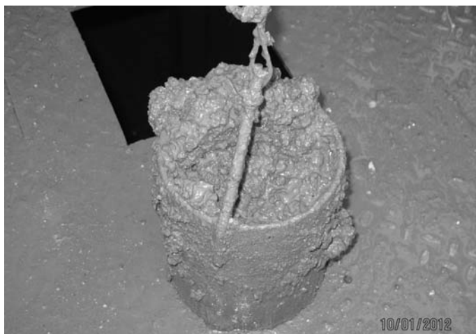
Fot. 4. Kubek stalowy wyciągnięty z szybu wypełniony mieszanką

Phot. 4. Steel cup pullet out of the shaft filled slurry