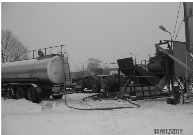
Fot. 3. Zbiornik solanki (cysterna) oraz ładowarka łyżkowa w czasie pracy