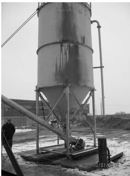
Fot. 2. Silos na spoiwo wraz z przenośnikiem ślimakowym