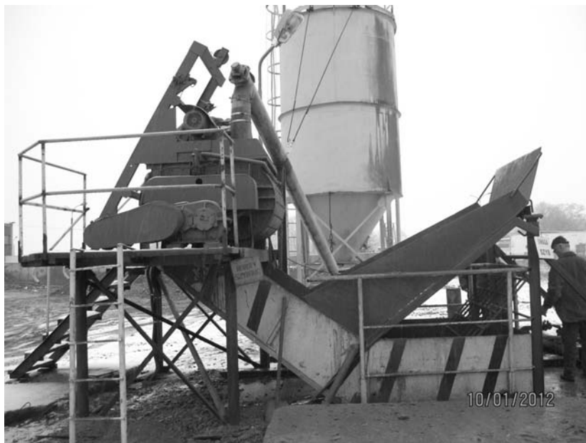
Fot. 1. Mieszarka dwuwałowa bębnowa wraz z rynną zsypaną

Widok poszczególnych elementów instalacji przedstawiono na fotografiach 1–3. Obecnie stosowany sposób mieszania przebiega następująco. Do pustej komory mieszalnika wprowadzana jest solanka, a następnie dodawane jest przenośnikiem ślimakowym spoiwo zmagazynowane w silosie. W komorze mieszalnika z wykorzystaniem obracających się łopat następuje mieszanie się solanki ze spoiwem, tworząc zaczyn spoiwowy. Przyjmuje się, że jednorazowa objętość wykonanej w mieszalniku mieszanki wynosi około 0,85 m 3 , natomiast jej konsystencja odpowiada rozlewności mierzony kubkiem Forda wynoszącej