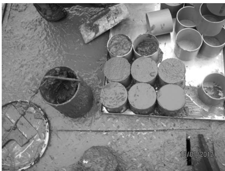
Fot. 5. Cylindry plastikowe wypełnione mieszaniną wyciągniętą z szybu

Na fotografii 4 pokazano kubek stalowy wyciągnięty z szybu wypełniony mieszaniną, natomiast na fotografii 5 – tacę z plastikowymi cylindrami wypełnionymi mieszaniną zestawiającą przełożoną z metalowego kubła.