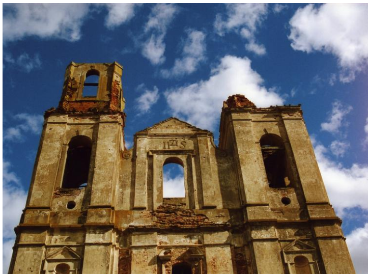
Рис. 1. Двухбашенный барочный храм (д. Селище)