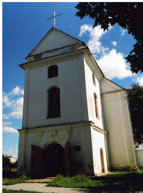
Рис. 3. Реформаторский храм, перестроенный в XVIII в. (д. Замостье)