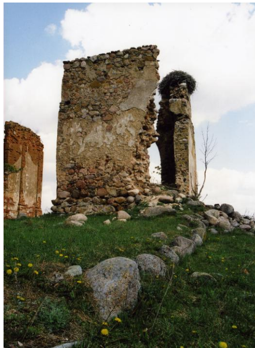
Рис. 5. Руины, как образ старой Беларуси