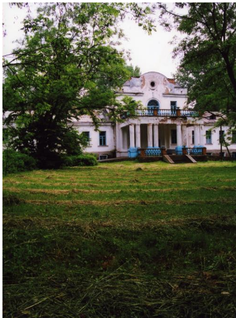
Рис. 4. Усадьба «Совейки» современное цветное вмешательство в традиционную архитектуру