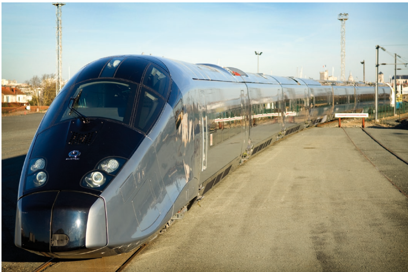
Pociąg AGV na terenie fabryki Alstoma w La Rochelle (26.01.2008)