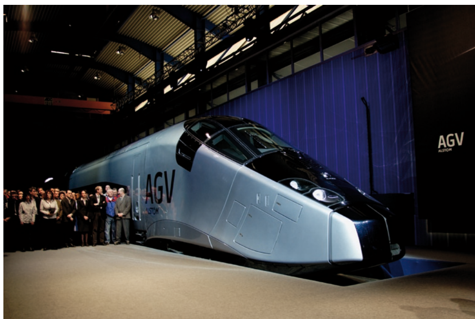
Uroczysta prezentacja pociągu AGV na terenie fabryki Alstoma w La Rochelle (5.02.2008 r.)

Jednostka AGV jest pierwszym na świecie pociągiem wyposażo-