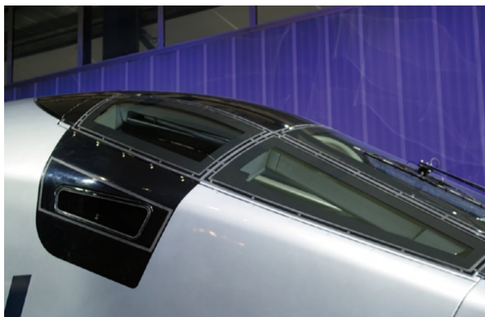
Wagon skrajny AGV (5.02.2008 r.)

Nierozstrzygniętym problemem pozostaje zasadność montowania w pociągu AGV hamulców na prądy wirowe – wprawdzie