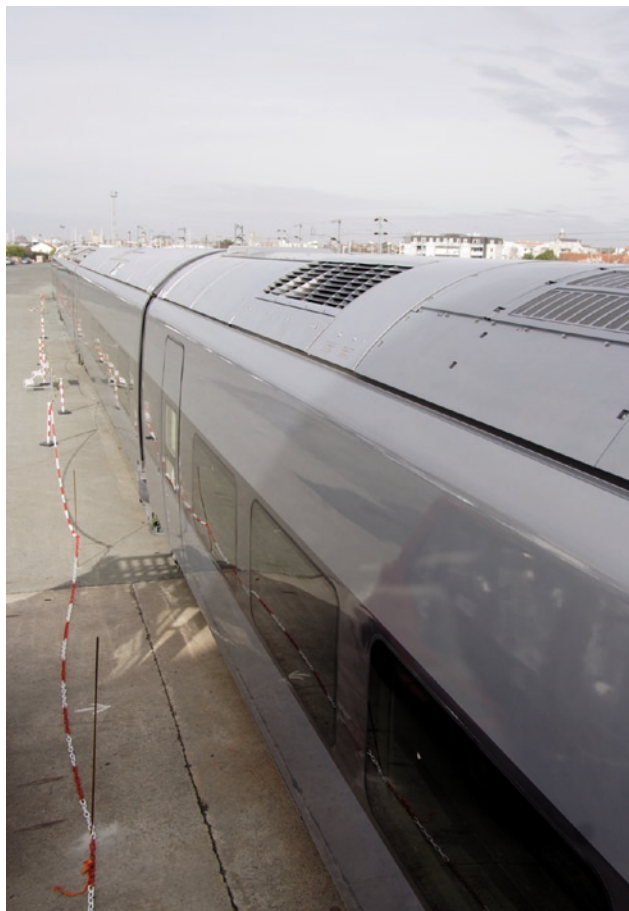
Wagon środkowy AGV (5.02.2008 r.)