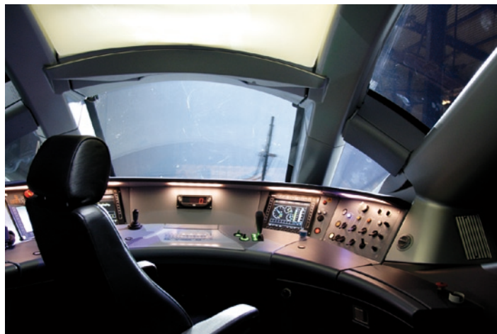
Pulpit maszynisty pociągu AGV (5.02.2008 r.)