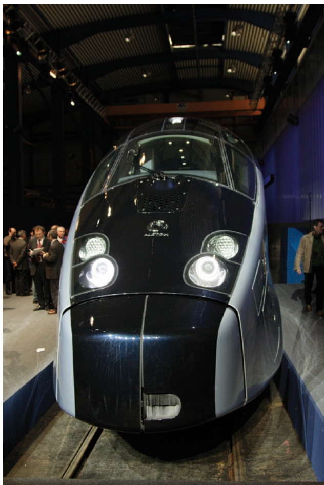
Czoło pociągu, wagon skrajny AGV (5.02.2008 r.)

„Pegaz” jest w nie wyposażony (2 pary), jednak nie zdecydowano jeszcze o ich montażu seryjnym w kolejnych jednostkach AGV.