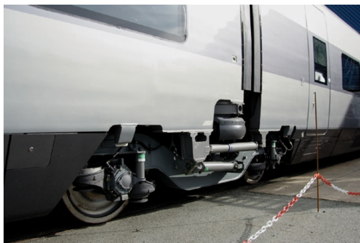
Wózek napędny AGV (5.02.2008 r.)