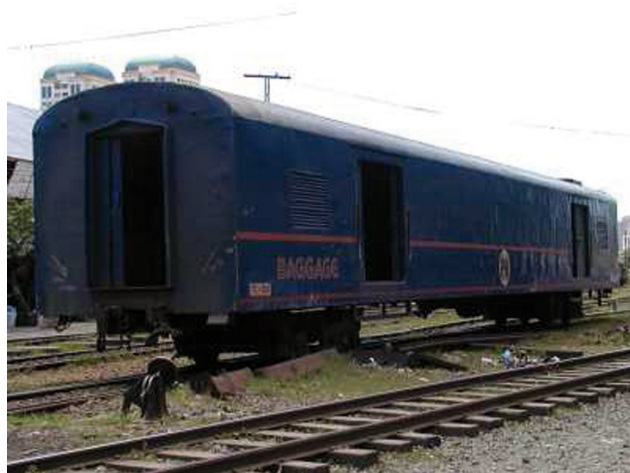
Fot. 10. Filipiński wagon bagażowy [35]

Pierwszy pociąg ruszył 24 marca 1891 r. Rozwój kolei przypadł na administrację amerykańską po I wojnie światowej. W trakcie II wojny światowej tory przekuto na rozstaw japoński 1067 mm. Po II wojnie światowej Filipiny uzyskały w latach 60. XX w., w ramach reparacji wojennych, japońskie wagony bagażowe. Główny ruch kolejowy na Filipinach jest prowadzony na wyspie Luzon. Jest jedna towarowa linia kolejowa w Manili na terminal kontenerowy w porcie.