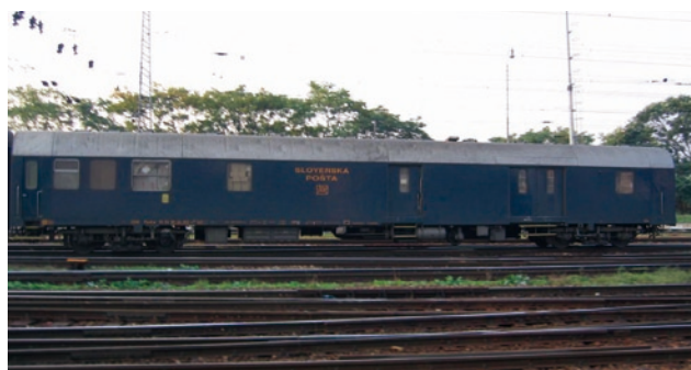
Fot. 4. Słowacki wagon pocztowy typu Postw [7].

Pierwszy przewóz poczty koleją odnotowano 1 czerwca 1846 r. na trasie Bratysława – Trnava trakcją konną. Stopniowo system przesyłu poczty rozbudowywał się podczas istnienia Czechosłowacji. Przyjęty w 2000 r. plan restrukturyzacji poczty słowackiej zakładał przyjęcie jednolitej technologii rozdziału i przesyłu poczty w oparciu o 4 centra rozdzielcze: Pošta Bratislava 022, Pošta Zvolen 2, Pošta Žilina 2, Pošta Košice 2. stopniowo wygaszano przewozy pocztowe koleją. Oficjalnie ostatni kurs ambulansu pocztowego podaje się na 1 kwietnia 2000 r., jednakże jeszcze w 2005 r. odnotowywano dołączanie ambulansów pocztowych do pociągów [6].