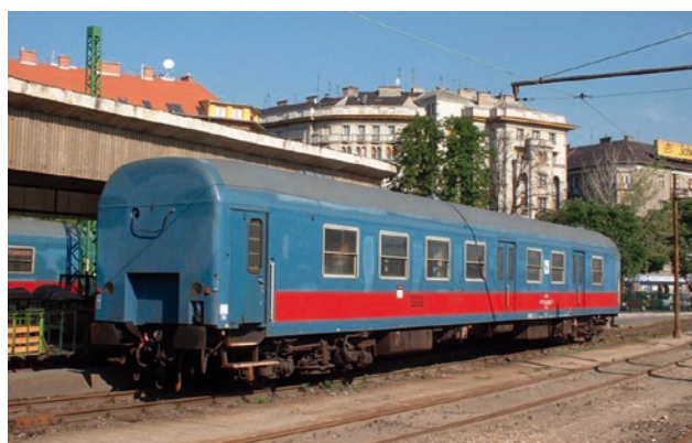
Fot. 6. Węgierski wagon pocztowy, zbudowany w PAFAWAG, na stacji Budapest Déli (13.06.2002) [20]