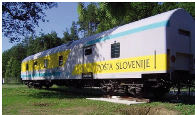
Fot.3. Wagon pocztowy w Mariborze, 19 czerwca 2005 [5]

pojazdów jest wyłączona z ruchu. Jeden z nich stoi jako eksponat w Mariborze.