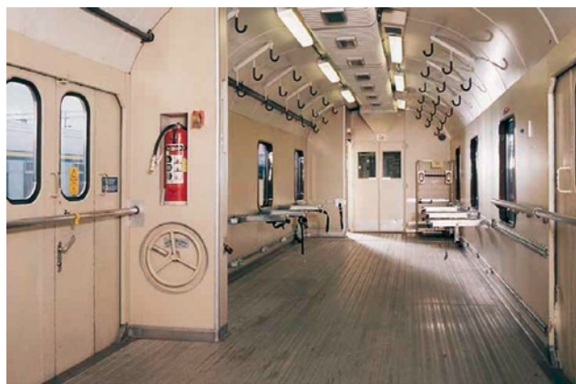
Fot 2. Wnętrze głównego pomieszczenia wagonu typu Fot [3]