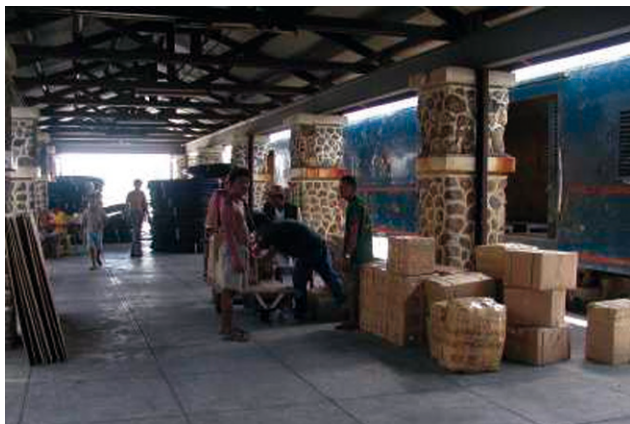
Fot. 11. Wyładunek bagażu na stacji Ligaspi [35]