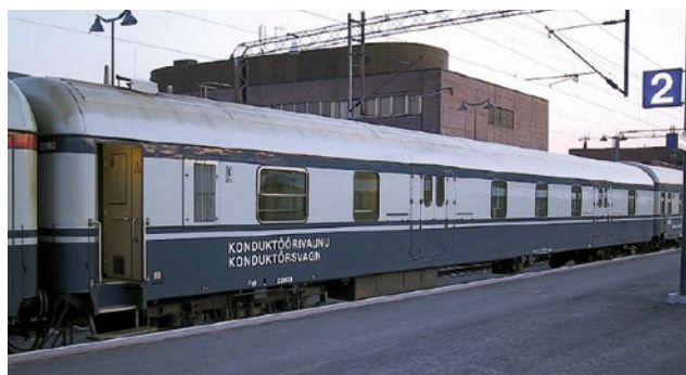
Fot. 1. Wagon typu Fot dla przesyłek konduktorskich i bagażowych [2]