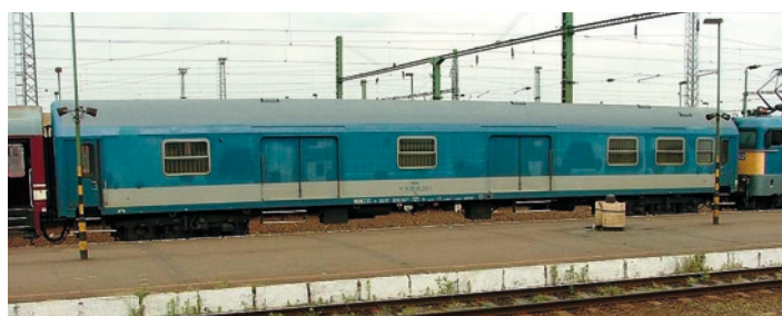
Fot. 7. Węgierski wagon bagażowy typu Dms na stacji Szolnok (23.06.2005) [23]

do 3–5 [21]. Pociągi MAV w dalszym ciągu mają dołączane wagony bagażowe [22]. Przykładowy wagonu typ Dms przedstawiono na fotografii 7.