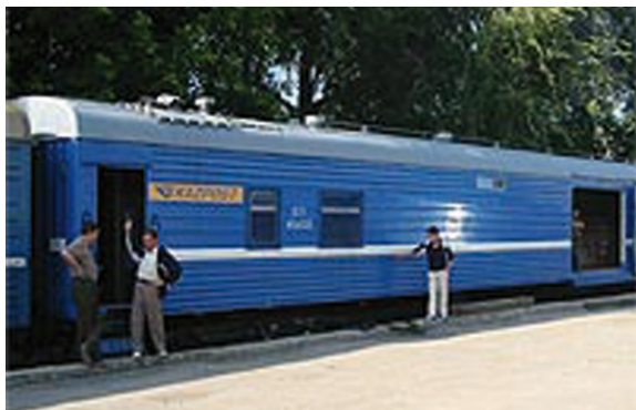
Fot. 8. Kazachski wagon pocztowy [29]

Pierwsze przewozy poczty koleją zrealizowano w latach 20. XX w., kiedy Kazachstan wchodził w skład ZSRR. Obecnie w dalszym ciągu są wykorzystywane przewozy kolejowe poczty w Kazachstanie, w 2005 r. poczta Kazachstanu zakupiła dwa nowe wagony pocztowe w Rosji.