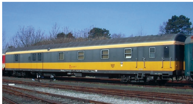
Fot. 5. Austriacki wagon pocztowy typu Postm [17]

1 maja 2004 r. zakończono korzystania z kolejowych ambulansów pocztowych na Węgrzech. Według użytkowników spowodowało to wydłużenie czasu przesyłu poczty przez Węgry z 2 dni