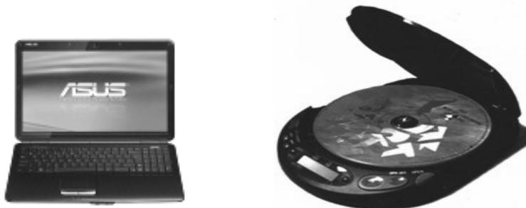
Rys. 2. Narzędzia do odtwarzania e-booków (notebook, odtwarzacz CD)

formę działalności gospodarczej, w której ramach wykształciły się różnego rodzaju usługi, tj.: noclegi, usługi gastronomiczne oraz usługi transportowe.