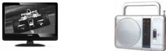
Rys. 4. Tradycyjne – elektroniczne źródła informacji (telewizor, radio)