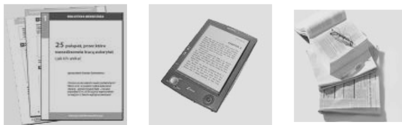
Rys. 3. Tradycyjne - drukowane źródła informacji (książki, czasopisma)