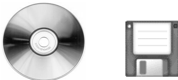
Rys. 5. Nośniki informacji (płyta CD, dyskietka)