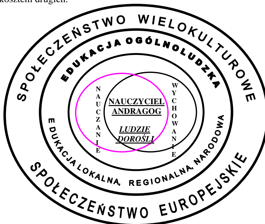
Rys. 1. Miejsce nauczyciela andragoga w europejskim społeczeństwie wielokulturowym

W społeczeństwie wielokulturowym szczególnego znaczenia nabiera miejsce (rys.1) i rola jaką ma w nim do spełnienia nauczyciel andragog. Z jednej strony, jakie winien posiadać kompetencje, które pozwolą mu na należyte wypełnianie swoich funkcji zawodowych, tym samym zapewni tożsamość narodową podopiecznym, bez względu na ich przekonania, różnorodność religijną, przywiązania do tradycji swojego narodu czy wyznawany system wartości, jaki obowiązuje w rodzinie, społeczności, z której się wywodzą. Z drugiej strony, jak ma on zbudować swój autorytet, aby zarówno nie naruszyć godności swoich wychowanków, jak i nie deprecjonować jednych przekonań ogólnoludzkich kosztem drugich.