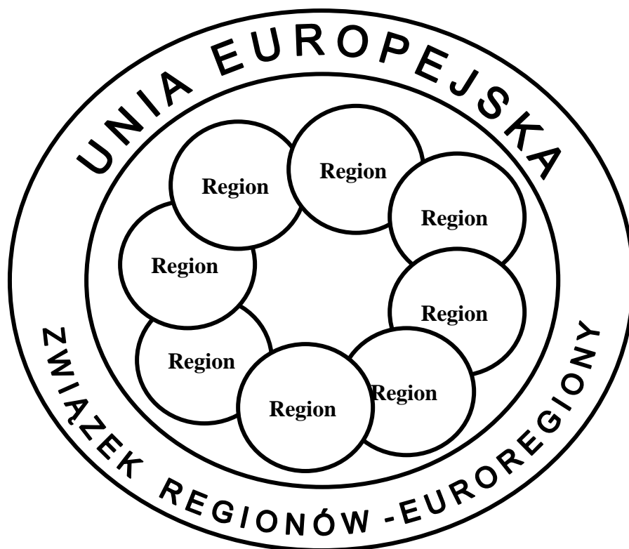
Rys. 2. Wpływ Unii Europejskiej na politykę regionalną społeczeństw ją tworzących

W edukacji regionalnej nauczyciel-andragog powinien umieć dostrzec aspiracje poszczególnych zbiorowości regionalnych, autonomiczność, dziedzictwo kulturowe tak, aby przeciwstawić się wszelkiemu separatyzmowi.