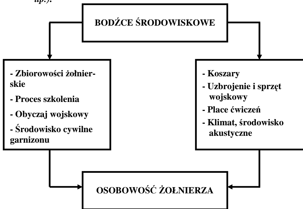
Rys. 2. Elementy środowiska wojskowego 24

Wymienione na schemacie elementy środowiska wojskowego oddziałują w sposób zróżnicowany na osobowość żołnierza. On natomiast nieustannie – zwłaszcza