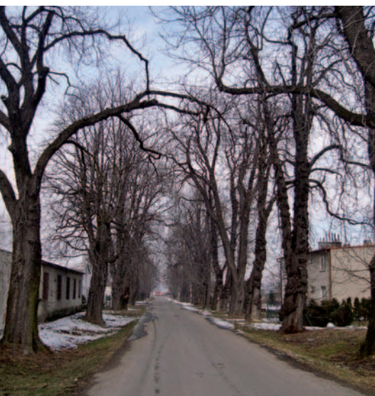
Ryc. 16. Aleja wiodąca do pałacu w Igołomi, woj. małopolskie (2011)

Fig. 15. Alley leading to manor in Brzezice (2008)