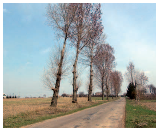
Ryc. 19. Pozostałości drzewostanu po modernizacji drogi Lublin-Łęczna, woj. lubelskie (2006)

Fig. 18. Preserved fragment of the chestnut trees alley between the church and cemetery in Trójca, świętokrzyskie voivodeship (2011)