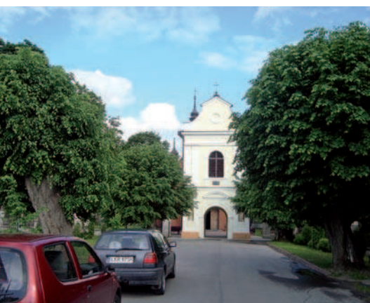
Ryc. 26. Ogłowione zabytkowe lipy alei prowadzącej do kościoła w Dzierzkowicach, woj. lubelskie (2009)

Fig. 25. Remains of ruined chestnut tree alley leading to the manor in Samokłęski, lubelskie voivodeship (2008)