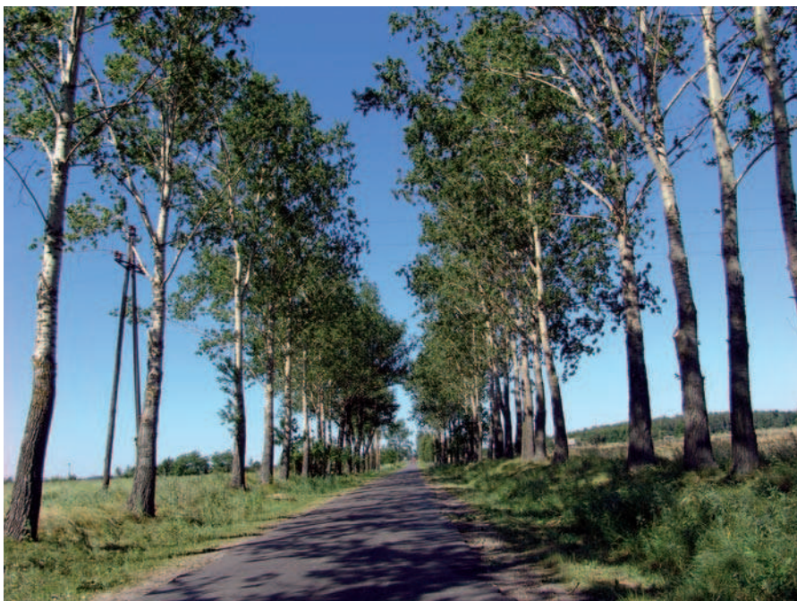
Ryc. 10. Niezabitów k. Nałęczowa, nieistniejąca już aleja topolowa (2007)