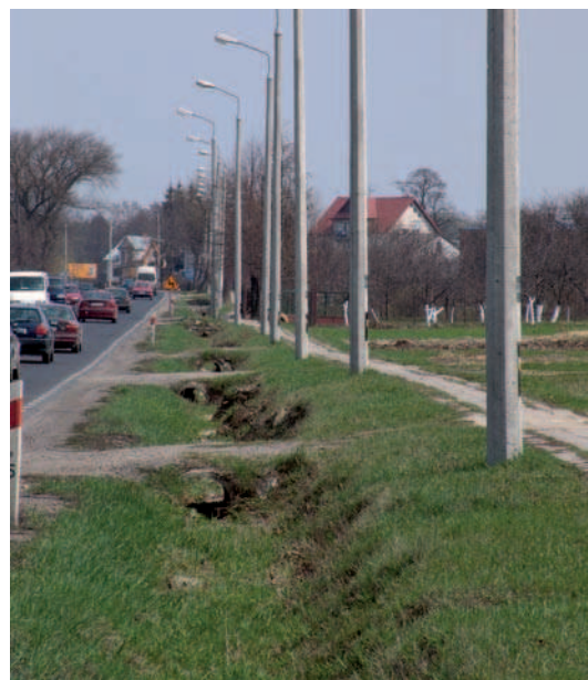
Fig. 19. Remains of tree stand after the modernization of the road Lublin-Łęczna, lubelskie voivodeship (2006)