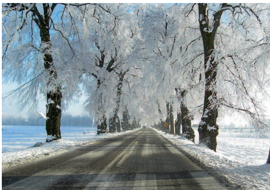
Ryc. 22. Zabytkowa aleja lipowa Lublin-Nałęczów zimą (2011)