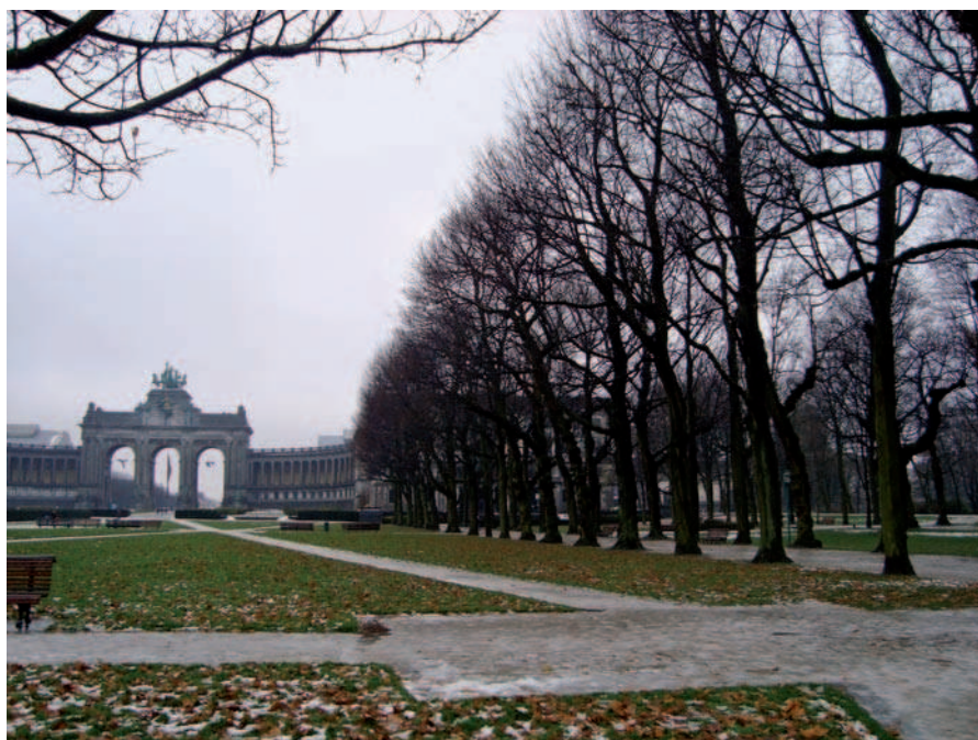
Ryc. 8. Bruksela, Belgia, Parc de Cinquantenaire (2010)