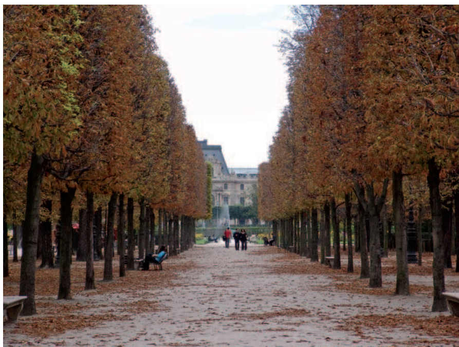
Fig. 1. Paris, alley in Tuillery gardens (2005)