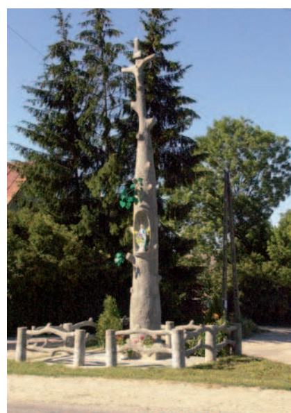
Ryc. 30. Betonowe drzewo – kapliczka przy drodze w Wąwolnicy, woj. lubelskie (2009)