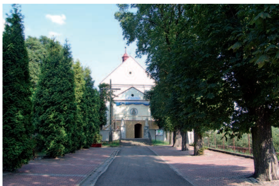
Ryc. 29. Aleja prowadząca do kościoła w Zawichoście nad Wisłą – kasztanowce z jednej strony, a z drugiej – współczesne żywotniki (2011)