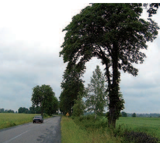
Ryc. 25. Pozostałości zniszczonej alei kasztanowców prowadzącej do dworu w Samokłęskach, woj. lubelskie (2008)

Fig. 24. Historic linden alley leading to the manor in Samokłęski, lubelskie voivodeship (2008)