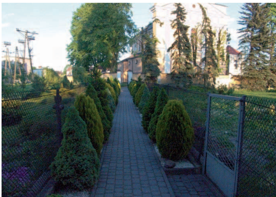
Fig. 28. The newly planted thujas between presbytery and church in Międzyrzec Podlaski (2008)