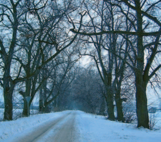
Ryc. 15. Aleja wiodąca do dworu w Brzezicach (2008)

Fig. 15. Alley leading to manor in Brzezice (2008)