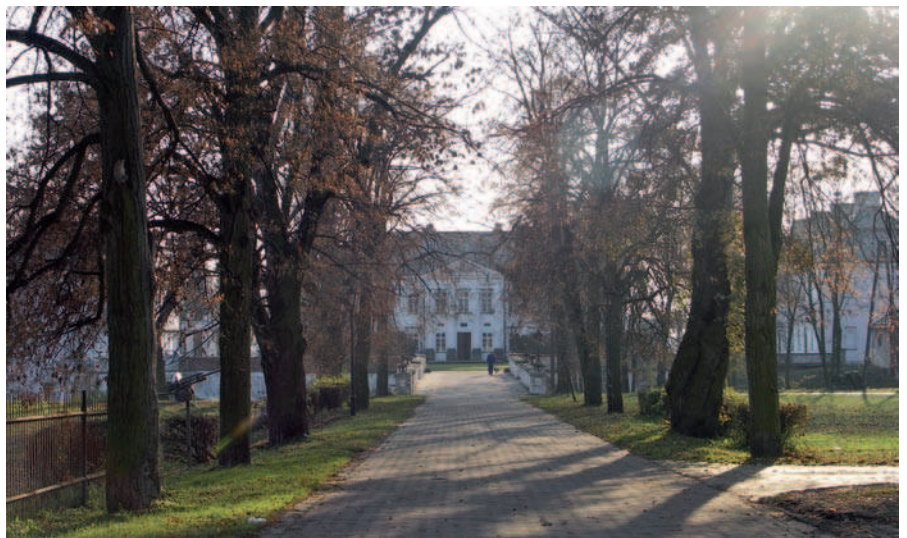
Ryc. 13. Aleja wiodąca do pałacu w Kozłówce, woj. lubelskie (2006)