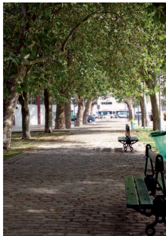
Fig. 2. Paris, park alley, Parc de Bercy (2007)

w porównaniu z innymi regionami Europy i świata. Dla większości mieszkańców charakter danego miejsca określa jakość budowl i przestrzeni miejskich, jak też wygląd i przebieg tradycyjnych, zadrzewionych tras komunikacyjnych. Droga czy ulica oprócz pełnienia funkcji komunikacyjnych jest jednocześnie elementem porządkującym przestrzeń. W wielu miejscach Polski zarówno tkanka miejska, ta o wartościach zabytkowych, jak też i dawne trasy komunikacyjne w wyniku różnych działań, w tym przekształceń przestrzennych uległy i nadal ulegają poważnej przebudowie, częstokroć równoznacznej ze zniszczeniem przede wszystkim drzewostanu 1 (ryc. 19, 20).