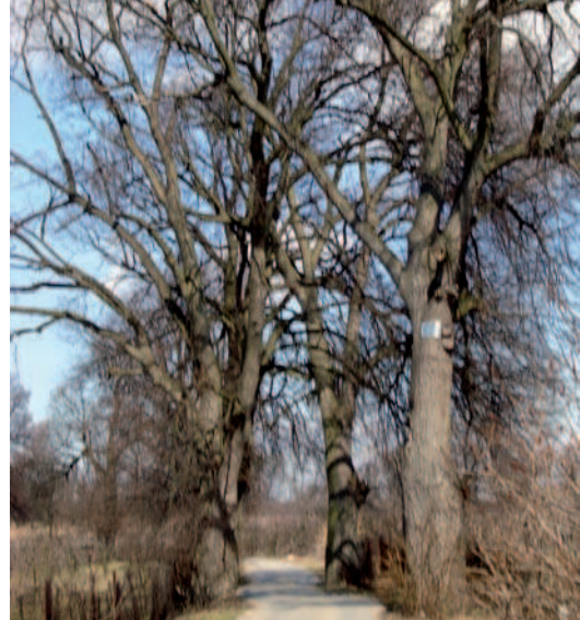
Ryc. 18. Zachowany fragment alei kasztanowców między kościołem a cmentarzem w Trójcy, woj. świętokrzyskie (2011)

Fig. 20. The appearance of the road shoulder Lublin-Łęczna after the modernization, lubelskie voivodeship (2006)