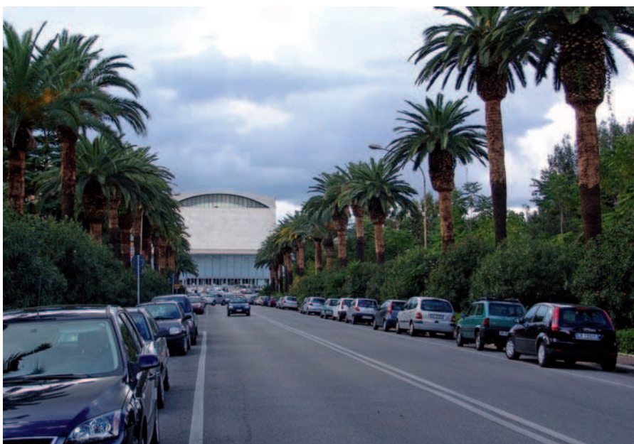
Ryc. 6. EUR-Rzym, Włochy, aleja palmowa (2008)