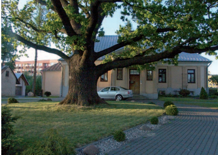
Fig. 27. The historic oak in front of the presbytery in Międzyrzec Podlaski (2009)

6. Przesmycka E., Próba oceny zmian krajobrazowych otoczenia dróg w ciągu ostatnich dziesięciu lat na Lubelszczyźnie [w:] mat. Krajowej Konferencji Naukowo-Technicznej, Zamość, 7-8 Września 2000 r., pt. Ochrona Środowiska i Estetyka w Drogownictwie, Teoria i Praktyka , Lublin 2000, s. 91-99.