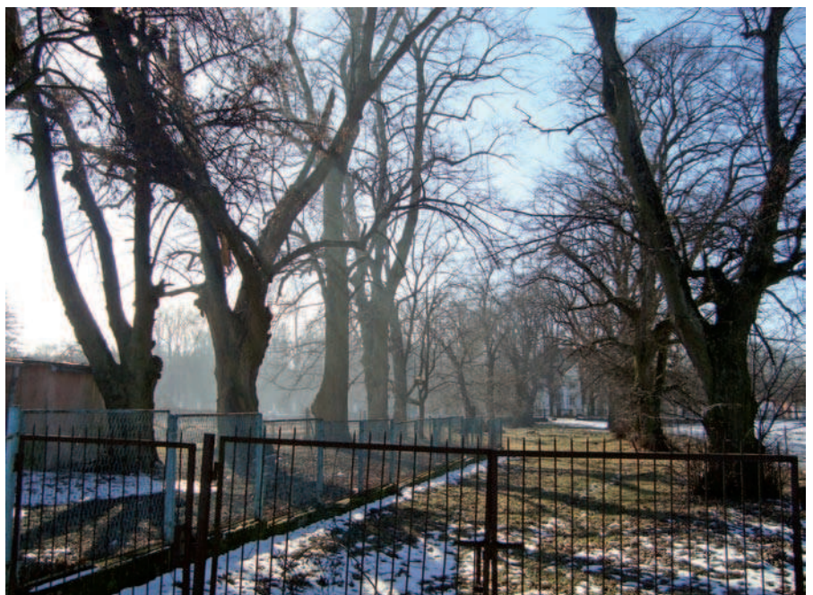
Ryc. 14. Aleja wiodąca do pałacu w Gościeradowie (woj. lubelskie), podzielona ogrodzeniami nowych właścicieli (2008)