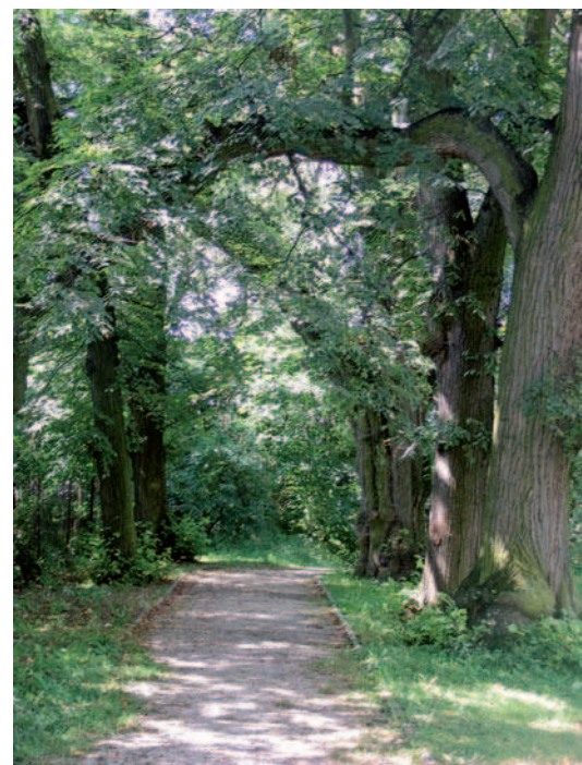
Ryc. 11. Książ Wielki, aleja parkowa (2009)

Pod zaborem rosyjskim sadzenie drzew było nakazane Ukazami Carskimi i dotyczyło przede wszystkim szlaków biegnących między „twierdzami” i ościennymi miasteczkami w celu ochrony maszerujących żołnierzy przed promieniami słońca. Faktem jest, iż na planach pochodzą-