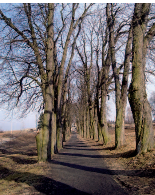
Ryc. 17. Aleja kasztanowców między kościołem a cmentarzem w Wojciechów, woj. lubelskie (2011)

Fig. 16. Alley leading to palace in Igołomia, małopolskie voivodeship (2011)