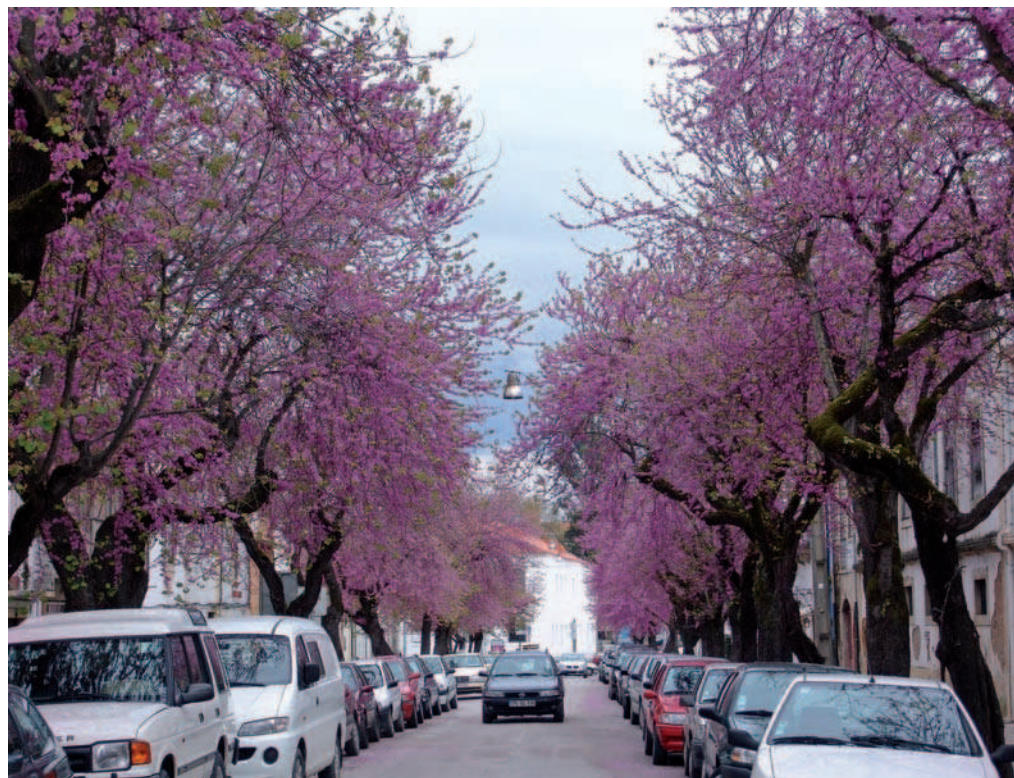
Ryc. 3. Portugalia, Tomar, główna ulica w mieście (2007)

nieodłączny składnik funkcjonalny ulic miejskich, otoczenia dróg, granic upraw rolnych, otoczenia obiektów przemysłowych, terenów wypoczynkowych. Zaczyna nabierać znaczenia utylitarnego, w przeciwieństwie do dawnego, głównie podejścia estetycznego. Większość zachowanych w Polsce alei pochodzi z tego właśnie okresu. Istniejące jeszcze