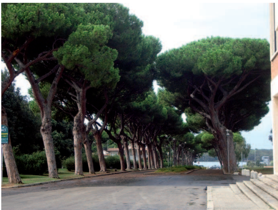
Ryc. 5. Sabaudia, Włochy, aleja piniowa (2008)