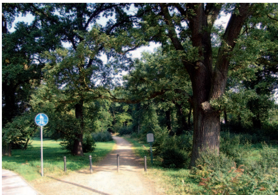
Fig. 8. Brussels, Belgium, Parc de Cinquantenaire (2010)