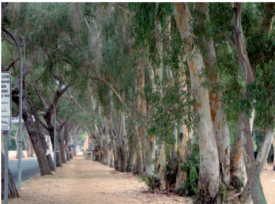
Ryc. 4. Sabaudia, Włochy, aleja eukaliptusowa (2008)