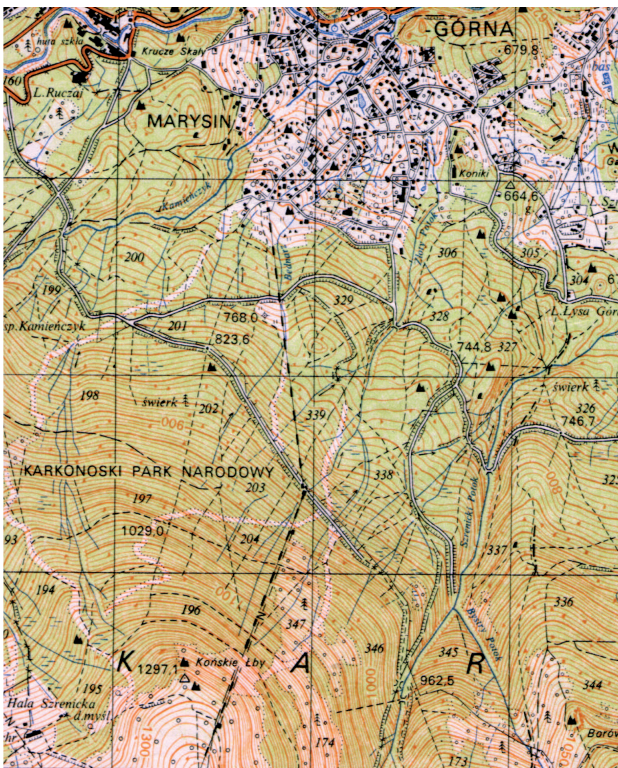
Ryc. 6. Szrenica na polskiej mapie 1:25 000 z 1984 r.