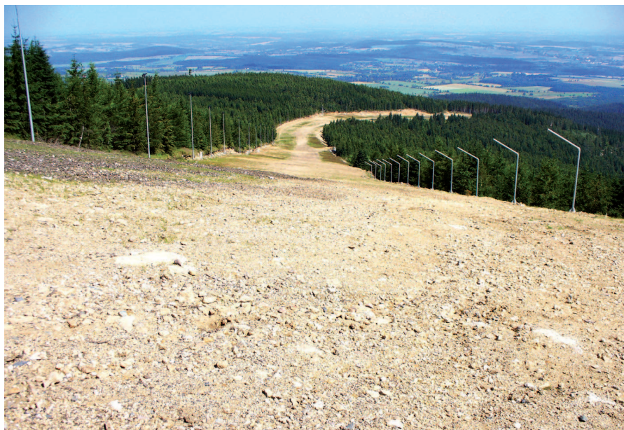
Fig. 11. Summer 2009, downhill track from Stóg Izerski, on the sides visible permanently snow machines and lighting poles