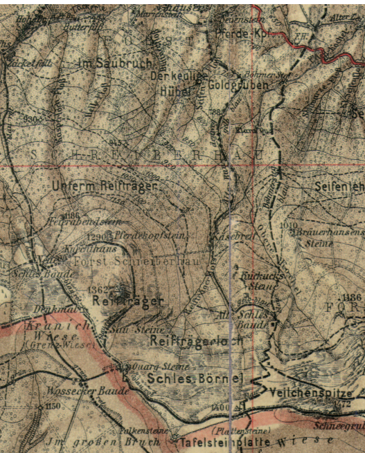
Ryc. 4. Szrenica na mapie Kiesslinga (1:40 000)