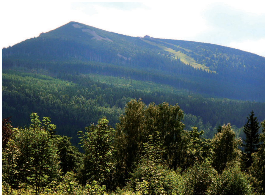
Ryc. 12. Pomimo upływu kilkudziesięciu lat od realizacji kolei na Kopę i związanych z nią tras narciarskich nadal są one doskonale widoczne w terenie