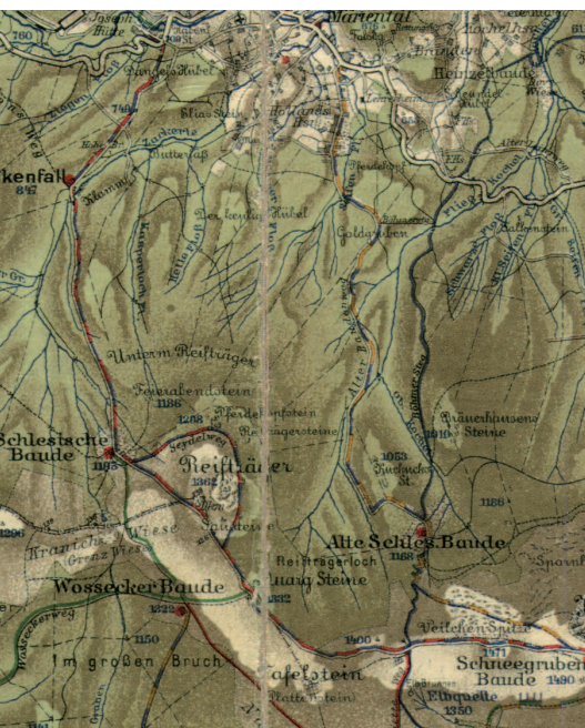
Ryc. 5. Szrenica na letniej mapie Meinholda (1:50 000) z okresu międzywojennego