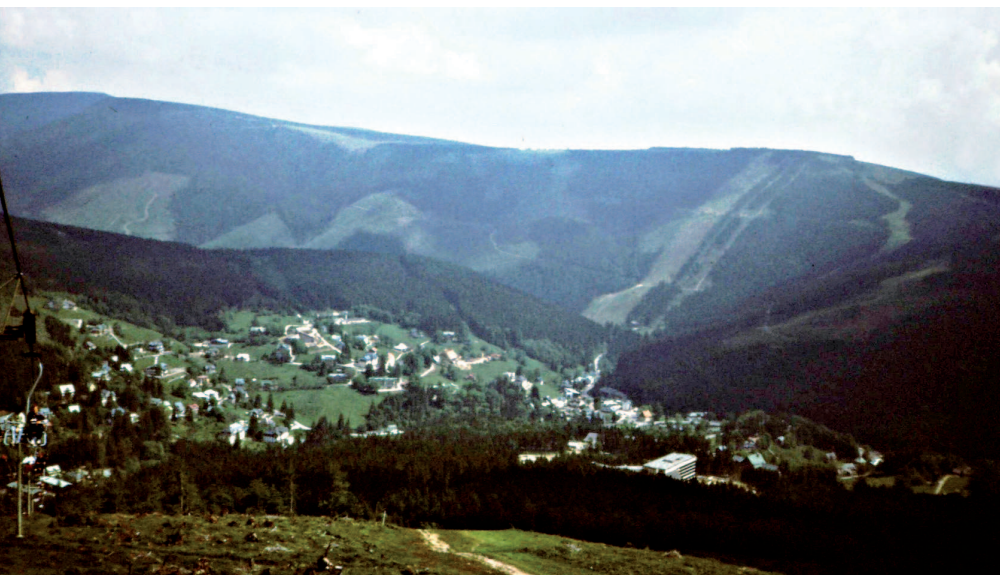
Ryc. 13. „Pełne zagospodarowanie narciarskie” – czy chaos przestrzenny? Czy tak ma wyglądać przyszłość chronionego krajobrazu górskiego? Przykład z Karkonoszy czeskich

Instytut Architektury Krajobrazu Uniwersytet Przyrodniczy we Wrocławiu Institute of Landscape Architecture Wrocław University of Environmental and Life Sciences