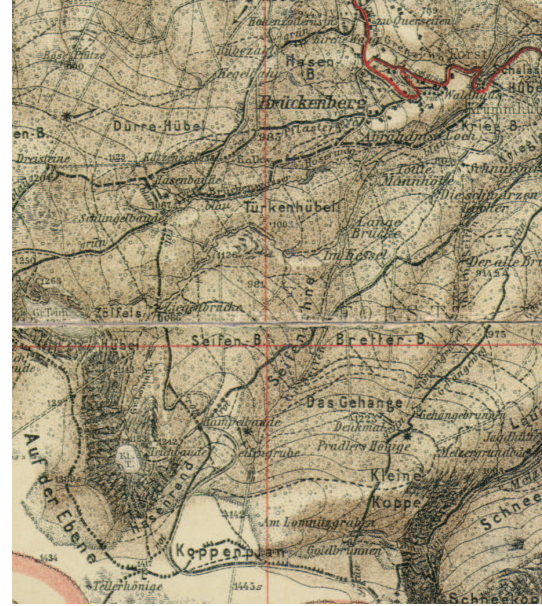
Fig. 1. The German map of Kiessling 1:40 000 area of Kopa, the site in the beginning of the twentieth century