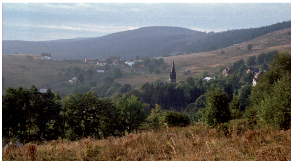
Ryc. 8. Zieleniec ok. 1990 r.

Polska strona Sudetów zdaje się o choczko podążać tą samą drogą, ale na szczęście rozmach i możliwości inwestorów są tu zdecydowanie mniejsze, chociaż skutki już wyraźnie widać. Na pierwszy plan wysuwają się najstarsze stacje narciar-