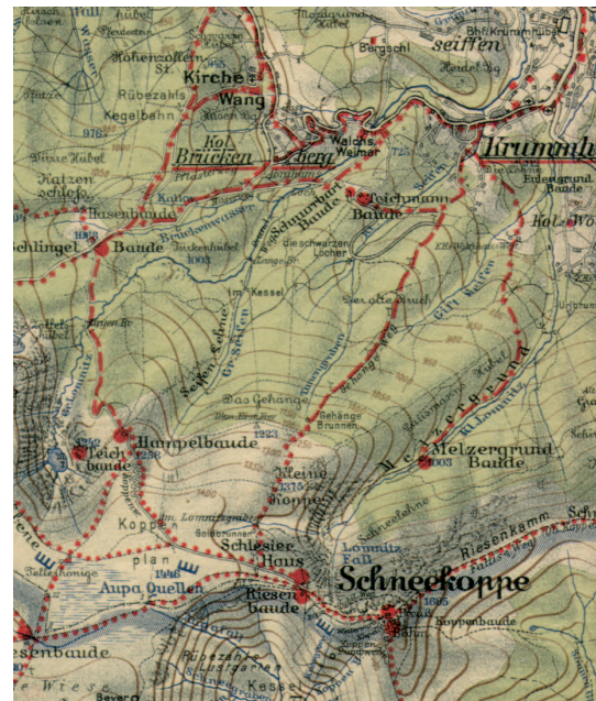
Ryc. 2. Mapa rejonu Kopy Reinholda 1:50 000 (zimowa) z okresu międzywojennego