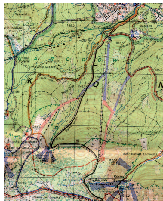
Ryc. 3. Rejon Kopy na czeskiej mapie 1:25 000 z 1995 r.