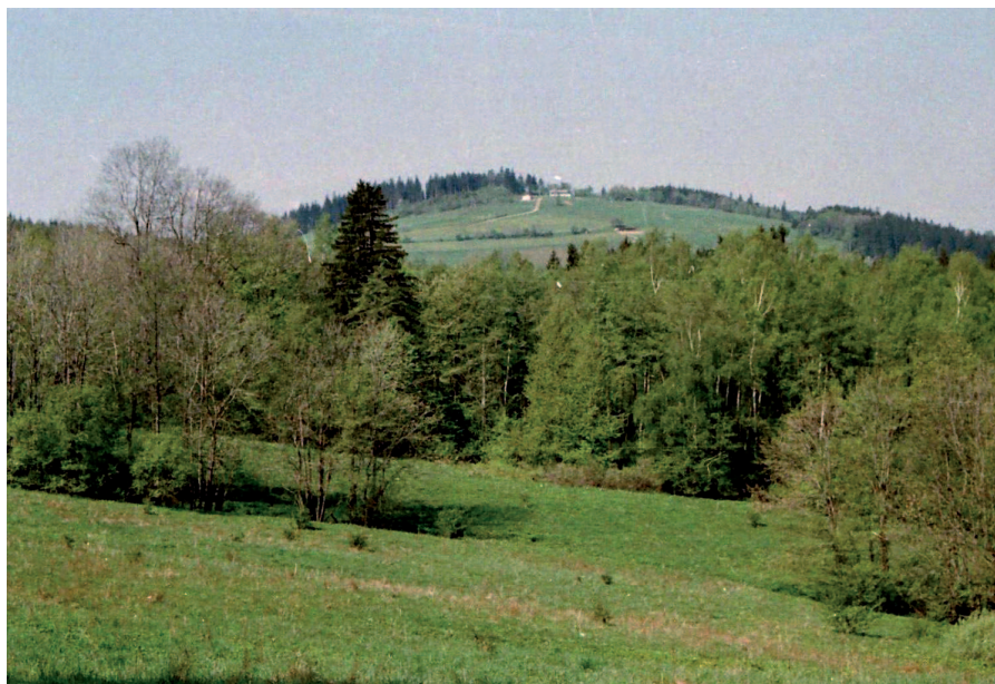
Fig. 9. Łysa Góra in the Kaczawa Mountains has the status only of “microstation”, but even in the summer is a discrepancy in the landscape

skie na Szrenicy i Kopie w Karkonoszach, ale dorównują im młodsze, które tworzono z większym rozmachem: Zieleniec z Jamrozową Polaną (ryc. 8), Polana Jakuszycka, Czarna Góra czy ostatnio Stóg Izerski. Jeżeli uwzględni się mniejsze ośrodki typu Łysa Góra (ryc. 9), Andrzejówka, Wielka Sowa z Rzeczką i Sokolcem widać, że nasycenie infrastrukturą narciarską polskich Sudetów jest już znaczne, a przecież w wielu miejscach funkcjonują jeszcze pojedyncze wyciągi i trasy o lokalnym znaczeniu.