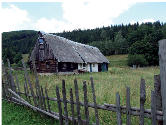
Fig. 3. Examples of regional architecture, Bielice village