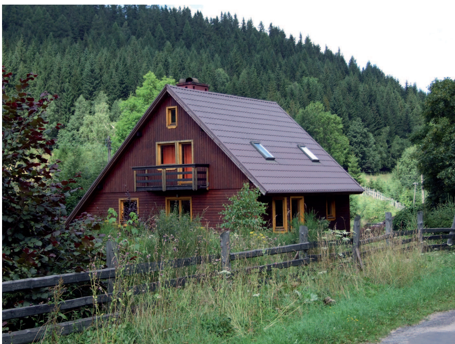
Ryc. 8. Przykłady właściwych, regionalnych rozwiązań architektonicznych w nowej zabudowie wsi Bielice

Troska o harmonijny krajobraz rustykalny musi mieć na uwadze zmieniające się warunki społeczno-gospodarcze. Zaobserwowane na przykładzie Bielice przemiany krajobrazowe odnieść można do sytuacji wielu wsi sudeckich, które borykając się z podupadającym rolnictwem oparły ostateczną wizję rozwoju na inwestycjach z branży turystycznej i letniskowej. Widoczna poprawa standardu życia mieszkańców i wzrost zainteresowania terenem wsi jako miejscem do życia stanowi zjawisko pozytywne, jednakże w wielu przypadkach odbywa się to kosztem negatywnych przemian w krajobrazie. Obniżenie granicy rolno-leśnej na skutek odejścia od rolniczego użytkowania ziemi stanowi najbardziej istotny wyraz dążenia przyrody do powrotu do naturalnych granic między zbiorowiskami roślinnymi, które w przeszłości zostały zakłócone przez nadmierną ekspansję człowieka. Zmiana ta nie jest dla krajobrazu niekorzystna. Odmienne ocenić należy nadmierny i pozornie kontrolowany rozwój zabudowy, którego forma jest najczęściej odzwierciedleniem marzeń letników bądź bogatych inwestorów, a nie wyrazem kształ-