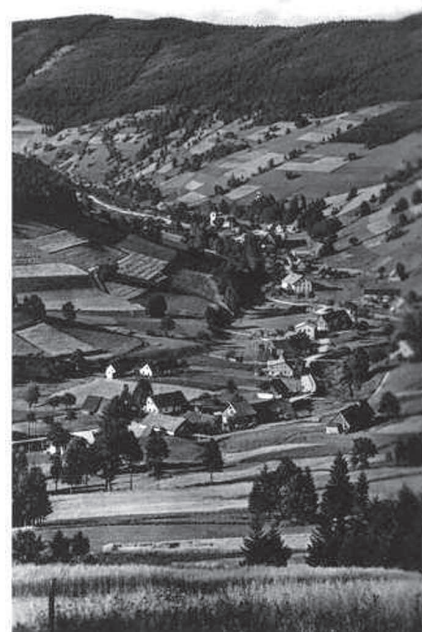
Ryc. 2. Rozwinięty łańcuchowy układ wsi Bielice na pocz. XX w.

Przez wieki w krajobrazie kulturowym Bielice wykształciły się cechy świadczące o powiązaniu obszaru z otoczeniem i tradycją. Wrazem przystosowania do morfologii terenu stał się łańcuchowy układ wsi (ryc. 2), a regionalizm kulturowy uwidacznia się w jej krajobrazie głównie poprzez tradycyjną architekturę zabudowy. Wiele budynków zachowuje tu czystą formę ar-