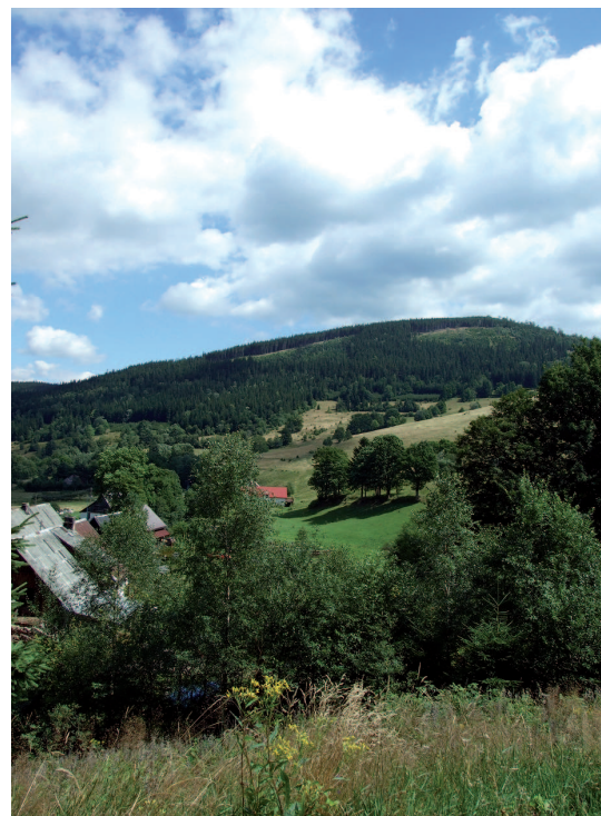
Ryc. 4. Wtórna sukcesja leśna na nieużytkowanych pastwiskach

Obszary gospodarki hodowlano-rolnej zajmowały większą część stoków doliny Bielicy, a granica rolno-leśna przebiegała na wysokości od 800 do 860 m n.p.m. (ryc. 4, ryc. 5a). Potwierdzeniem prowadzenia wtedy intensywnej działalności rolnej była ponadto obecność 4 młynów wodnych zlokalizowanych w centralnej i górnej części wsi oraz gęsta sieć dróg gospodarczych położonych w górę stoków, wzdłuż obszarów gospodarki hodowlano-rolnej. Na podstawie przedwojen-