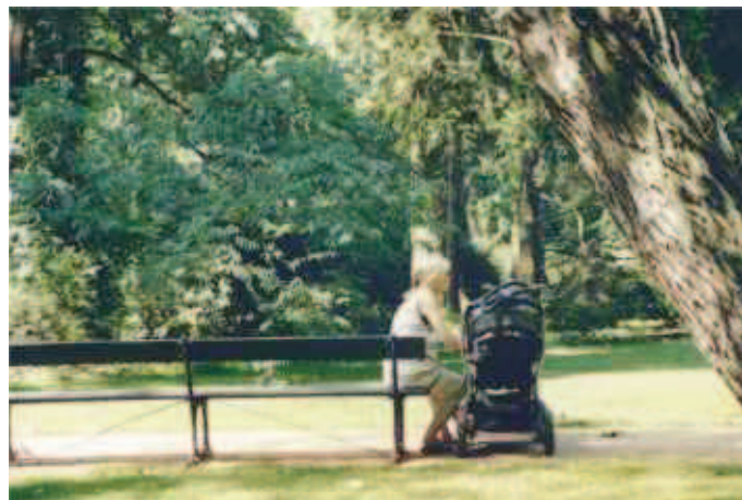
Fot. 4. ... jak i szukających chwil wypoczynku w „zielonym zabytku” stałych mieszkańców miasta.