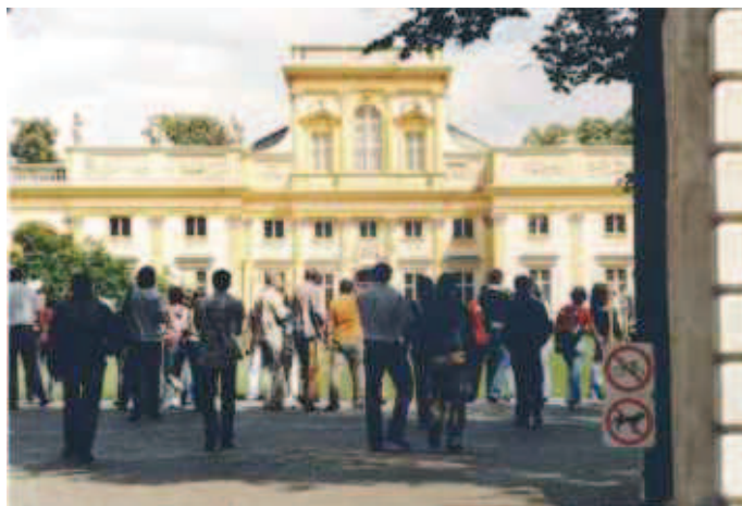
Fot. 2. Barokowy pałac i barokowo – krajobrazowy park w Wilanowie (założone w XVII wieku) są odwiedzane przez kilkaset tysięcy turystów rocznie, to historyczne założenie pałacowo-parkowe jest uważane za jedną z największych atrakcji turystycznych Warszawy. Z powodów ochrony konserwatorskiej ilość odwiedzających zarówno muzeum we wnętrzach pałacowych jak i ogród – jest z konieczności kontrolowana za pomocą ilości sprzedawanych biletów wstępu (fot. Anna Pawlikowska–Piechotka, 2008)