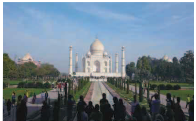
Fot. 1. Taj Mahal, założone w XVII wieku monumentalne słynne ogrody i grobowiec w Agrze są odwiedzane przez blisko 4 000 000 turystów rocznie (większość gości z zagranicy), nie przerażonych koniecznością stania w wielogodzinnej kolejce przed wejściem do muzeum. Zespół ogrodu i grobowca Taj Mahal jest powszechnie uważany za najlepiej rozpoznawalną „markę” zabytków Indii – znakomitą ikonę dla promocji turystycznej kraju