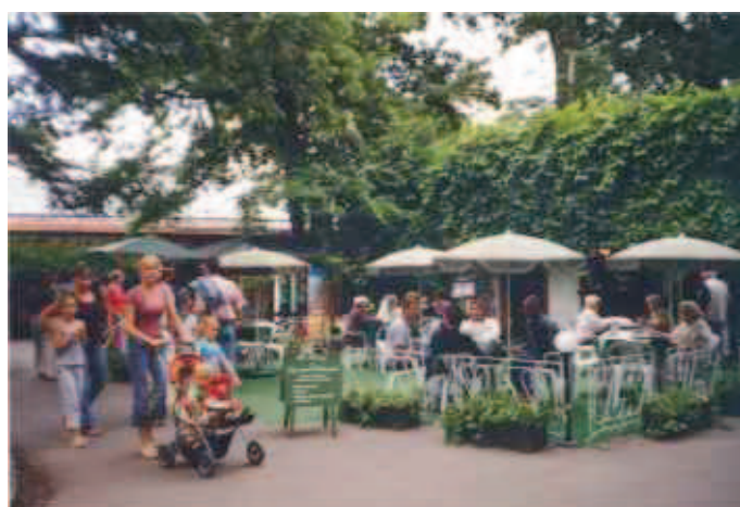
Fot. 5. Założenie Pałacowo–Parkowe Łazienki Królewskie w Warszawie. Chęć zapewnienia licznym odwiedzającym park możliwości korzystania z usług gastronomicznych, bogata oferta kawiarni, piwiarni, restauracje i ruchome punkty gastronomiczne w zabytkowym parku – przeczą zasadom konserwatorskim