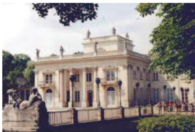
Fot. 3. Klasycystyczny park w Łazienkach Królewskich w Warszawie jest odwiedzany przez blisko 1 000 000 osób w skali roku: zarówno tłumy turystów...